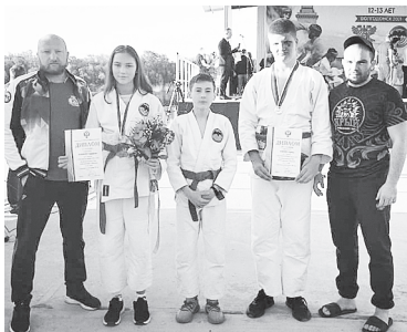
Аксайчане на соревнованиях.