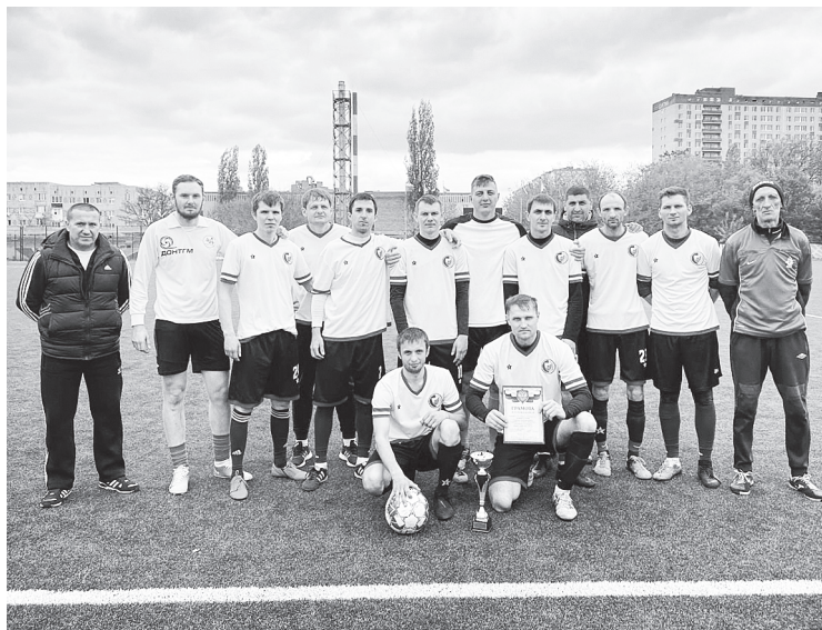
Команда поселка Дорожный.

Победителем турнира стала команда «Боец» из поселка Реконструктор, на втором месте аксайчане, на третьем – футболисты из Дорожного.