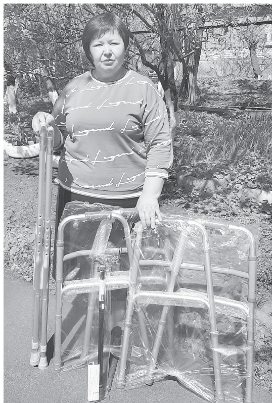
В апреле пункт проката средств реабилитации пополнился новыми предметами.