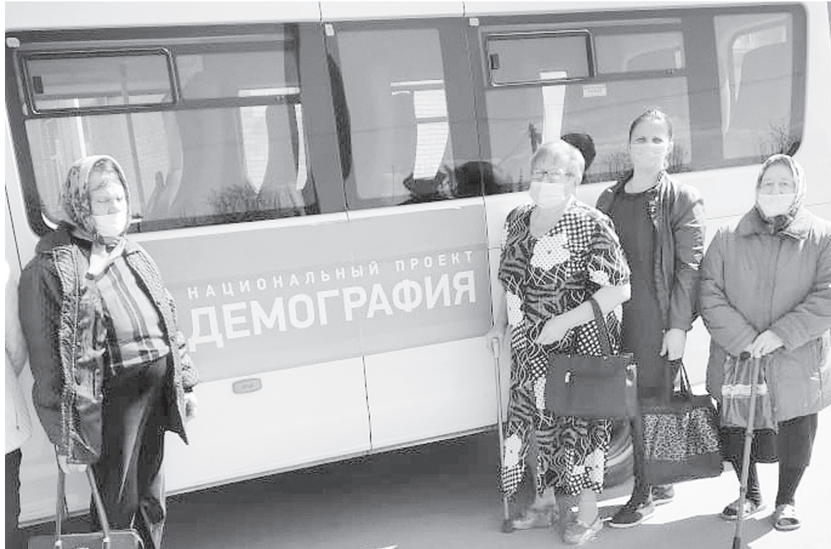
Автобус «Демография» доставляет пожилых граждан и инвалидов на прием в поликлинику.

На базе Центра социального обслуживания работает пункт проката технических средств реабилитации для временного обеспечения инвалидов техническими средства-