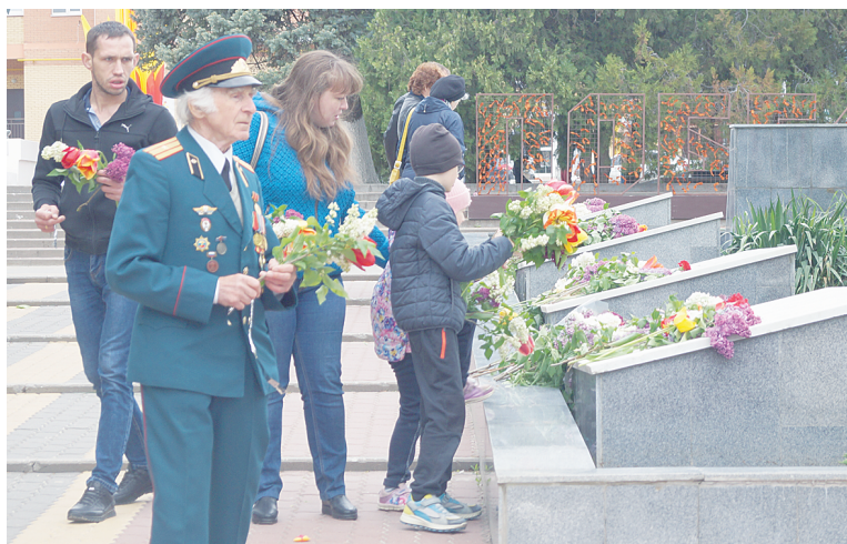
Аксайчане возложили цветы к братской могиле на площади Героев.

В Межпоселенческой библиотеке имени Шолохова открылась ставшая традиционной выставка «Дороги войны – дороги Победы!». На стендах представлены фотографии, портреты, заметки и статьи из газет военных лет, отражающие основные события Великой Отечественной войны от жестокого 1941-го до победного 1945 года. В первый день выставку посе-