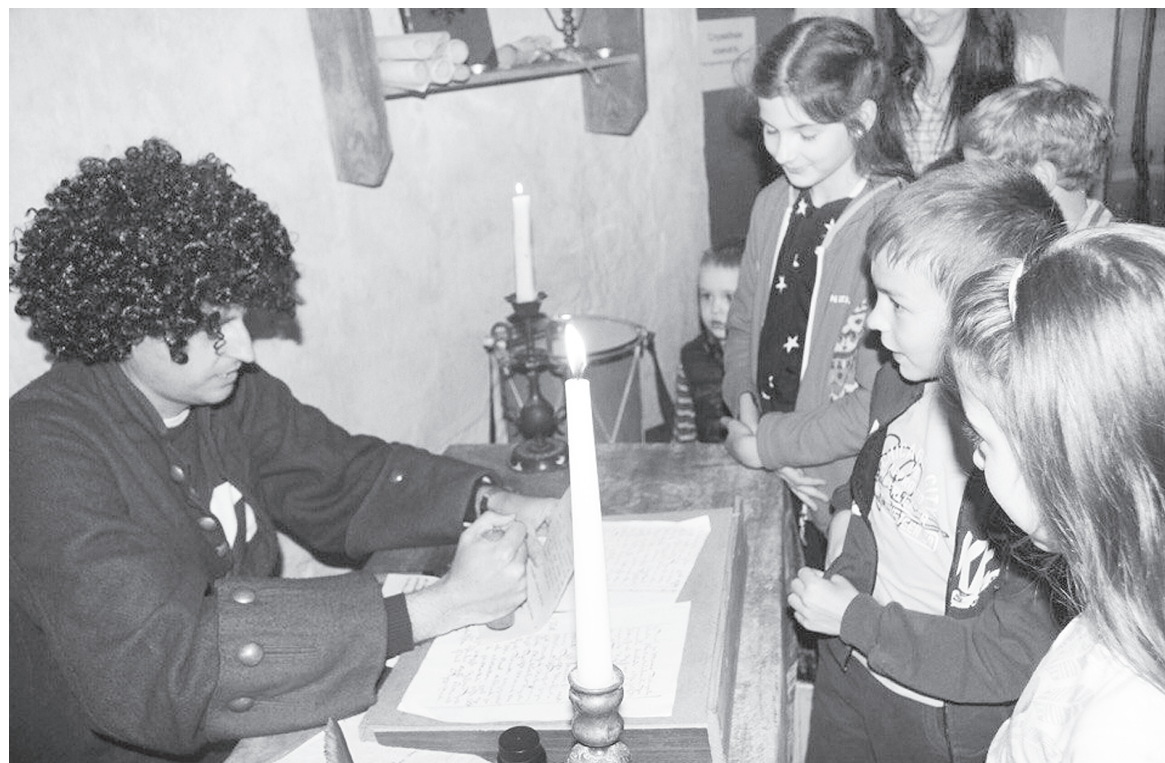
«Ночь в музее» на таможенной заставе. «Проезд разрешается».

Позитивное настроение от посещения выставки остается не