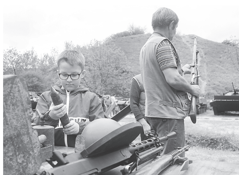
Выставка оружия вызвала интерес у детей и взрослых.

Музейный комплекс «Таможенная застава» 22 мая продолжает трилогию с мероприятием