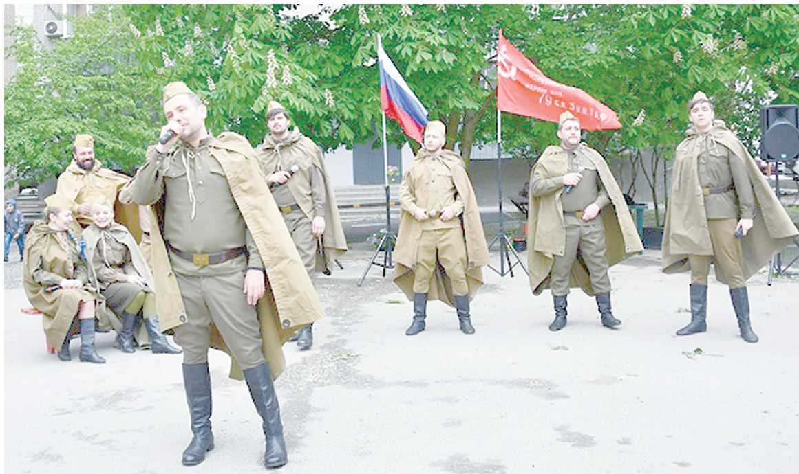
«Фронтальная бригада» в Аксее.