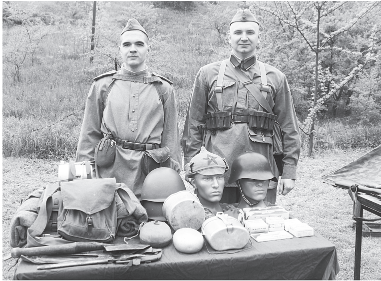
На выставке областных клубов на военно-историческом комплексе – макеты и армейские вещи Красной Армии.

Летом музей планирует создать новые выставки к новому учебному году. Сотрудники хотят показать современные поступления музея, а еще в выставке «Храните ваши денежки» рассказать о копилках, деньгах,