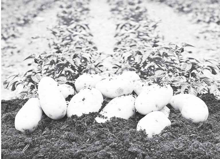
Вот такой картофель ждем в этом году!

чечевицу, решил ввести в оборот СПК «Колхоз Донской», и уже посеял. Просу отведено по плану 180 га, но сеять его еще не начинали.