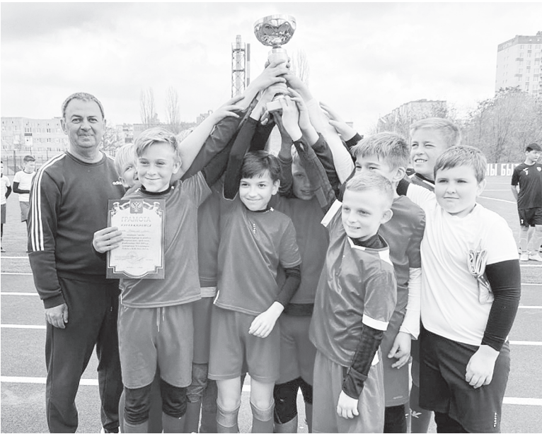
Футболисты «Юности – 2009».

На первом месте – команда «Юность – 2009» (г. Аксай), на втором – «Юность – 2008» (г. Аксай), на третьем – команда Ольгинской СОШ № 1.