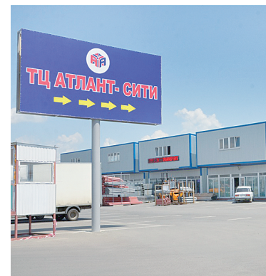
Рассмотрение заявки займет один день.