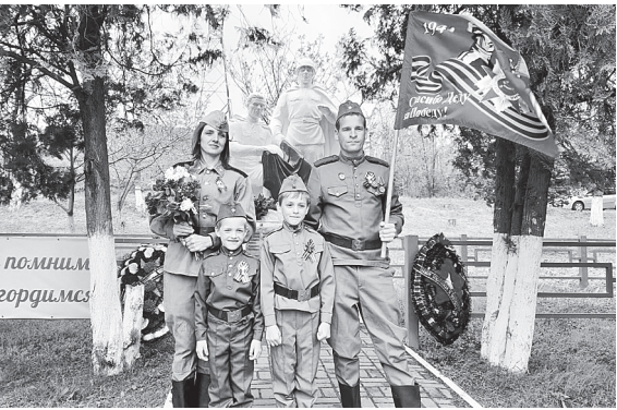
Накануне и в День Победы казаки возложили цветы к памятникам.