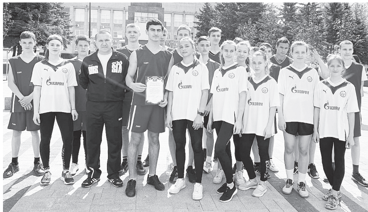
Команда Большелогской школы. / ФОТО Юлии Баландиной

На время проведения соревнований движение транспорта на данном участке было перекрыто. В 9:30 утра после торжественного построения школьники приготовились к старту.