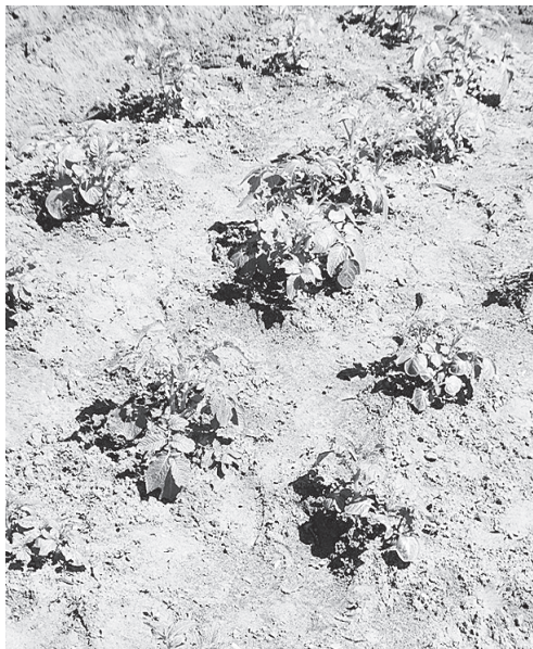
В первые дни мая картофель только взошел.

По культурам ситуация следующая. Яровой ячмень размещен в сельхозпредприятиях на площади 454 гектара из 555, ИП, КФХ и казачьи общины отсеялись на той площади, которую и намечали – 300 га, в целом же по району яровой ячмень посеян на 754 гектарах из 855, что составляет 88 процентов. Более-менее заметные площади под ячмень отвели СПК «Колхоз Донской», КФХ «Цветков», другие хозяйства. Овес возделывается у нас в этом году на 60 гектарах, его сеет одно и то же хозяйство – ООО «Аксай СХП», горох планировалось разместить на 676 гектарах (ООО «Темерницкое», КФХ «Цветков», ФГБНУ ФРАНЦ), фактически засеяно 660. Новую в наших условиях бобовую культуру,