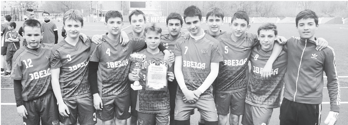
Команда «Звезда» Ленинской СОШ.

Команды – победители и призеры были награждены кубками и грамотами от отдела по физической культуре, спорту, туризму и работе с молодежью Администрации Аксайского района.