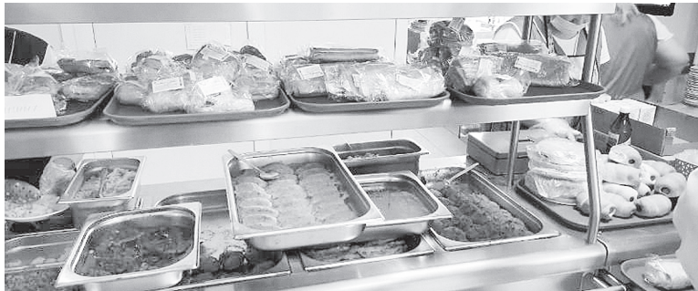
В столовой Аксайской СОШ № 2.