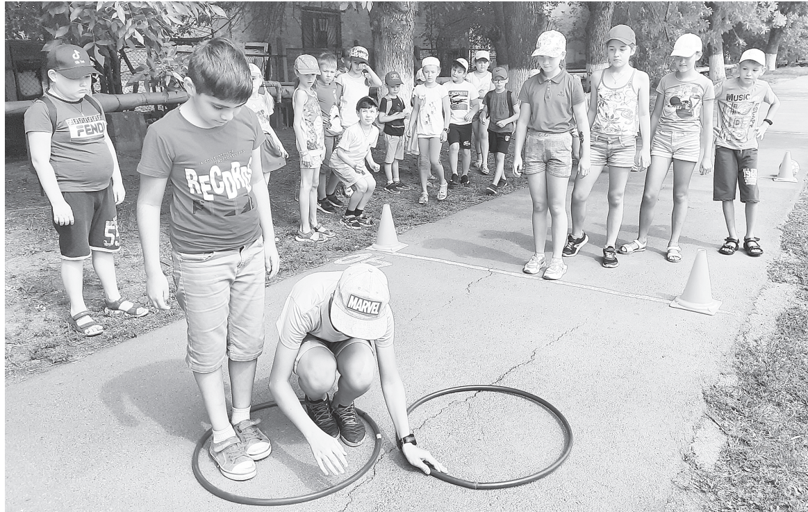
Пандемия коронавируса не помешала детям отдохнуть в 2020 году. Не помешает и в этом.

В ЛЕТНИЙ ПЕРИОД 2021 ГОДА ВСЕМИ ВИДАМИ ОТДЫХА, ОЗДОРОВЛЕНИЕМ И ЗАНЯТОСТЬЮ БУДЕТ ОХВАЧЕНО ОКОЛО 12,5 ТЫСЯЧИ ДЕТЕЙ