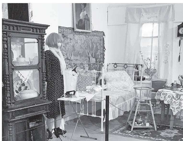
Выставка «Мать и дитя».

Наших предков кукла сопровождала всю жизнь. Еще до рождения младенца у его будущей колыбели появлялась кукла, отгоняющая злых духов. Младенчество, детство, отрочество, юность, зре-