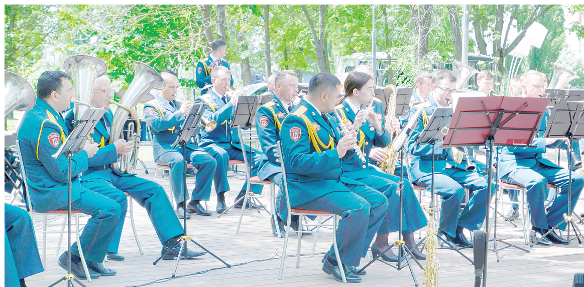
В городском парке выступил оркестр штаба Южного округа войск национальной гвардии России.

Трансляция шествия Бессмертного полка проходила на официальном сайте акции и на других партнерских площадках, в том числе на телеканале «Дон24».