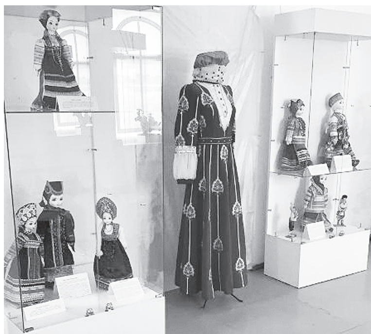
Выставка кукол.

лый возраст, старость – все жизненные этапы человек проживал в присутствии кукол и их активном участии. Даже после смерти кукла была рядом, сопровождая усопшего в иной мир.