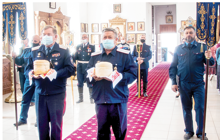
На литургии присутствовали казаки Аксайского юрта.