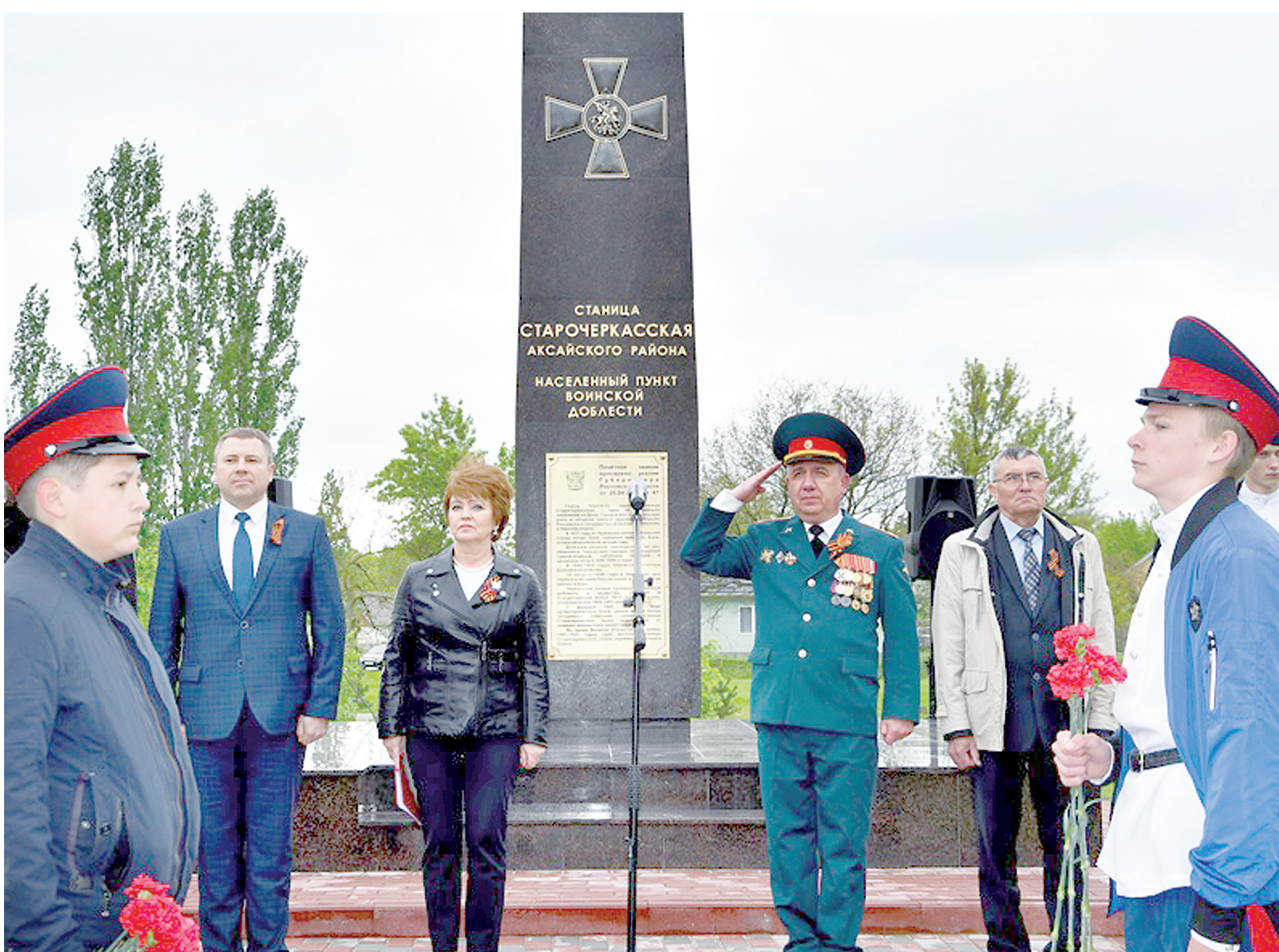
9 Мая в ст. Старочеркасской был открыт памятный знак «Населенный пункт воинской доблести».

ВАЖНО СОХРАНИТЬ ПРЕЕМСТВЕННОСТЬ ПОКОЛЕНИЙ