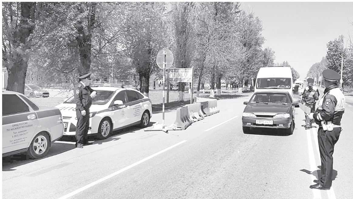
Сотрудники ГИБДД – на посту.

Анализ ДТП позволяет выявить наиболее проблемные участки дорог, где чаще всего происходят дорожно-транспортные происшествия. Одна из самых опасных до-