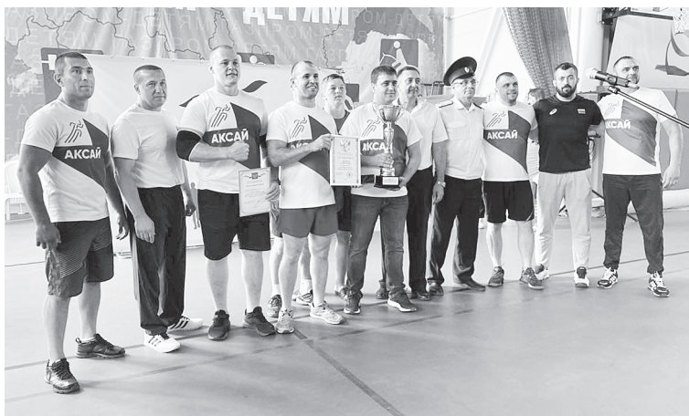
Победителем муниципального этапа стала команда города Аксая.

С приветственным словом к командам обратился и атаман Аксай-