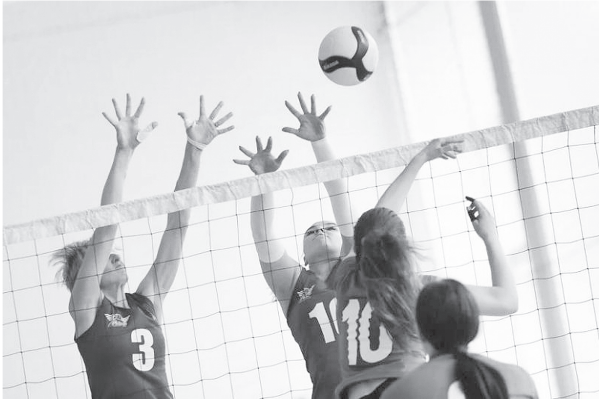
Борьба за мяч.

– Волейбол – это своего рода шахматы на поле. Здесь нужен гибкий ум, скорость реакции, умение предугадать намерения соперника и разрушить его планы на победу. Мои спортсменки, как правило, хо-