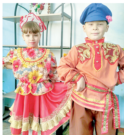
Яркий национальный костюм – отличительная черта объединения танца «Отрада».