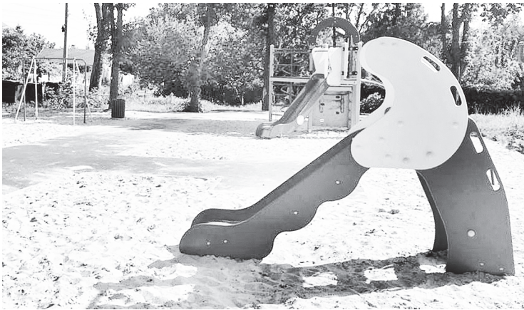
Детскую площадку оборудовали в короткие сроки.

Сертификат на приобретение трех игровых элементов подарила на 100-летие поселка Реконструктор компания-производитель «КСИЛ», еще одну горку перенесли с детской площадки, которая располагалась возле Дома культуры – там сейчас ведется строительство парка, для которого приобретут новые игровые комплексы.