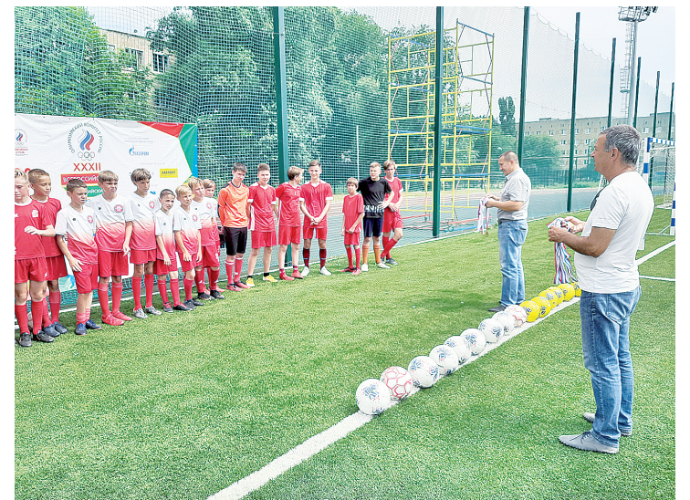
Награждение футболистов ДЮСШ «Юность».

Несомненно, юных зрителей – гостей мероприятия заинтересовали некоторые виды спорта и они с удовольствием в будущем станут последователями героев этого мероприятия. А главное – будут стремиться вести здоровый образ жизни.