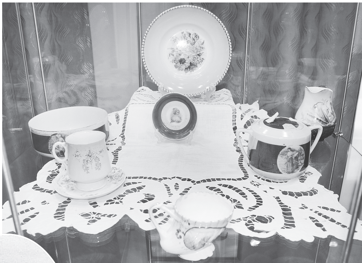
В фондах музея хранятся изделия из фарфоровой империи Кузнецовых. В 1870 году Матвей Кузнецов открывает первую фаянсовую фабрику в селе Буды.

Кроме собственно фарфоровой и фаянсовой посуды, предприятие выпускало майолику, садовую скульптуру, вазы, курительные приборы, садовые и цветочные горшки. Также производилась и архитектур-