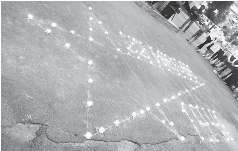
Учащиеся Аксайской СОШ № 1 выложили такой рисунок из свечей.

УЧАЩИЕСЯ АКСАЙСКОЙ СОШ № 2 ПОЧТИЛИ ПАМЯТЬ ГЕРОЕВ ВЕЛИКОЙ ОТЕЧЕСТВЕННОЙ ВОЙНЫ