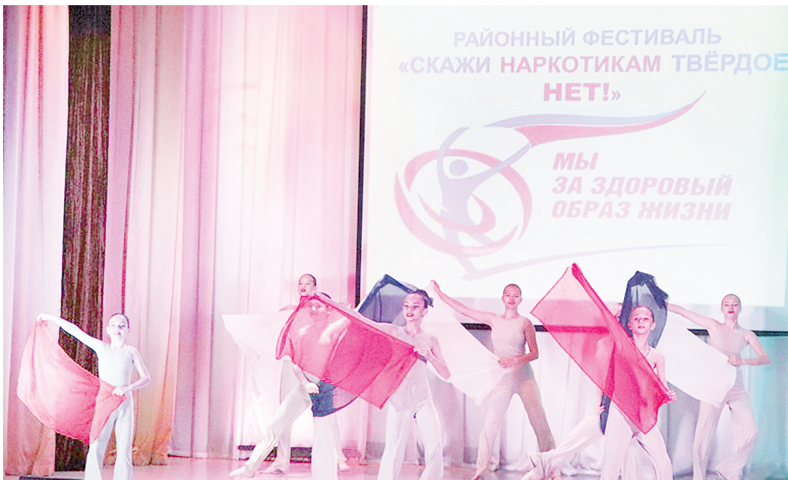
Участники творческих объединений учреждений культуры Аксайского района показали преимущества здорового образа жизни.

В РДК «ФАКЕЛ» ПОДВЕЛИ ИТОГИ РАЙОННОГО ФЕСТИВАЛЯ «СКАЖИ НАРКОТИКАМ ТВЕРДОЕ: НЕТ»