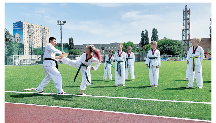
Демонстрация полученных навыков по тхэквондо.