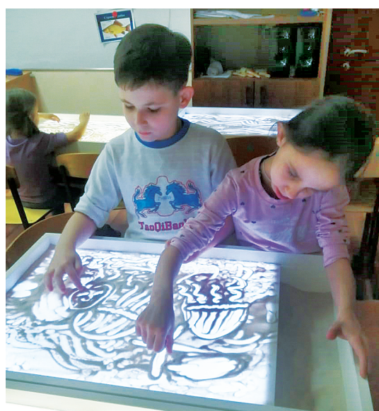
Постигаем азы песочной анимации.