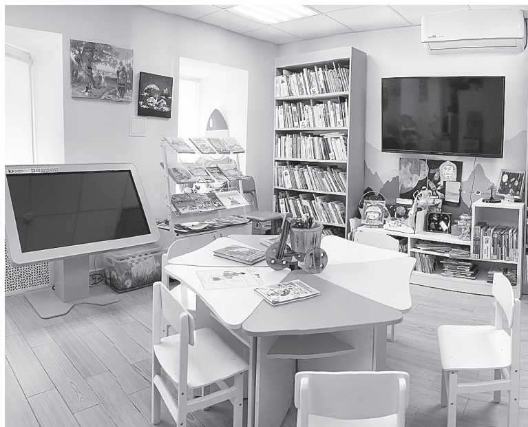
Обновленный читальный зал библиотеки имени А.С. Пушкина.

– Перед открытием библиотеки у нас все сотрудники прошли дистанционное обучение в Российской государственной библиотеке. Мы