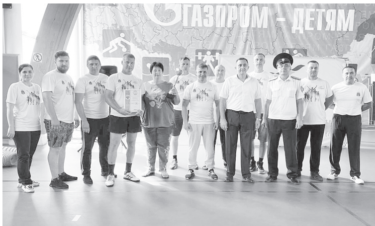
В тройку лучших команд вошла команда Мишкинского сельского поселения.

ского юрта Черкасского казачьего округа Всевеликого войска Донского С.И. Марков.