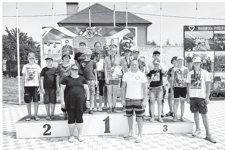
Наша команда.

Желаем спортсменам дальнейших побед, гребной сезон в самом разгаре!