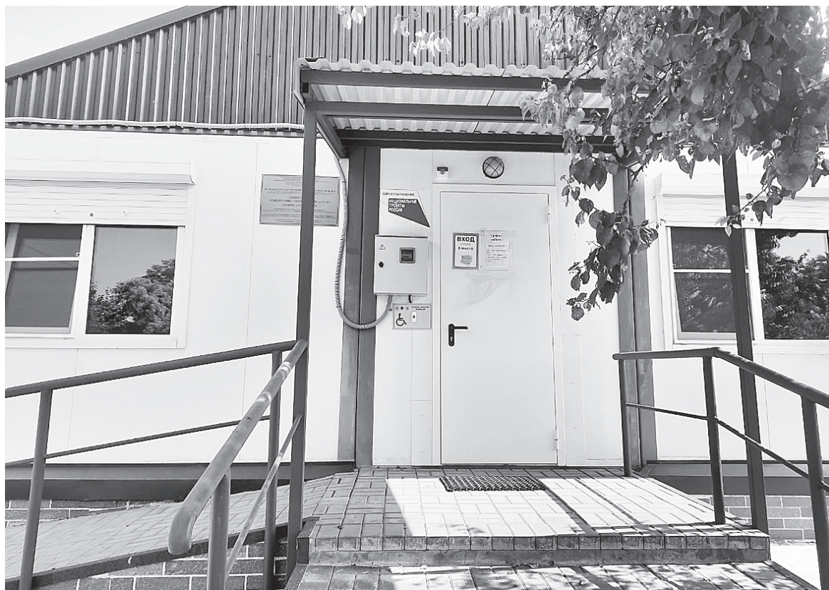
ФАП в хуторе Александровка.

– Когда ты работаешь на скорой помощи, ты видишь пациента один раз и практически не встречаешься с ним больше. Я же вижу пациентов постоянно, при-