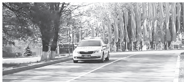
И патруль полицейский – в пути.

Хорошим подспорьем, которое помогает выявлять нарушителей скоростного режима, стали видеокamеры, установленные на дорогах Аксайского района. Приборы фотовидеосъемки дисциплинируют водителей, заставляя сбавлять скорость, тем самым снижают риск возникновения дорожно-транспортного происшествия. Камеры установлены в наиболее опасных местах, где чаще всего происходят аварии.