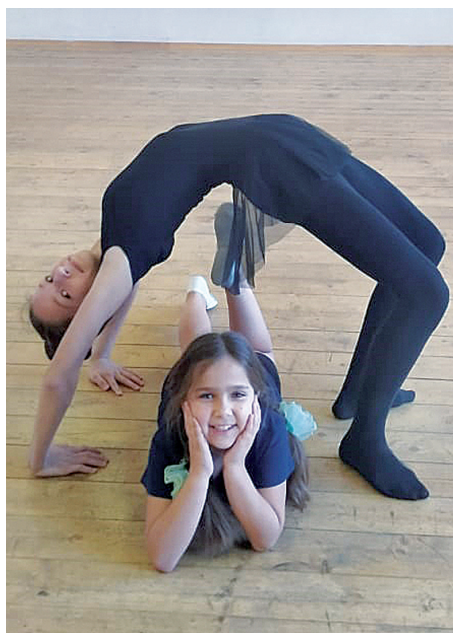
Для танцев необходима хорошая гибкость и пластика. На репетиции объединения танца «Фантазия».