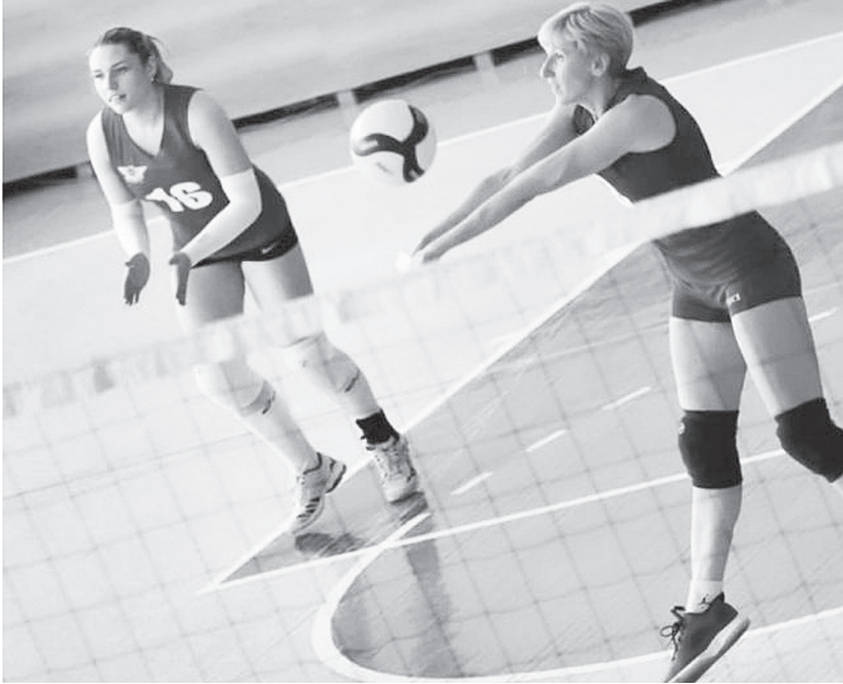
Секунда – и мяч на стороне соперника.

– У нас, как в вальсе, все действия выполняются на три счета. Игра невероятно красивая и зрелищная. В основном я тренирую девочек. Несколько мальчиков приходят на тренировки, но мужской команды у нас нет. К сожалению, у меня не хватает времени, чтобы развивать мужской волейбол. Помимо тренерской деятельности я веду уроки физкультуры в лицее № 1 г. Аксая. Там же органи-