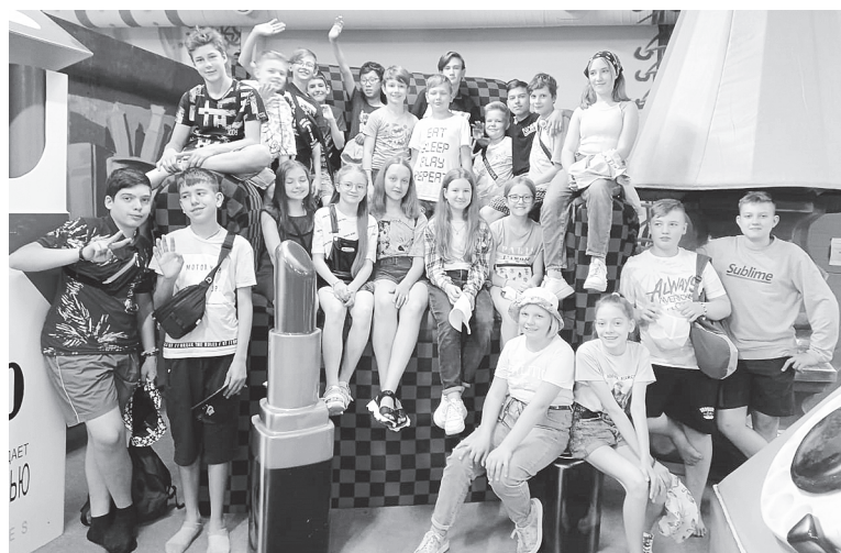
Такие мы дружные ребята!

За эти дни ребята успели побывать в дельфинарии, заглянули в океанариум и пингвинариум, навести птиц в совариуме. В парке аттракционов они фотографировались на фоне привычных предметов исполинского размера в «комнате великана», ныряли в «сухой» бассейн, наполненный шариками, восхищались тропическими бабочками. Тогда же юные путешественники навестили динозавров, которые приветствовали их громкими звуками, покачивали хвостами и кивали огромными головами. Они даже в местный кинотеатр на утренний сеанс сходить успели.