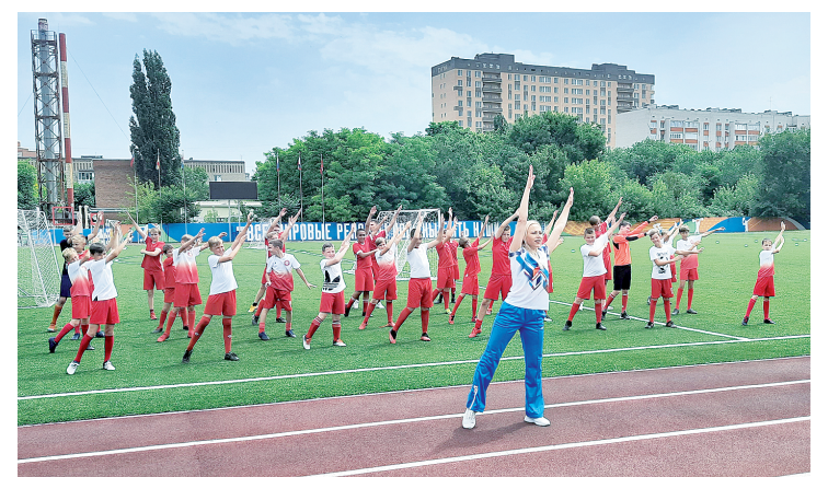
Флешмоб с участием футболистов ДЮСШ «Юность».