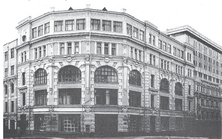
Товарищество М.С. Кузнецова. Сейчас – дом фарфора на Мясницкой в Москве.