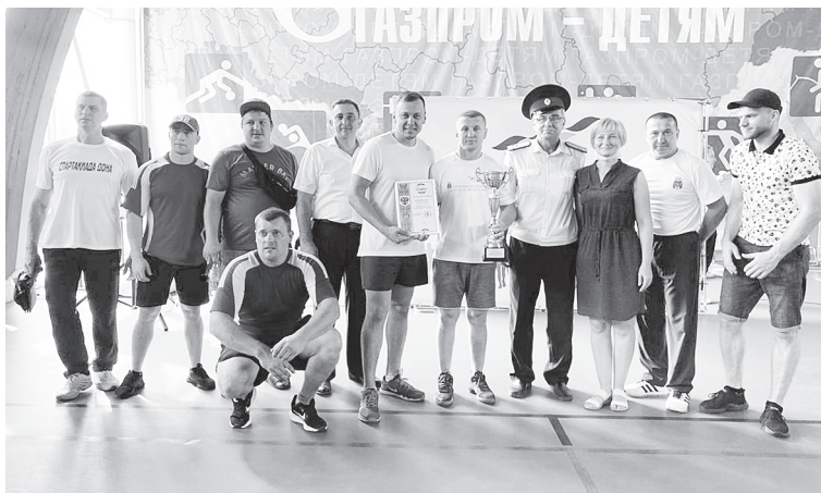
Второе место – у команды Большелогского сельского поселения.