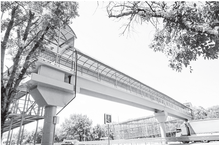
Пешеходный переход возвышается над трассой на пять с половиной метров.