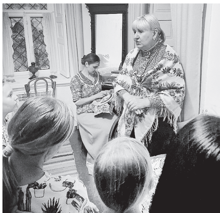
Театрализованная экскурсия в казачьем курене.

В течение всего вечера гости оставались энергичными и веселыми. Не скучали и дети, ведь сотрудники музея, представляя историю казачьего быта из поколения в поколение, предоставляют возможность посетителям стать частью этого исторического периода.