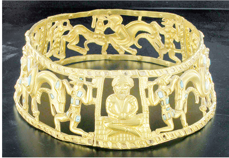
Шейная гривна сарматской жрицы.

По словам В. И., в Кобяковой балке производились раскопки. Собирались знакомые станичники, дали нахичеванской ворожее 10 рублей за предсказание; та отпустила с ними разноглазую девчонку в качестве «упыря» (разноглазую, то есть с одним карим, другим серым