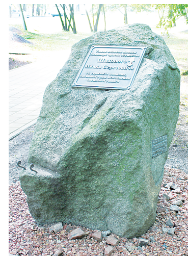
Мемориальный камень.