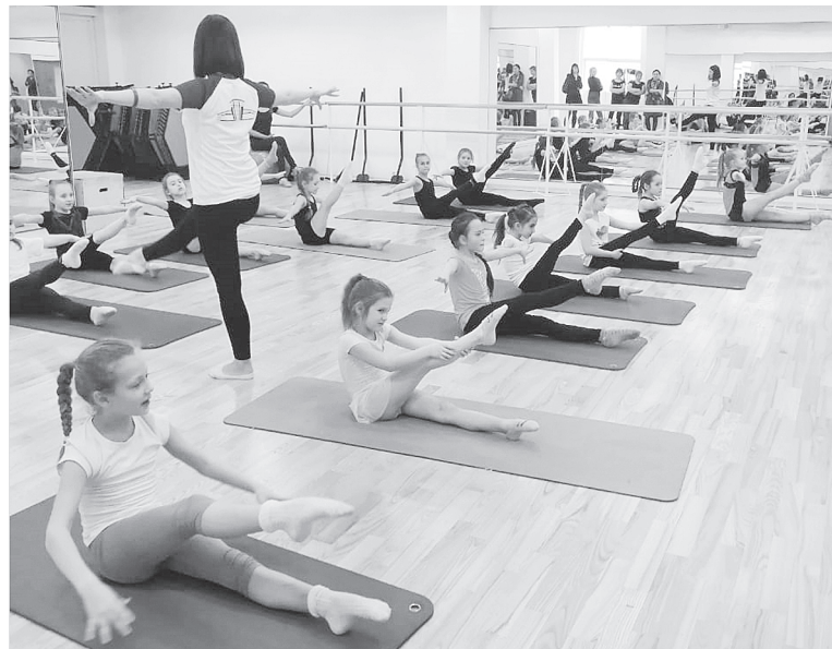
Тренируются аксайские синхронистки.