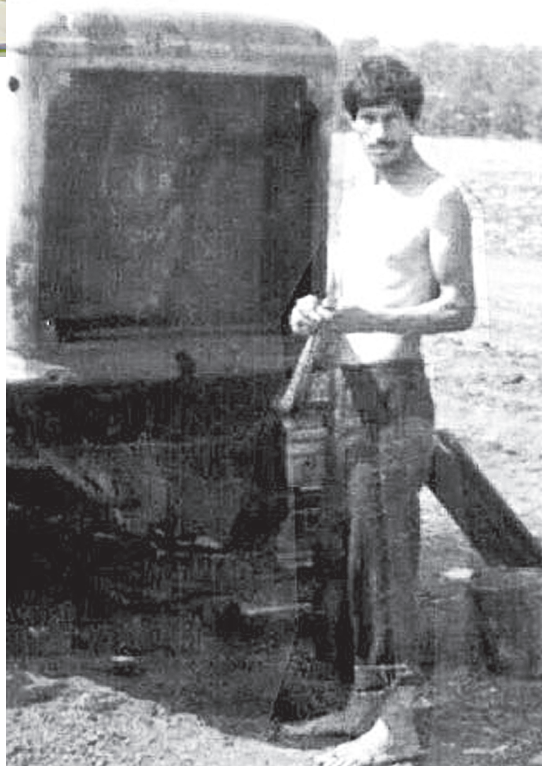
Е.И. Беспалый.

«Если при жизни Беспалого сравнивали с Генрихом Шлиманом, нашедшим легендарную Трою, то после его скоростного ухода вспомнили о загадочных обстоятельствах смерти египтолога – графа Джорджа Карнарвона, вскрывшего гробницу Тутанхамона.