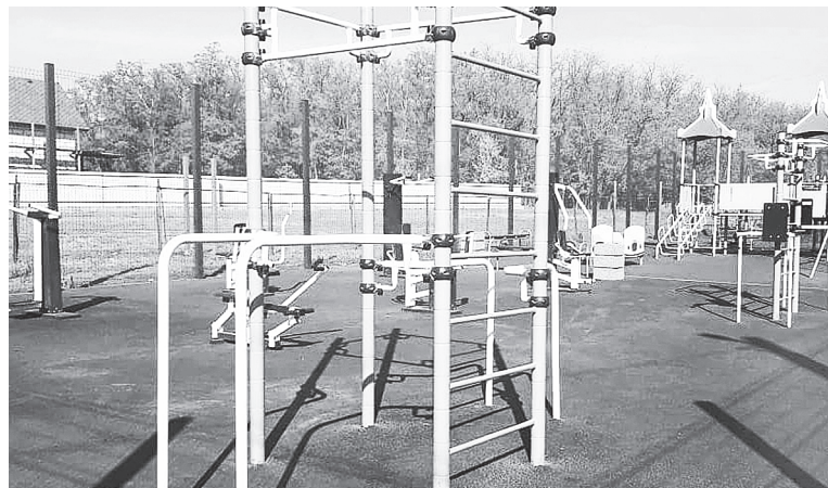
Спортивная площадка в поселке Щепкин.

– В настоящее время на терри- тории района активно развивается движение «Волонтеры спорта», в рамках которого молодые ребята могут реализовать себя в спорте, даже если по каким-то причинам они не могут заниматься физической культурой. Конечно, это направле- ние развивается под руководством Волонтерского центра Аксайского района, созданного при отделе по ФКСТ и работе с молодежью Адми- нистрации Аксайского района, а та- же благодаря тренерскому составу ДЮСШ.