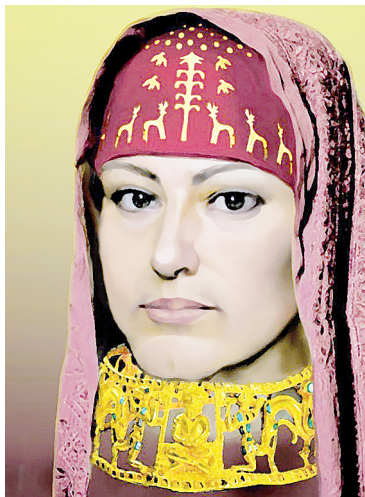
Облачение сарматской жрицы. Реконструкция.

Из многочисленных «известных» кладов могут быть взяты очень немногие, да и то с большим трудом, при целом ряде трудно исполнимых условий.