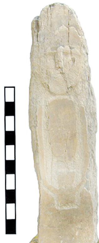
Редкий экземпляр каменной бабы, обнаруженный Ю.Н. Зоровым близ Ростова-на-Дону.

Вскоре разбойник был пойман и сослан в Сибирь. Ему, однако, удалось бежать на Кавказ; там он и умер. Своему брату (казaku) он переслал план с писаной инструкцией, с помощью которого можно было найти зарытое золото. Брат