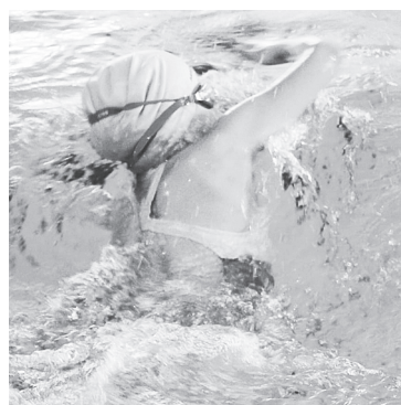
В Аксайском районе развиваются плавание, гимнастика и другие виды спорта.