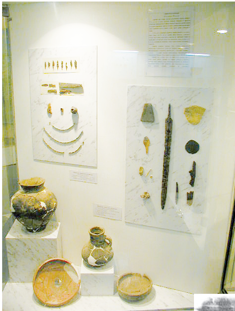
Предметы сарматской эпохи (фрагмент экспозиции Ю.Н. Зорова).

Этот дед утверждал, что под ярусом ходов, которые есть на Таможне, находится еще один, причем он-то и есть основной. Якобы они в детстве проникли в нижний ярус, долго шли по ходам, местами сверху вода капала – наверное, под Мухинским прудом, страшно было,