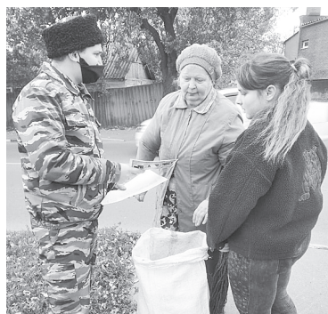
Люди, будьте бдительны.

В Аксайском районе казачья дружина в выходные и праздничные дни с 1 по 7 ноября оказывала содействие сотрудникам полиции и администраций сельских поселений Аксайского района в оперативно-профилактическом мероприятии «Стоп, мошенник!».