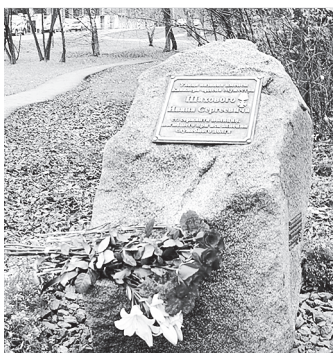
Памятный камень в честь названия улицы Ивана Шаховой.

Вечная память защитникам правопорядка, павшим при исполнении служебного долга!