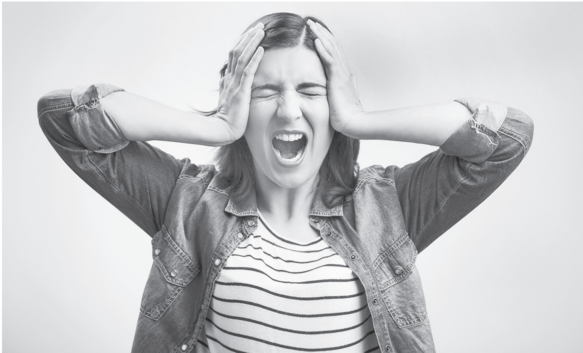
Ничто не проходит даром – расплачиваться за все приходится нервной системе.

А много ли мы делаем для предупреждения с детских лет расстройства нервной системы, которая впоследствии занимает действительно большое место в воз-