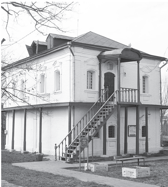
Дом К. Булавина в станице Старочеркасской (современный вид).

Дом Булавина расположен на экскурсионном маршруте и является памятником жилой архитектуры XVIII века. Здание представляет интерес как наиболее выразительный представитель традиционного донского зодчества. Возможно, что в XIX веке дом принадлежал Авдотье Жученковой. Об этом упоминает Григорий Левицкий в книге «Старочеркасск и его достопримечательности»: «Дурновская станица начинается от Петропавловской площади и оканчивается Скородумовской протокой. В этой станице издревле жили и ныне живут торговцы старообрядческой секты. Замечательны древностию и архитек-