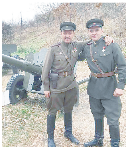
Актеры В. Котлярский и И. Петренко.