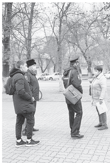
Отметим, что на территории Аксайского района работают 17 мобильных групп по мониторингу соблюдения масочного режима.

Казаками Аксайского юрта проводятся комплексные мероприятия по соблюдению карантинных мер, разъяснительные беседы с гражданами о необходимости соблюдения санитарно-эпидемиологических требований.