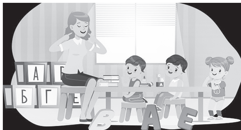
Будем говорить правильно.

Центр психолого-педагогической, медицинской и социальной помощи Аксайского района