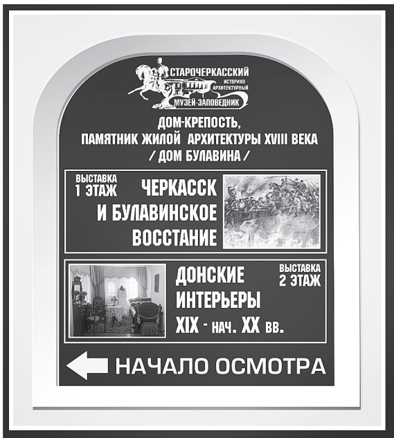
Афиша экспозиций в доме Кондратия Булавина.