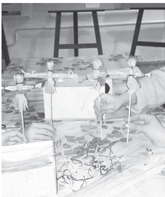
Посетители создают свою уникальную куклу-оберег.