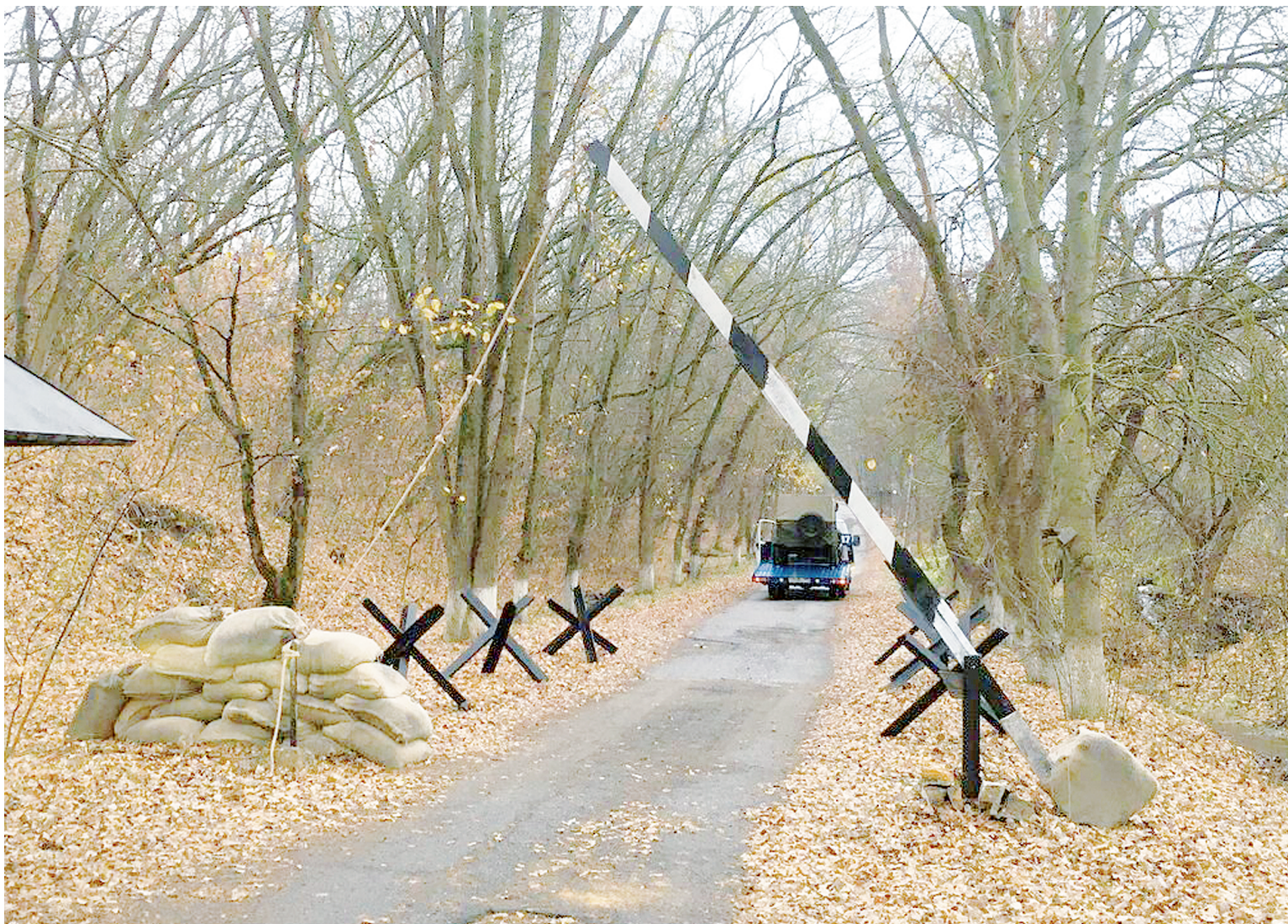
Шлагбаум Аксайского музея имитировали под КПП 40-х годов.

О СЪЕМКАХ СЕРИАЛА НА ТЕРРИТОРИИ АКСАЙСКОГО ВОЕННО-ИСТОРИЧЕСКОГО КОМПЛЕКСА