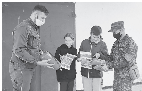
Соблюдайте меры пожарной безопасности!