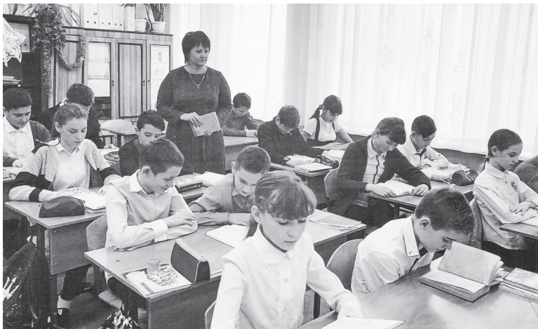
Тихо! Идет урок.