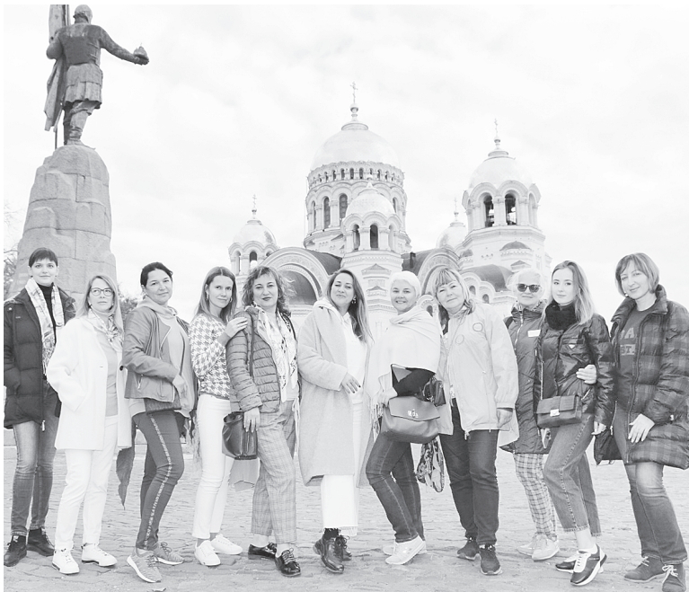
Участники инфотура в Новочеркасске.

Помимо достопримечательностей Ростовской области, участники инфотура также оценивали отельную базу в городах маршрута, сервис и качество оказываемых в отелях услуг. Эксперты турбизнеса будут рекомендовать посещение Ростовской области своим клиентам.