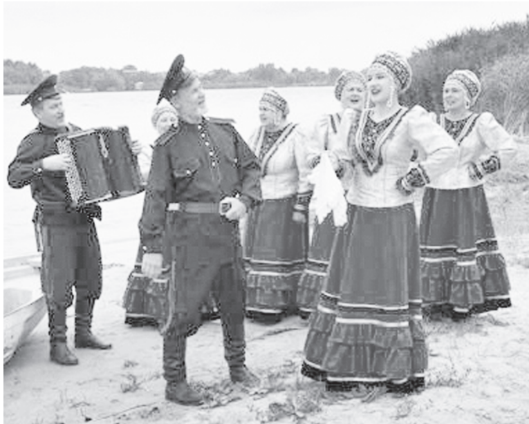
Творческий коллектив «Станичники» на берегу Дона в станице Старочеркасской.