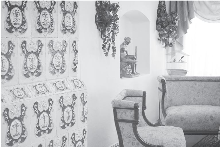
Изразцовая печь в интерьере дома К. Булавина.