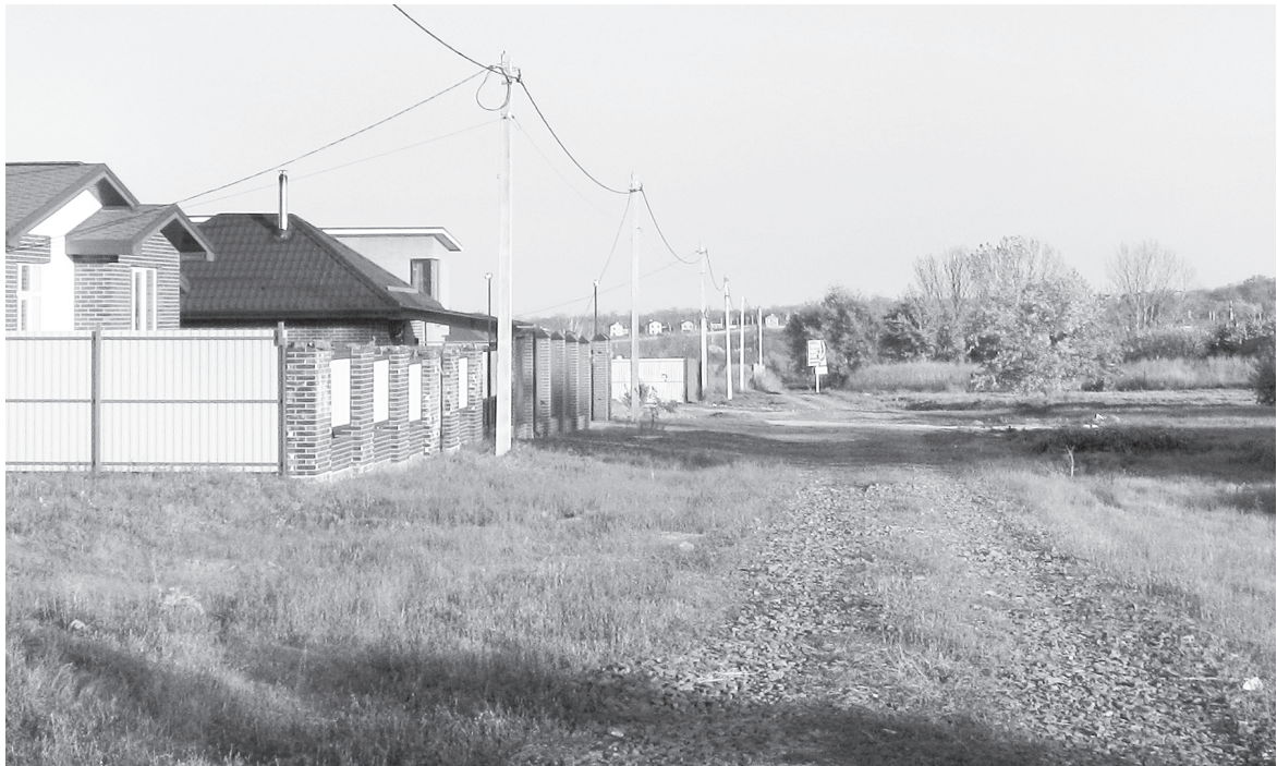
Улица Владимира Гладченко.