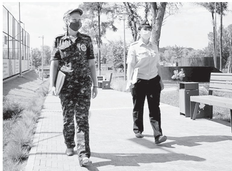
Участковые могут работать днем и ночью, почти без выходных.