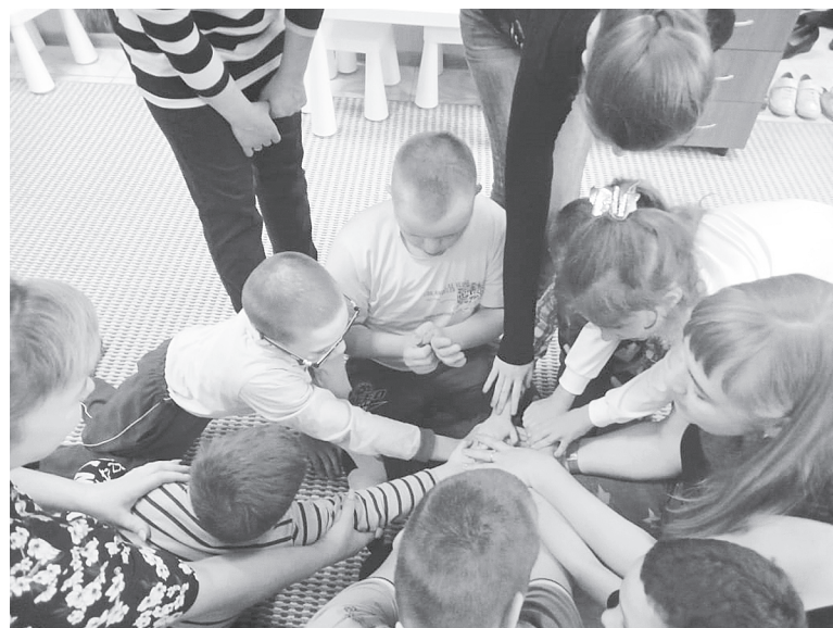
Занятие с детьми-инвалидами в рамках проекта президентского гранта.

Кроме того, специалисты Центра взяли на себя функции профессионального и методического сопровождения психологических и коррекционно-развивающих служб образования района, координируя и направляя их работу. В 2005 году впервые министерством образования Ростовской области была проведена экспертиза деятельности Центра диагностики и консультирования. Деятельность была признана соответствующей его виду и одобрена. Центр получил лицензию на право ведения образовательной деятельности. В тот же период Центром были заключены договоры о взаимодействии с образовательными учреждениями района, Центральной районной больницей, специальной психоневроло-