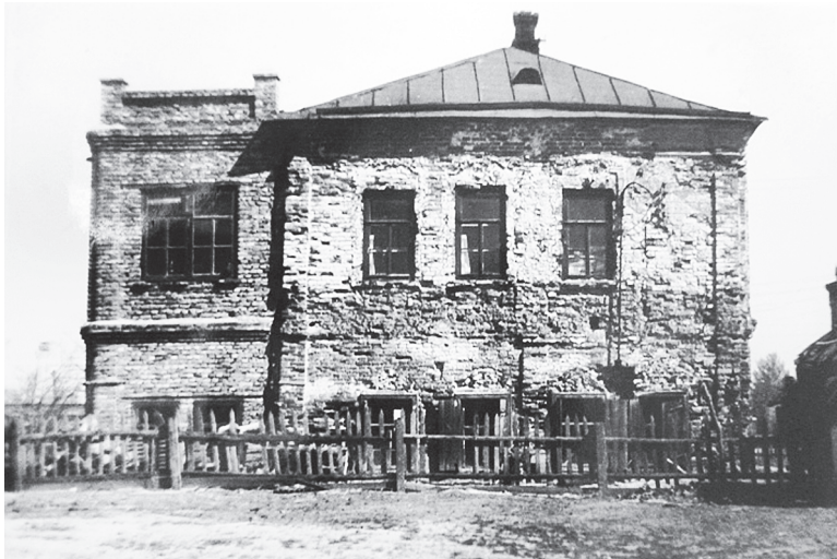
Дом Булавина до реставрации. 1980-е годы.