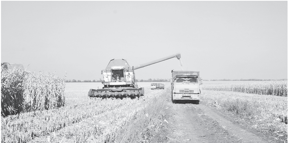
Уборка поздних культур.

Районы и хозяйства нашей Приазовской зоны внесли в землю семена озимых культур на площади 444,4 тысячи гектаров при плане 450,9 тысячи. Казалось бы, бла-