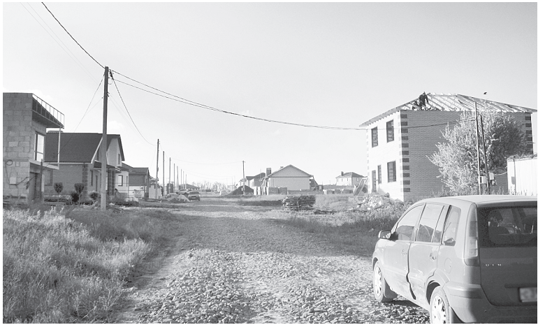
Улица Юрия Жульева.

Увидел группу рабочих на следующей улице, подошел, спросил. Мне ответили: «Улица Юрия Жульева», значит, карты не врут. А вскоре и табличку сфотографировал. В этой части микрорайона дома строятся по индивидуальным проектам, что выглядит симпатичнее. Вернулся на улицу Владимира Гладченко, потому что заметил на втором этаже двух рабочих, они подтвердили адрес. Можно и возвращаться. Не понял, почему улицы Иваненкова и Прохорова