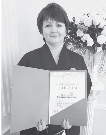
Е.Л. Гребенникова. / ФОТО автора

Немаловажное место занимают и мероприятия, организованные для станичников. Мишкинцы до сих пор помнят концерт, подго-