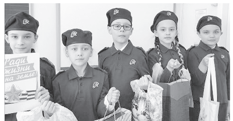
Члены отряда «Соколы».

– Юнармеец соблюдает правила дорожного движения. Мы рас-