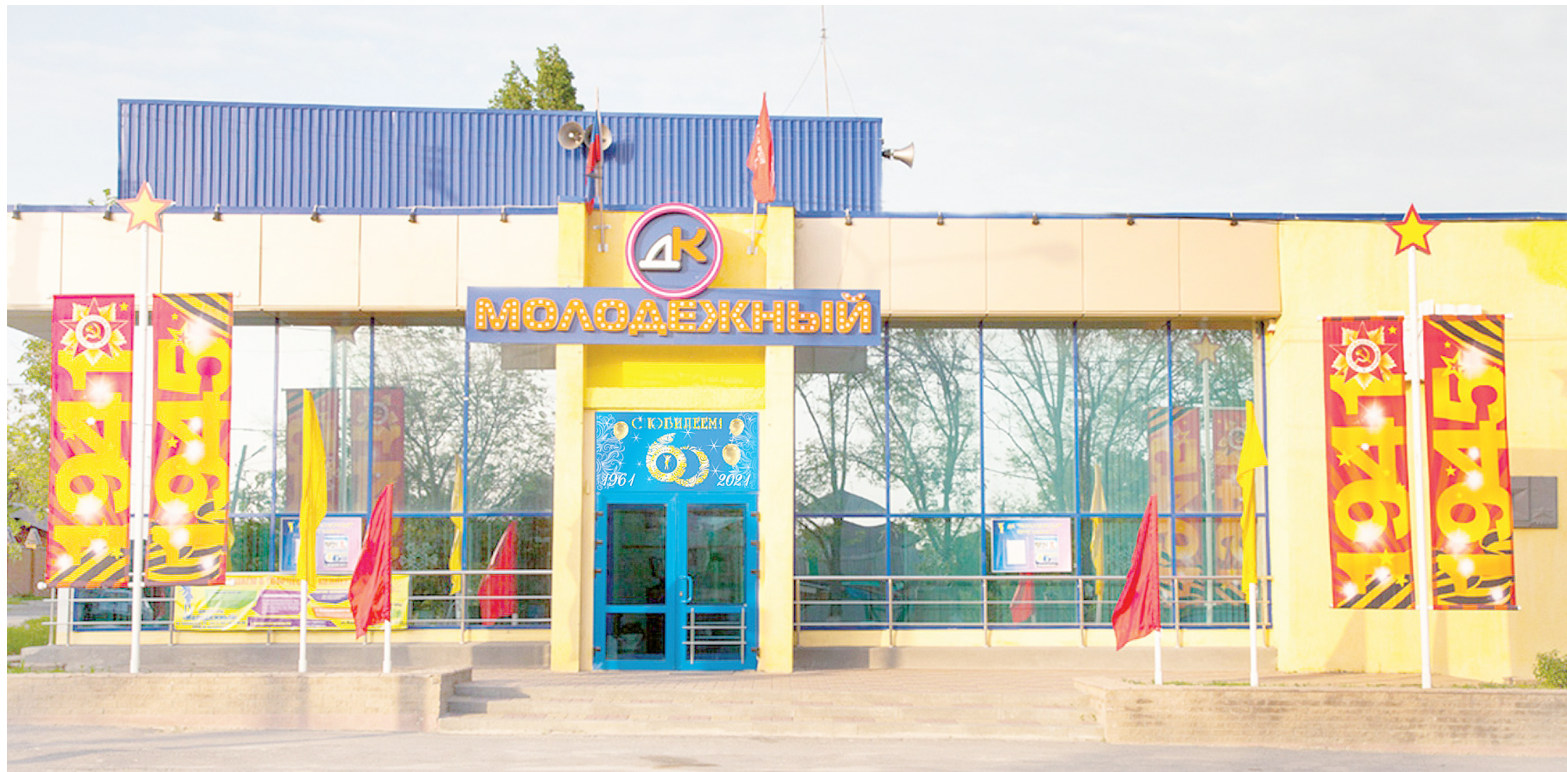
Дом культуры «Молодежный» за 60 лет своей истории открыл много направлений деятельности для самореализации детей и взрослых.

К сожалению, в суровые годы перестройки многое было утра-