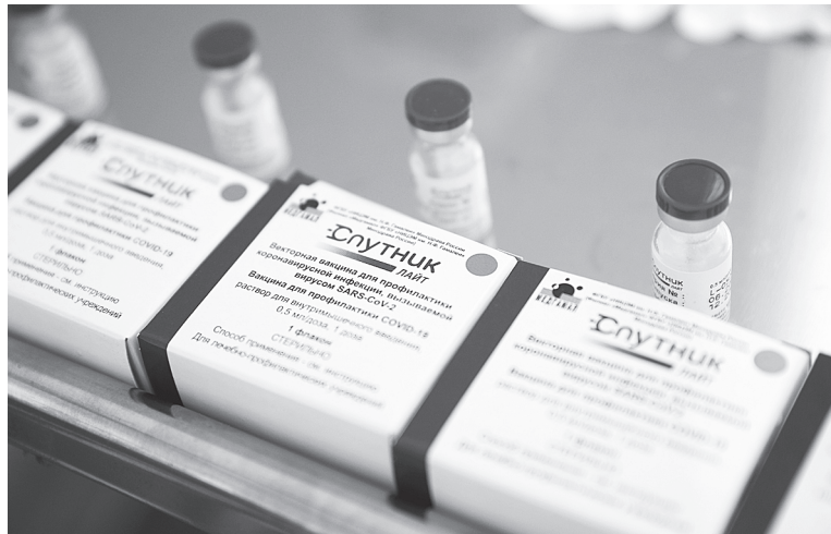
«Спутник Лайт» содержит первый компонент вакцины «Спутник V».

Минздрав России подчеркивает, что вакцина «Спутник Лайт»