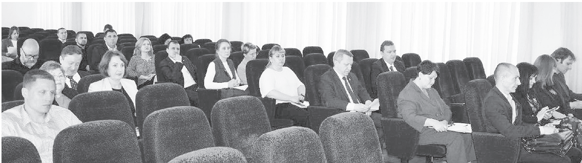
На заседании Собрания депутатов Аксайского района.

Также депутаты обсуждали вопрос проведения ремонта и возобновления работы паромной переправы в станице Старочеркасской. По итогам обсуждения принято решение выделить из бюджета 20 млн рублей на проведение ремонтных работ паромной переправы.