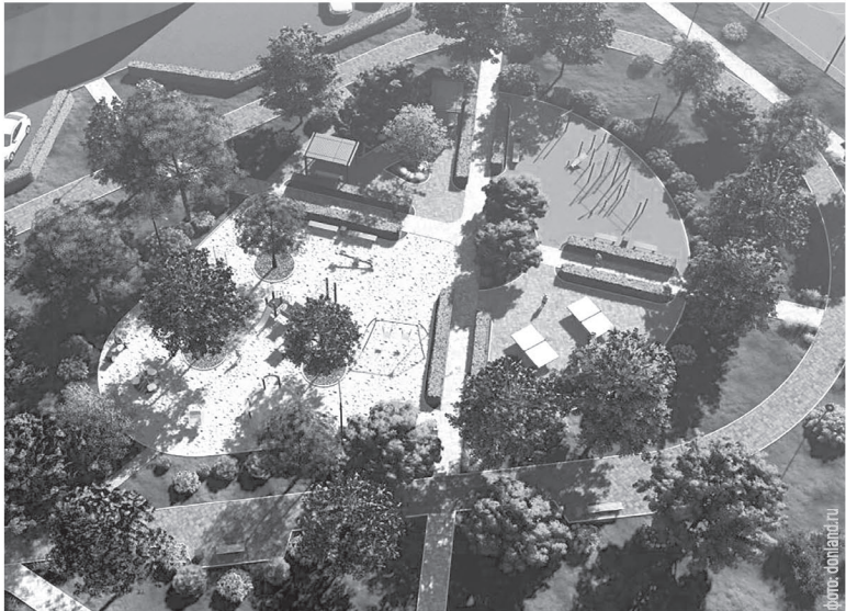
Сквер в Таганроге приведут в порядок к концу года

Глава региона Юрий Слюсарь подчеркивает: вопрос с обеспечением городов и районов области необходимым количеством мусорных контейнеров следует решить оперативно. Всего региону требуется около 16 тысяч новых контейнеров.