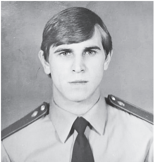
В.В. Чамата.

Чернобыльскую АЭС начали строить в 1970 году. Тогда же стали возводить город Припять, в котором поселились работники, обслуживающие атомную станцию. Через семь лет после начала возведения к энергосистеме СССР был подключен первый энергоблок.