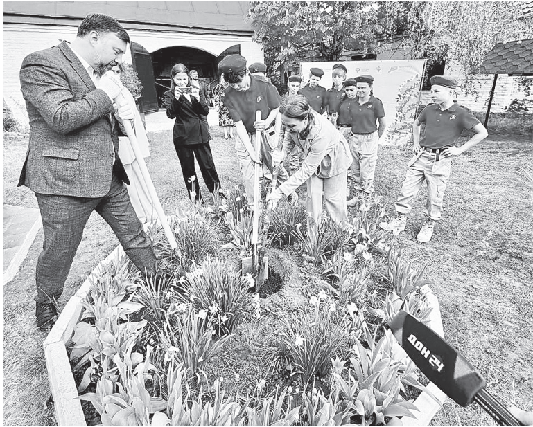
Посадка саженца.

Особое внимание уделяется сохранению исторической правды. На каждом посаженном дереве размещается памятная табличка с именем героя и краткой информацией о его