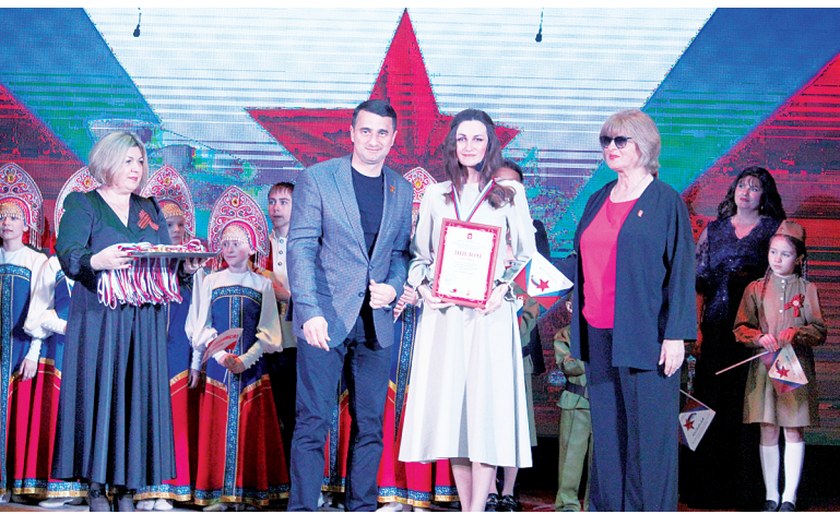
Фестиваль прошел в трогательной атмосфере.

прочитал ему стихотворения. Растрогали нашего здоровяка, был рад, поддержал инициативу!