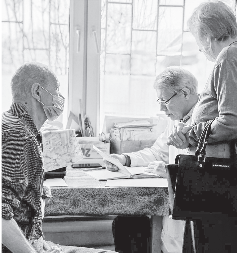
Прием ведет хирург К.В. Зуев.

Юрий Борисович отметил, что лишь этих мер недостаточно: пред-