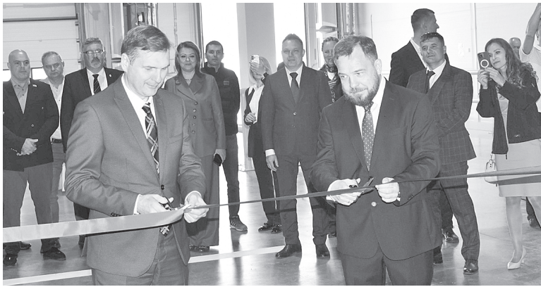
Открытие Центра.

Проект реализован специально для крупной логистической компании ООО «Рулог». Мощности распределительного центра будут использоваться, прежде всего, для поставки товаров в рестораны