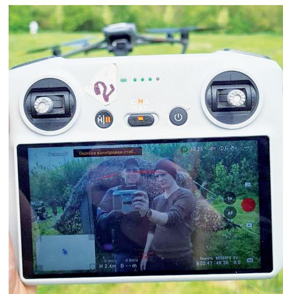
Военно-патриотическая игра «Зарница 2.0» прошла на ура.

«Зарница 2.0» не только военно-патриотическая игра, но и способ привлечь молодежь к здоровому образу жизни и военно-прикладным видам спорта. Она помогает развивать командный дух, укреплять дружбу и воспитывать чувство патриотизма, отметили исполнительный секретарь Аксайского местного отделения партии «ЕДИНАЯ РОССИЯ» А.Ю. Подкопаева.