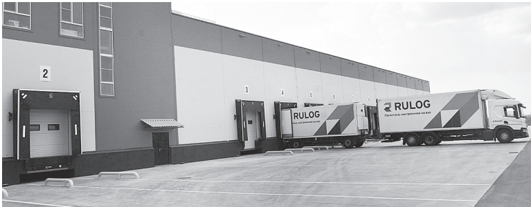
Мультитемпературный распределительный центр.

Построенный центр входит в перечень «100 губернаторских инвестиционных проектов». Инициатором реализации проекта является ООО «РЦ РОСТОВ». Площадь