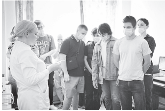
На экскурсии в ЦРБ г. Аксая.

Проект «Дорога в профессию» помогает школьникам выбрать медицинскую карьеру.