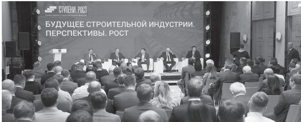
Разговор со строителями у главы региона вышел откровенный и обстоятельный