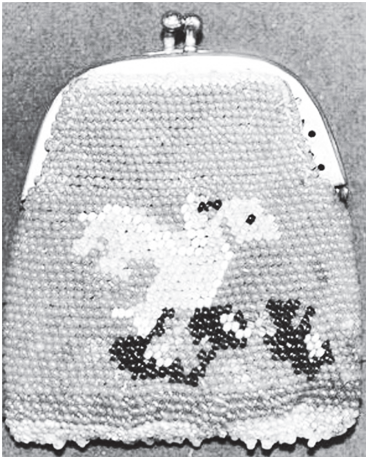
Кошелек бисерный. Россия конец XIX в.

изготовлению бисера. Всемирную известность венецианские мастера получили, когда открыли секрет изготовления прозрачного и цветного бисера. На крупном острове Венецианской лагуны – Мурано изготавливали бисер. Именно он надолго станет центром производства бисера. Секрет изготовления бисера очень тщательно оберегался и передавался от учителя к ученику. За разглашения тайны, виновного ожидала смертная казнь. Долгое время венецианские мастера были единственными производителями цветного и прозрачного бисера, который экспортировался в разные страны Европы и Азии. Венецианским бисером были украшены сумочки, чехольчики, шкатулки, подушечки, одежда и иногда посуду оплетали бисером. В XVIII веке конкуренцию Венеции составила Богемия (Северная Чехия), у них была своя технология изготовления стекла.