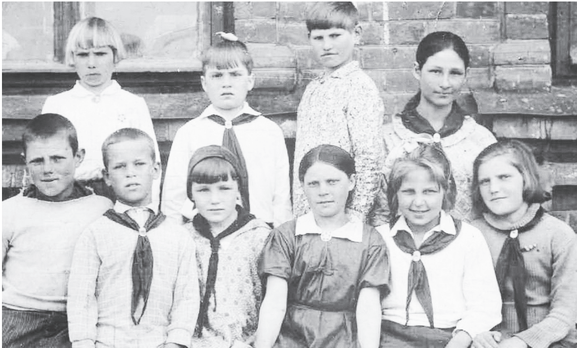
1936 год. Дусе 12 лет (сидит крайняя справа).

Солдаты шли в бой с думой о тех, кто ждал их дома, кто верил и ждал, как можно верить и ждать только на войне. Эта вера помогла выстоять под Москвой, победить под Сталинградом, дойти до Берлина. Но не всем дано было вернуться домой.