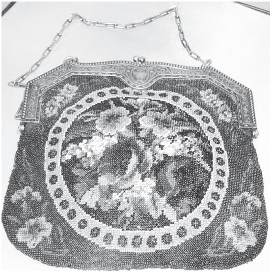
Сумочка дамская, шитая бисером. Германия 1914 г.

Древние египтяне, известные своим искусством и мастерством, широко использовали бисер для создания украшений. Украшения носили как знатные лица, так и простые люди. Бисер из разноцветного стекла украшал одежду, головные уборы и гробницы. Его находили в погребениях фараонов и в повседневных предметах. Из Египта бисер попал в Рим. Римляне у египтян научились искусству изготовления бисера и созданию сложных украшений. В VI веке искусство бисероплетения достигло своего расцвета в Византии. Оттуда оно перешло в Венецию, которая стала надолго лидером по