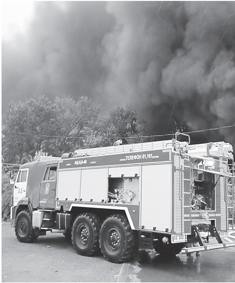
Срочный выезд.

Все населенные пункты оснащены первичными средствами пожаротушения, обеспечивающими тушение пожаров до прибытия подразделений Государственной противопожарной службы. Созданы резервы горюче-смазочных материалов и иных материальных ре-