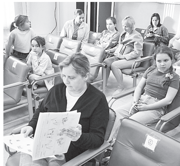
Общение с жителями поселка.

Последние несколько лет поселок Российский Аксайского района активно застраивается, развивается и заселяется новыми жителями.