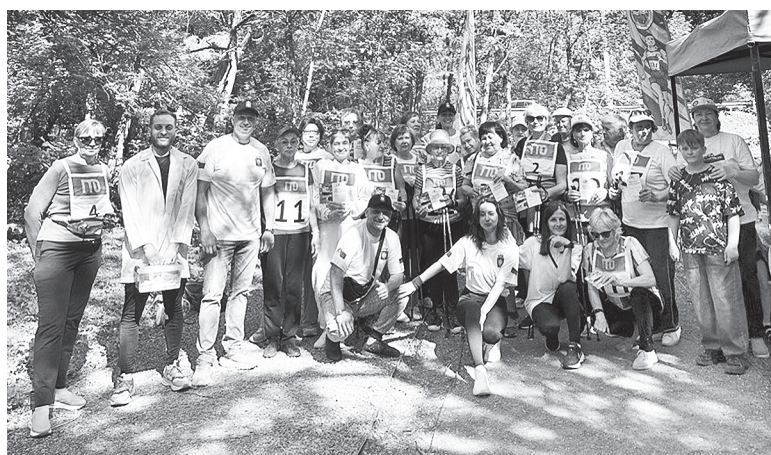
Участники «Тропы здоровья».

Организаторы тщательно подошли к подготовке мероприятия.