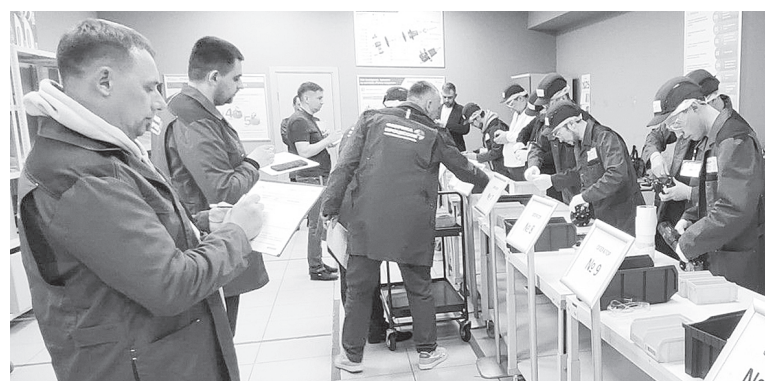
На тренинге «Фабрики процессов».

Так, «Фабрика производственных процессов» и «Фабрика офисных процессов» позволят как на производстве, так и в офисе ускорить выполнение рутинных процедур и сократить себестоимость процесса, обнаружить потери и устранить их, а также увеличить продуктивность сотрудников.