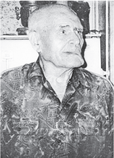
В.Ф. Черный.

И правда, научили быстро. Пришли к ним мастера по токарному делу, показали, что и как нужно делать, и к концу дня ученики первую деталь сделали сами. Работа очень понравилась новым мастерам. Стружка так и вьется от резца в виде пружины. Научились одну деталь делать и делали ее, недели две,