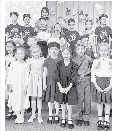
Юнармейский отряд «Единство».

Юнармейскому отряду «Единство» лицея № 1 г. Аксая присвоено имя Героя специальной военной операции Евгения Витальевича Зозуля.