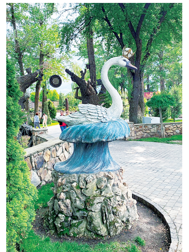
Сказочная атмосфера парка «Лога».

территорию. В будущем планируется строительство этнической деревни, музея казачества под открытым небом, аквапарк и гостиницы.