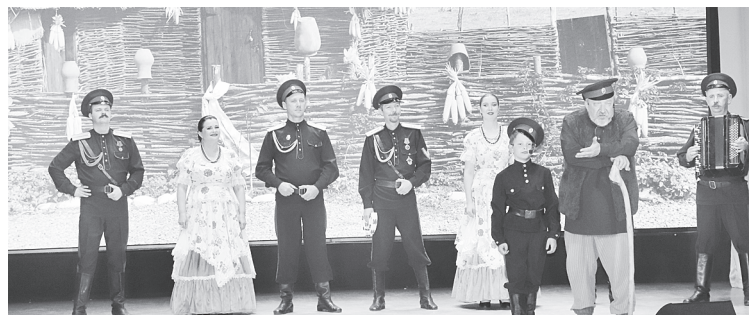
Участники фольклорного фестиваля.