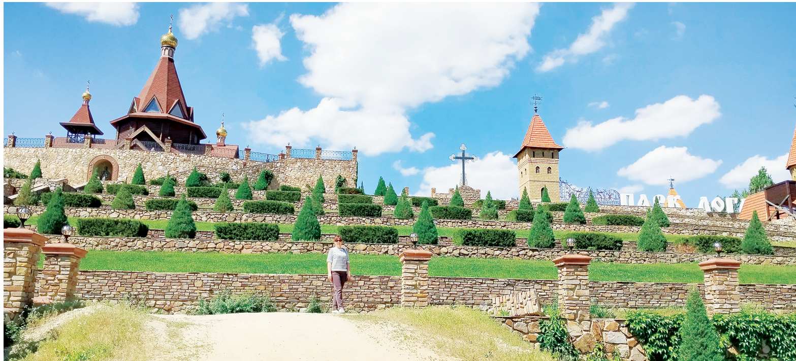
Величественный парк «Лога».