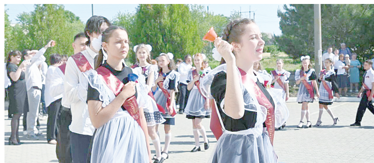
Последний звонок 2025 года.

– Замечательно, что у нас в районе столько активных и талантливых ребят! Уверен, что в будущем наши выпускники добьются