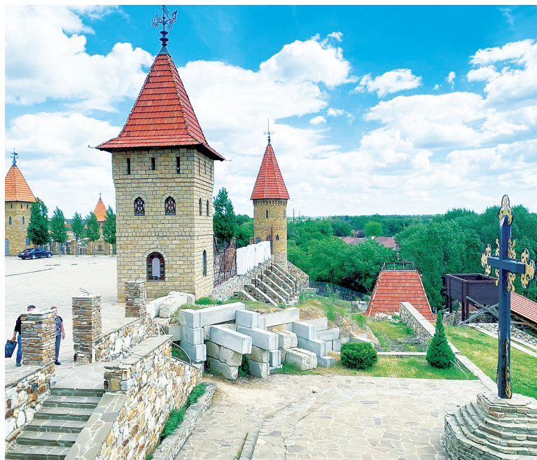
Здесь каждый откроет для себя что-то особенное.