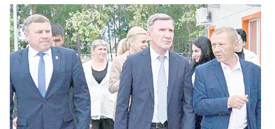
Выездное совещание.

Значимые изменения в сфере строительства образовательных учреждений Аксайского района обсудили на выездном совещании под руководством первого заместителя Губернатора региона И.А. Гуськова. В мероприятии приняли участие глава Администрации Аксайского района К.С. Доморовский, представители министерств образования и строительства, а также специалисты авторского надзора.