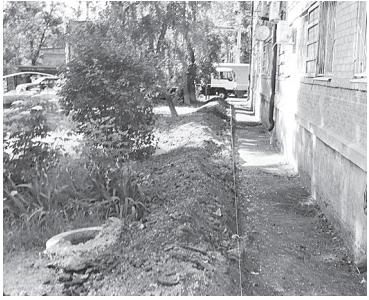
Подготовка к проведению работ.

Перед началом работ администрацией Аксайского городского поселения был разработан спецпроект. После успешной экспертизы проект получил положительное заключение от ГАУ РО «Государственная экспертиза проектной документации и результатов инженерных изысканий».