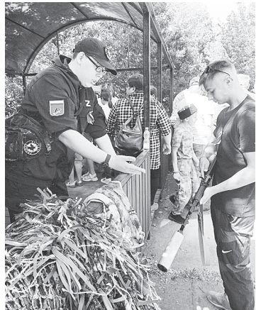
На интерактивной выставке «Защитники Отечества».