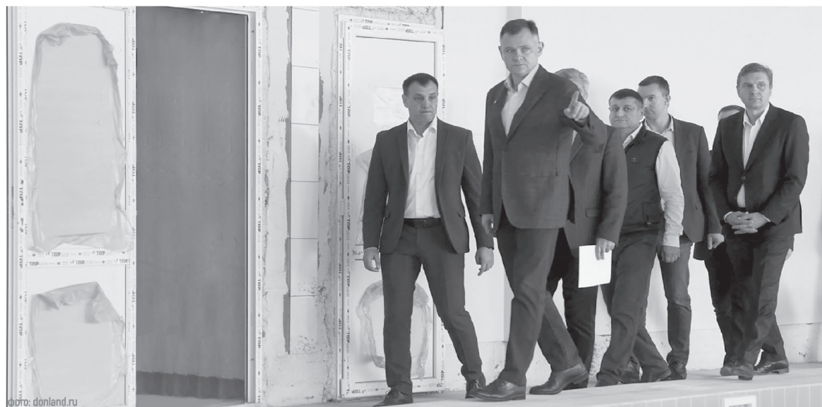
Глава региона побывал на стройплощадках важных соцобъектов и пообщался с жителями Донецка и Гукова

Кроме того, на проведение ямочного ремонта дополнительно из областного бюджета выделят 20 млн рублей. Через Гуково идет большой транзитный поток, муниципальный дорожный фонд – более 62 млн рублей – не может закрыть всю потребность в ремонте, а благодаря дополнительным средствам в этом году в городе приведут в порядок вдвое больше объектов – почти 4 км