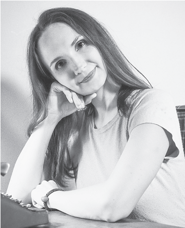
К.Н. Демина. / ФОТО из архива ЦСОГПВиИ

В Центре социального обслуживания граждан пожилого возраста и инвалидов – стабильный, работоспособный коллектив, более шестидесяти процентов которого трудятся в службе более двадцати лет. Наш «Золотой фонд», маяки-