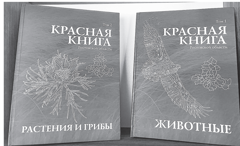
Та самая Красная книга.

Это радостная весть. В пойме рек Грушевка и Тузлов паводки – не редкость. Станица Грушевская становится в буквальном смысле плавучей. Последний, или, как