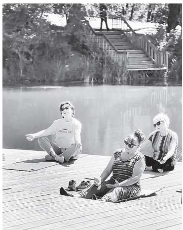
Важно сохранять активность!