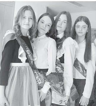
Выпуск 2025 года.