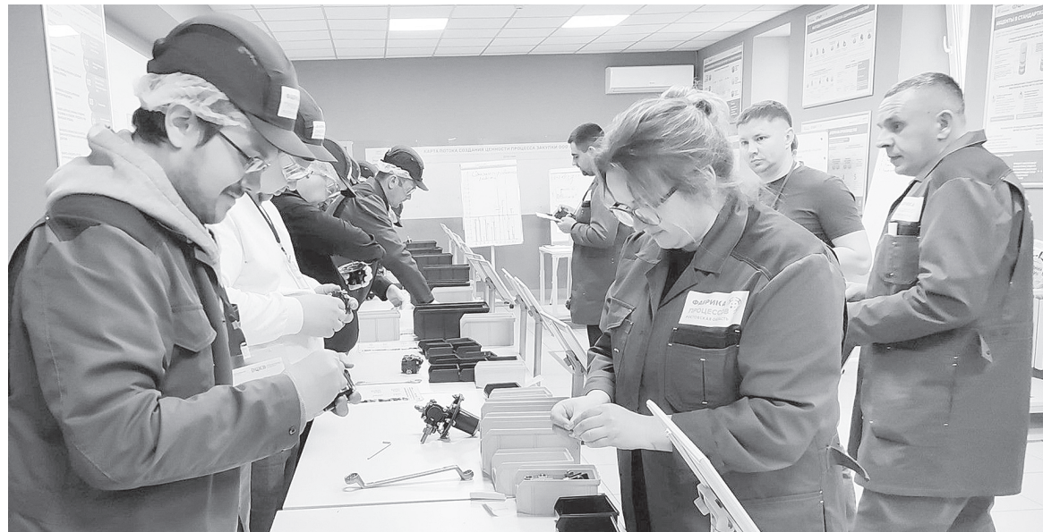
«Бережливое производство».

– В тренингах уже приняли участие более 2 200 сотрудников компаний, муниципальных и государственных органов власти, организаций и учреждений Ростовской области. Это отличная возможность для донских организаций обучить персонал способам внедрения инструментов бережливого производства и развитию производственной системы на новых участках, – расска-