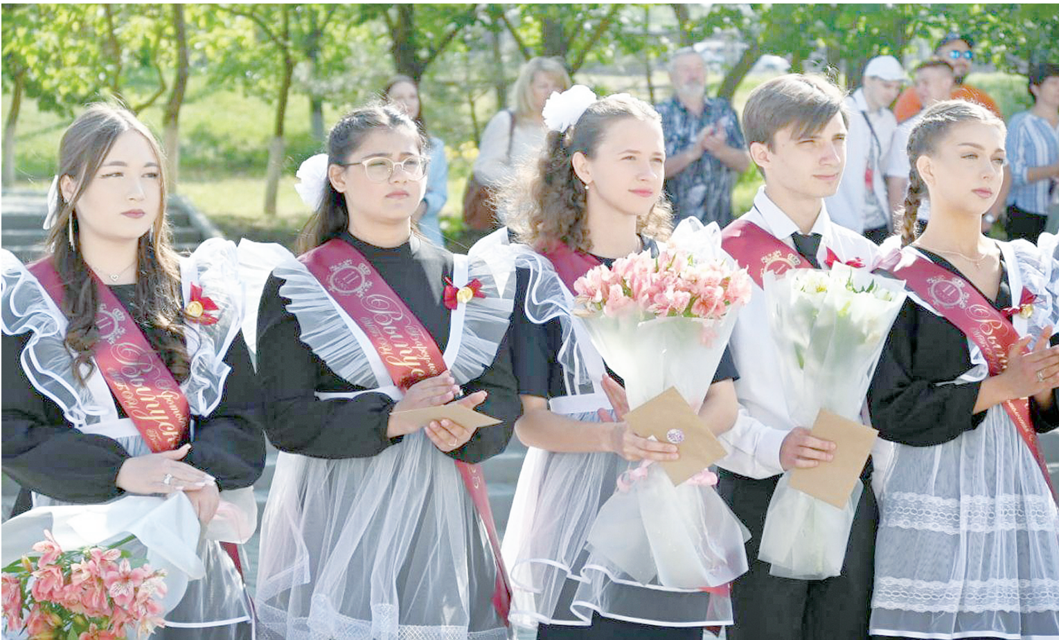
Выпускники 2025 года.

24 МАЯ ДЛЯ ШКОЛЬНИКОВ АКСАЙСКОГО РАЙОНА ПРОЗВЕНЕЛ ПОСЛЕДНИЙ ЗВОНОК