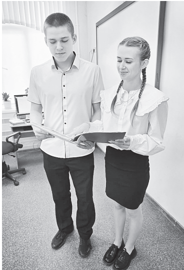
Д. Меликьян, А. Шаповалова.