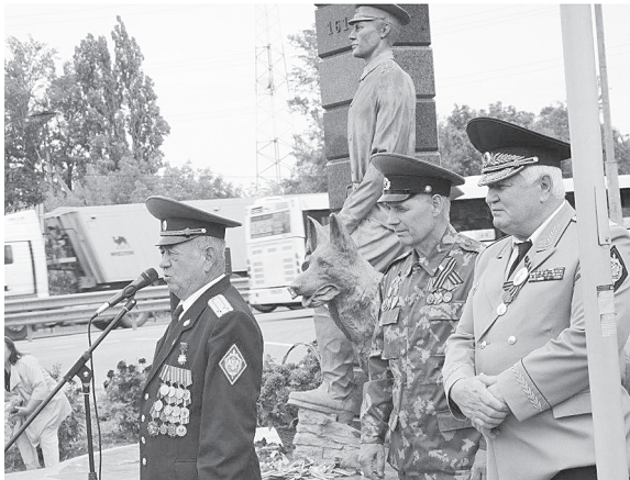
Митинг в честь Дня пограничников.