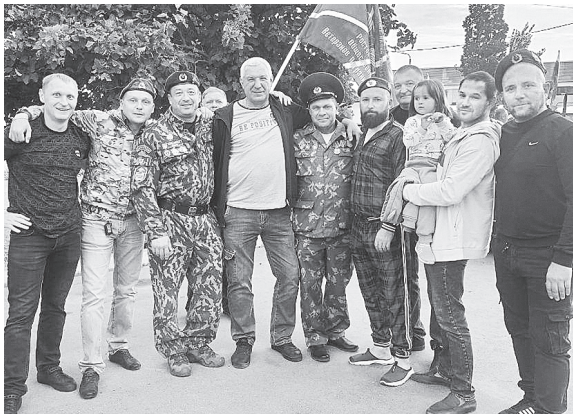
Уже более пяти лет десантники Аксайского района поздравляют пограничников.