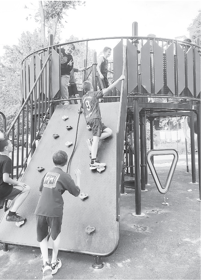
Перед поездкой в лагерь ребенку необходимо объяснить, что ему предстоит жить с другими детьми, и напомнить о правилах совместного проживания.

Одежда. Футболка – 7-8 штук. Отдельно белая футболка для прощальных пожеланий. Иногда дети в конце смены расписываются на ней специальными фломастерами или красками. Спортивный костюм –