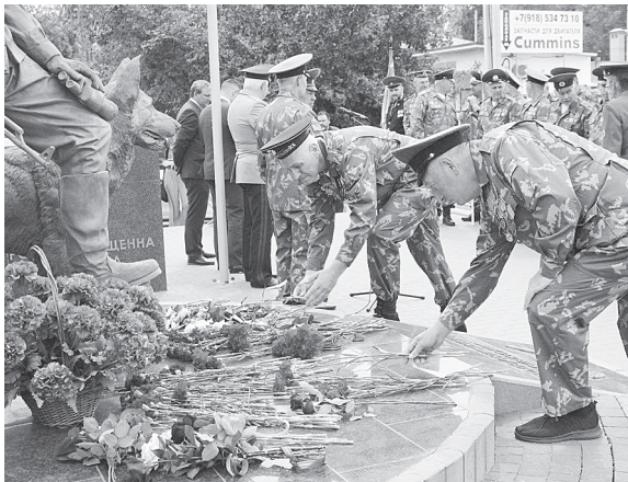
Возложение цветов.

Строевым маршем прошла колонна ветеранов-пограничников