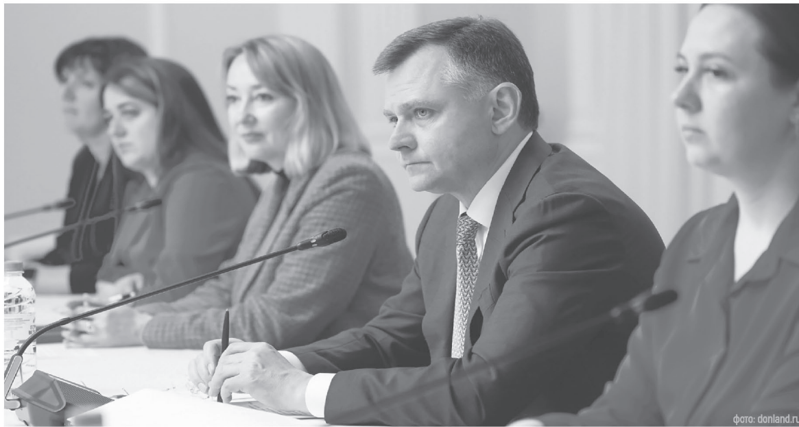
Территориальное общественное самоуправления (ТОС) – источник полезных общественных инициатив

Напомним, что обсуждение проектов реконструкции и благоустройства детских площадок проходит по всей области. Люди принимают активное участие, вносят свои предложения в варианты, представленные администрация-