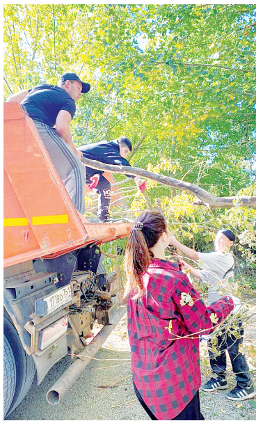
Во время субботников убирают и большие сухие деревья.