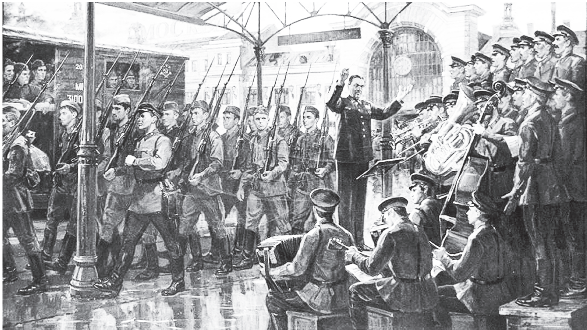
Первое исполнение.

И пусть проходят десятилетия, но «Священная война» остается той самой песней, которая объединяет поколения, напоминая о важности мира, о ценности каждой человеческой жизни и о том, что нужно делать все возможное, чтобы война никогда не повторилась.