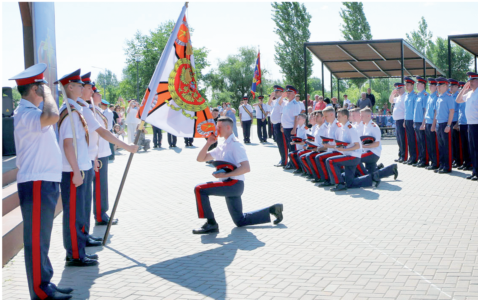
Церемония прощания со Знаменем кадетского корпуса.

В АКСАЙСКОМ КАЗАЧЬЕМ КАДЕТСКОМ КОРПУСЕ СОСТОЯЛСЯ ТОРЖЕСТВЕННЫЙ ВЫПУСК 2025 ГОДА