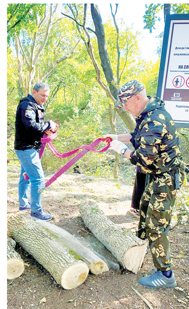
Во время субботника.

При этом мы стремимся создавать максимально праздничную атмосферу на наших мероприятиях. И у нас это очень хорошо получается. Видя как абсолютно неизвестные друг другу люди общаются, помогают друг другу, веселятся, мы в первый же наш субботник, поняли, что теперь нам необходимо сделать подобные акции доброй традицией всех аксайчан. Мне кажется, первый субботник вдохновил и замотивировал нас на многие годы вперед.