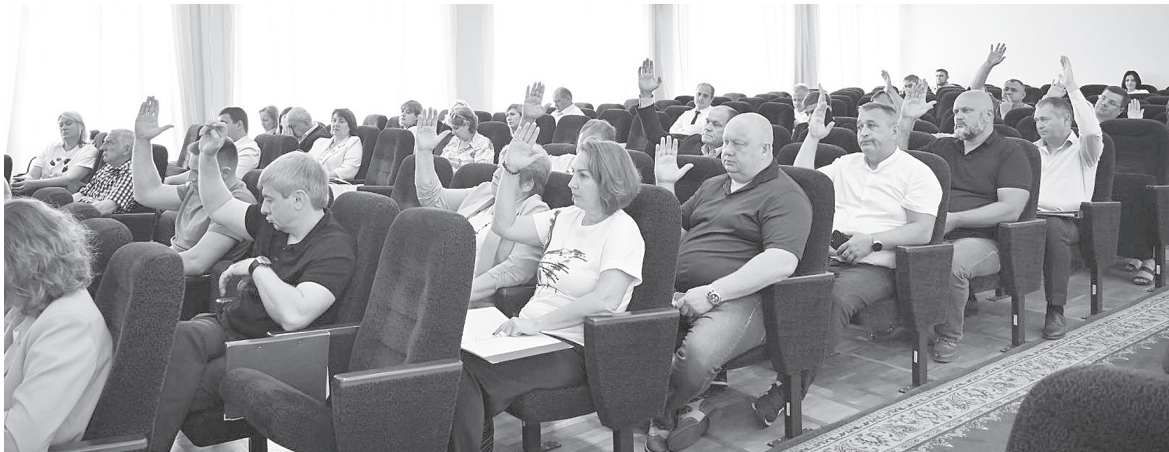
Идет голосование.

– Одна из важнейших составляющих благоустройства района – ремонт дорог местного значения. Отремонтированы и заасфальтированы дороги во многих поселениях нашего района. В том числе выполнены работы по строительству автодорог по ул. Пихтовая и ул. Береговая в п. Российский. Эти улицы имеют социальное значение, так как ведут к многоквартирным домам, в которых предоставлены жилые помещения детям-сиротам. Выполнены работы по ремонту ул. Фадеева и Новоселов, а также обустройство щебеночного покрытия по ул. Новая в х. Большой Лог.