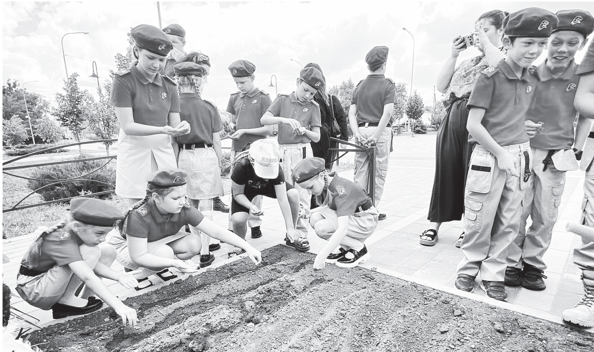
Отряд «Пчелы»: сажаем цветы у братской могилы.

МОЛОДЕЖНЫЕ ОРГАНИЗАЦИИ АКСАЙСКОГО РАЙОНА С ГОТОВНОСТЬЮ ОТКЛИКАЮТСЯ НА ПРОСЬБЫ О ПОМОЩИ