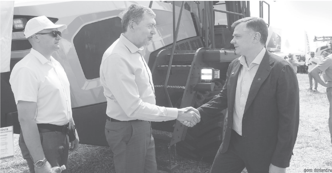
Сохранить урожай и поддержать аграриев – сейчас важнейшие задачи

На повестке – подготовка к жатве-2025. Уборочная кампания будет проходить в непростых условиях: повлияли весенние заморозки (тогда в регионе был введён режим ЧС), потом – почвенная засуха. В общей сложности пострадали более полмиллиона гектаров ранних зерновых. А это шестая часть этих культур. По данным метеорологов, особо опасные погодные условия зафиксировали в десяти районах Ростовской области, где с 10 июня ввели режим чрезвычайной ситуации по засухе, сообщил на совещании глава Донского края Юрий Слюсарь. Речь идёт об Азовском, Белокалитвинском, Верхнедонском, Веселовском, Зерноградском, Октябрьском, Семикара-