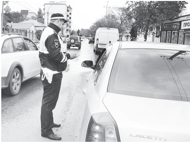
Сотрудники Госавтоинспекции на посту.

Хорошим подспорьем, которое помогает выявлять нарушителей скоростного режима, стали видеокamеры, установленные на дорогах Аксайского района. Приборы фотовидеофиксации дисциплинируют водителей, заставляя сбавлять скорость, тем самым, снижают риск возникновения дорожно-транспортного происшествия. Камеры установлены в наиболее опасных местах, где чаще всего происходят аварии.