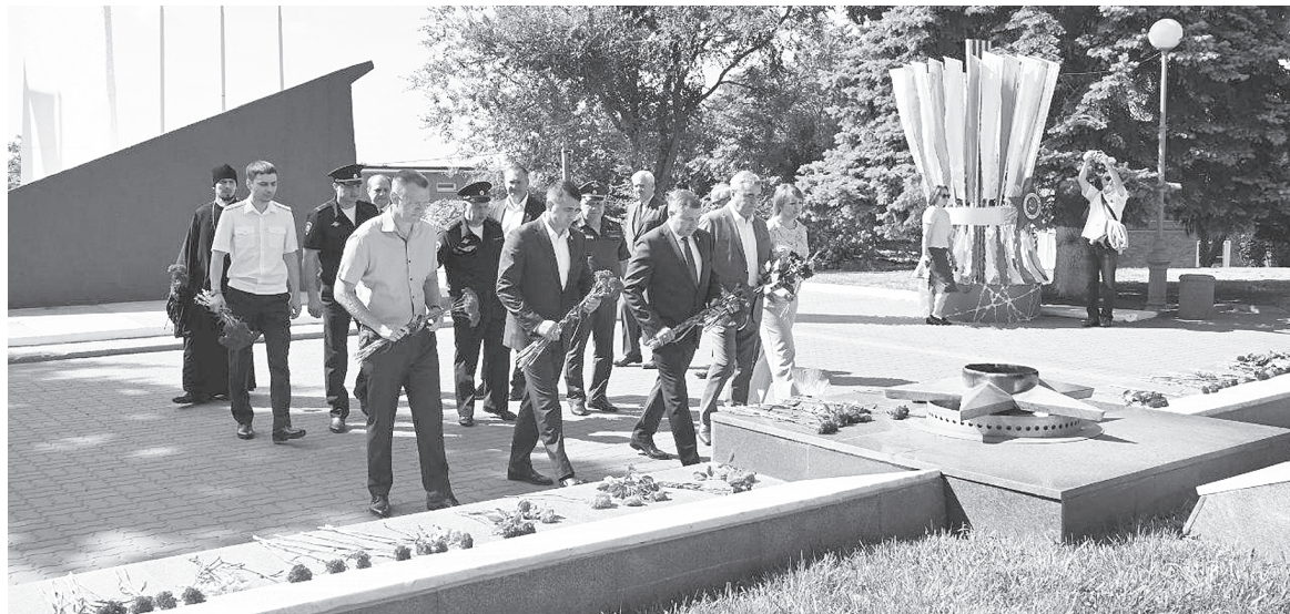
Возложение цветов у Вечного огня на площади Героев.

В этом году мы отмечаем 80-летие Великой Победы и