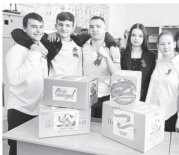
Акция «Посылка Победы».

государства на полях сражений сегодня. Ребята собрали «Посылки Победы» для бойцов. Школьники приносили сладости, чай, кофе, продукты быстрого приготовления и многое другое. К сбору гуманитарной помощи присоединились ребята из разных населенных пунктов