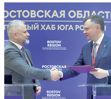
В. Путин и Ю.Б. Слюсарь.

Как сообщает пресс-служба Губернатора Ростовской области, ПАО «Корпоративный центр ИКС 5» до конца 2027 года вложит в развитие своей сети в Ростовской области два миллиарда рублей.