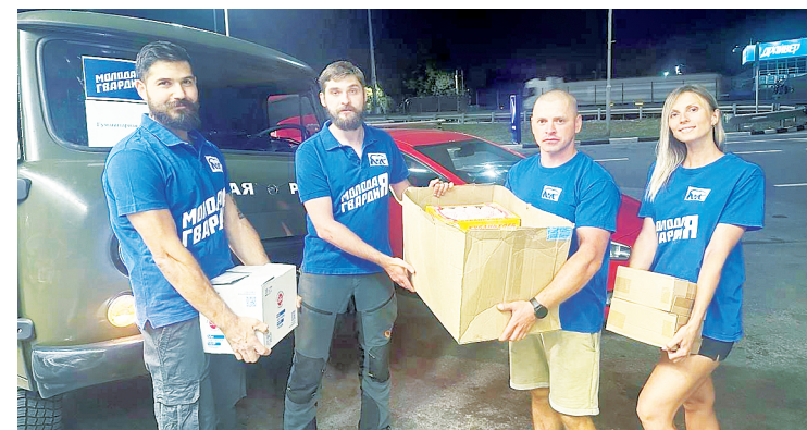
Добрые дела молодогвардейцев. / ФОТО из архива Д.А. Екимова