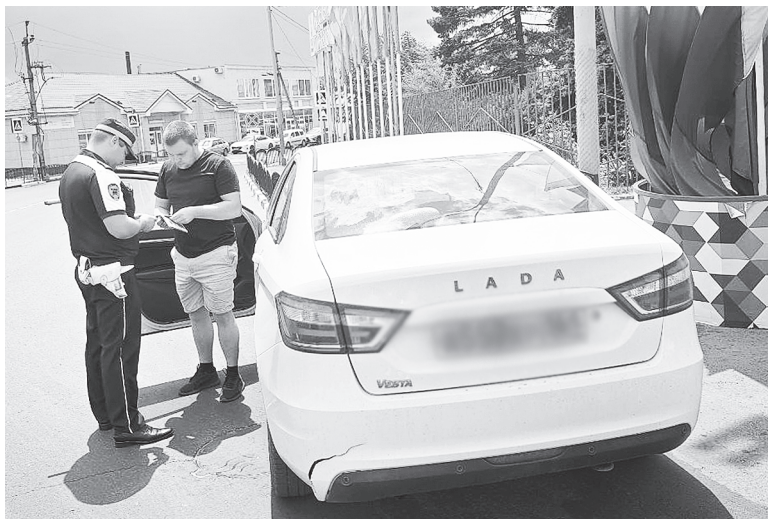
Проверка документов.

сотрудники задерживают браконьеров. В ведение службы также входит административная практика, технический надзор, пропаганда безопасности дорожного движения. Кроме того, осуществляется взаимодействие со службой судебных приставов, «Ространснадзором», Администрацией Аксайского района, администрациями сельских поселений, Управлением образования Администра-