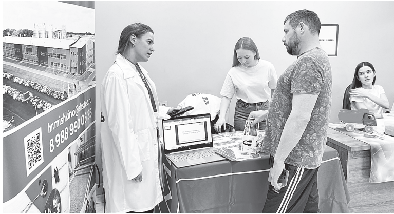
Всероссийская ярмарка трудоустройства.

■ Модернизация системы социальной защиты населения