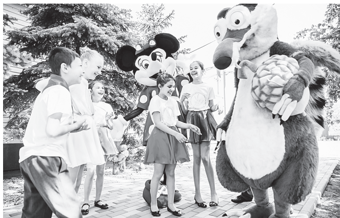
Праздник для детей Центра.