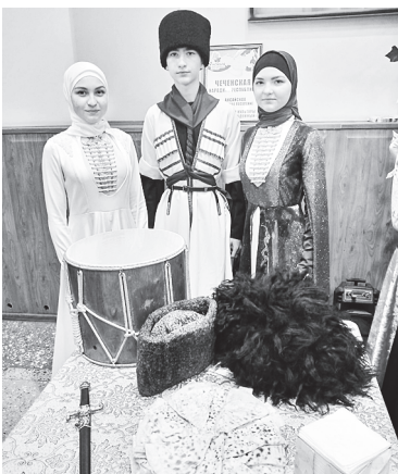
Фестиваль в РДК «Факел» «В единстве – наша сила».