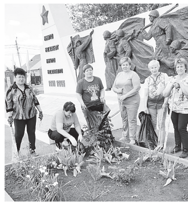
На субботнике.

эффективности производства и защиты социально – трудовых прав работников, Центр занял первое место. В целях социализации пожилых людей большую роль играют перспективные технологии социальной работы. Развиваются проекты «Таланты наших получателей социальных услуг», «Социальный работник на все руки мастер», «Планета талантов и обаяния наших детей и внуков». Реализуется региональная программа «Активное долголетие», выполняются мероприятия по поддержке граждан пожилого возраста и инвалидов в рамках федерального проек-