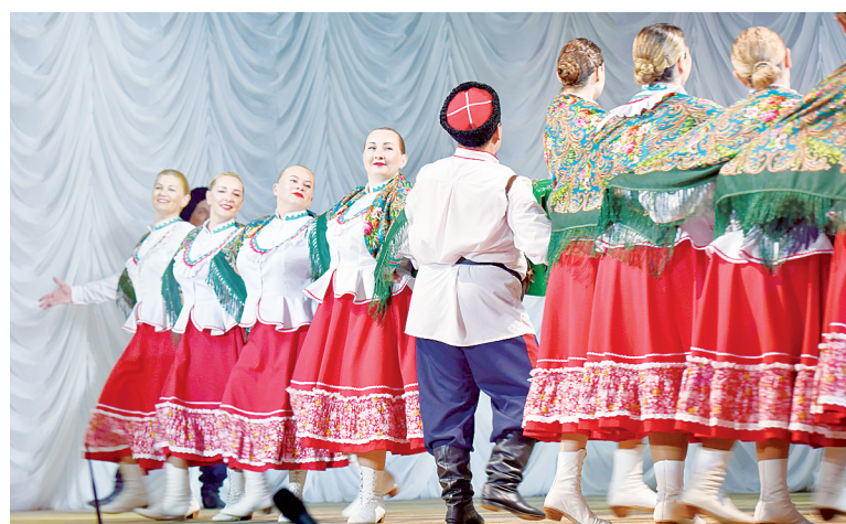
Яркие выступления на сольном концерте Театра танца «Река».

членами большой семьи. Разные профессии, разный жизненный опыт, но объединяла всех одна страсть – любовь к народному творчеству. Рассказы о том, как каждый находит время для репетиций, как преодолевает трудности ради танца, создавали особую атмосферу доверия и близости.