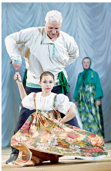
Народную культуру – в массы.