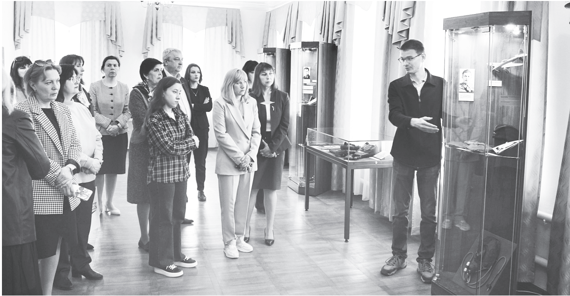
Открытие выставки «Лермонтов. Сталинградский дневник» в Старочеркасском историко-архитектурном музее-заповеднике.

Рано потерял родителей, воспитывался в семье родной тети – учительницы гимназии.