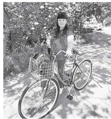
В помощь социальному работнику – велосипед.

С 2019 года функционирует Школа по уходу за маломобильными гражданами, в которой род-