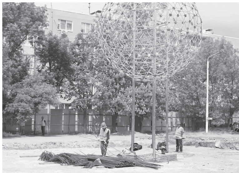
Сквер, любимый волгодонцами, приведут в порядок к концу осени

В Матвеево-Курганском районе начались работы по благоустройству центрального парка рай-