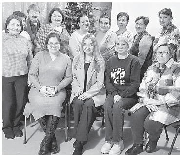
Коллектив Центра.

Каждое утро в х. Большой Лог начинается по-разному: кто-то идет на работу, кто-то – в школу, а кто-то – к своим подопечным. У этих людей нет громких званий, они не появляются на телевидении, но их знают в каждом доме, где живет пожилой человек. Это социальные работники. Те самые, кто каждый день приходит туда, где их ждут.