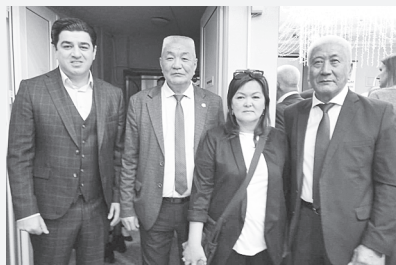
Представители национальных и этнических групп.

ют социальные проекты, направленные на помощь обществу,