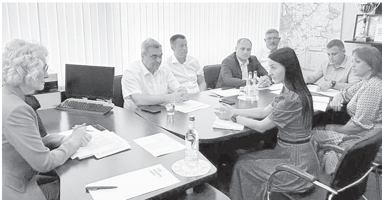
Идет прием граждан.

На встрече разговор шел об асфальтировании дорог на улице Кузнецкой в станице Ольгинской, улице производственной в поселке Российском, улице Ясная Поля-