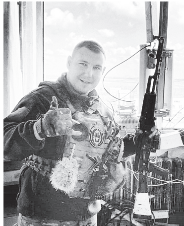
Служба идет.

Получить актуальную информацию из реестра налогоплательщиков о себе с помощью электронных сервисов можно в любое время.