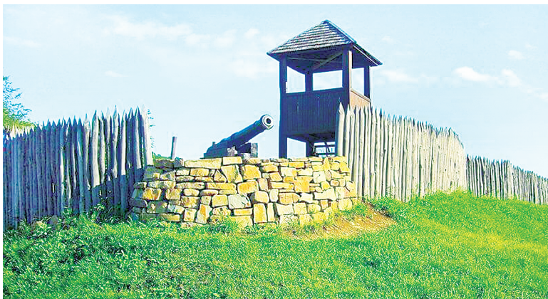
Михайловское укрепление.

Особую ценность представляет расположенный рядом краеведческий музей. Его экспозиция погружает посетителей в атмосферу Кавказской войны. Центральное место занимает детальный макет Михайловского укрепления, воссоздающий картину обороны 2 марта 1840 года. Среди экспонатов – старинные чертежи, военное снаряжение, макет древнего дольмена и римской сторожевой башни I века нашей эры. Богатая коллекция включает минералы, античные монеты и фрагменты амфор.