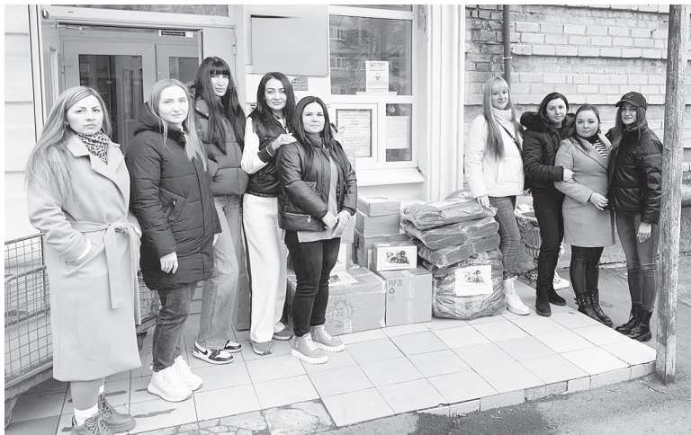
Передача гуманитарной помощи от организации «Семья героя. Аксай» в госпиталь.

Название «Папа, я тебя жду!» придумала сама. Когда думала, что хочу провести съемку с детьми, оно пришло в голову сразу.