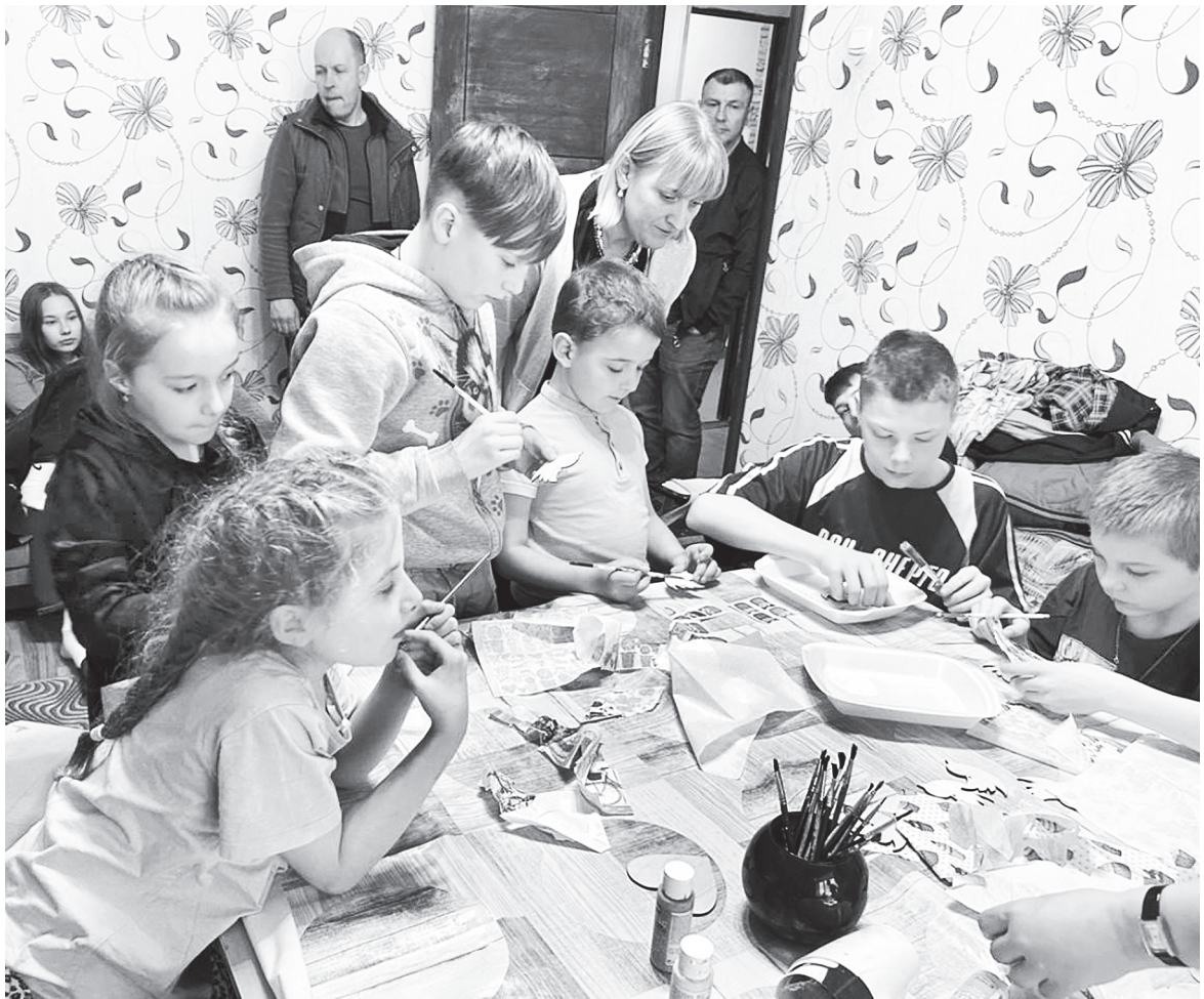
Ребята создают декоративные венки. / ФОТО из архива О.С. Молокитиной

Дальний Восток. Сейчас он отдает долг Родине, служит в армии. Если все получится так, как мы предполагаем, через некоторое время он поедет на Камчатку, будет работать по специальности и развивать спортивное ориентирование. Мы же будем готовить ему в помощь других ребят и девочек, – говорит Оксана Сергеевна.