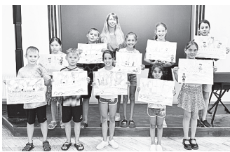
Бумажный флот.

Участники мастер-классов изобразили военный корабль времен Петра I в цвете. Ребята использовали смешанную технику (восковые мелки, акварель, аппликация), изготовили военные корабли из картона и цветной бумаги, построили свой бумажный флот.