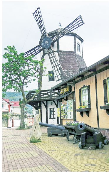
Музей «Хлеба и вина».