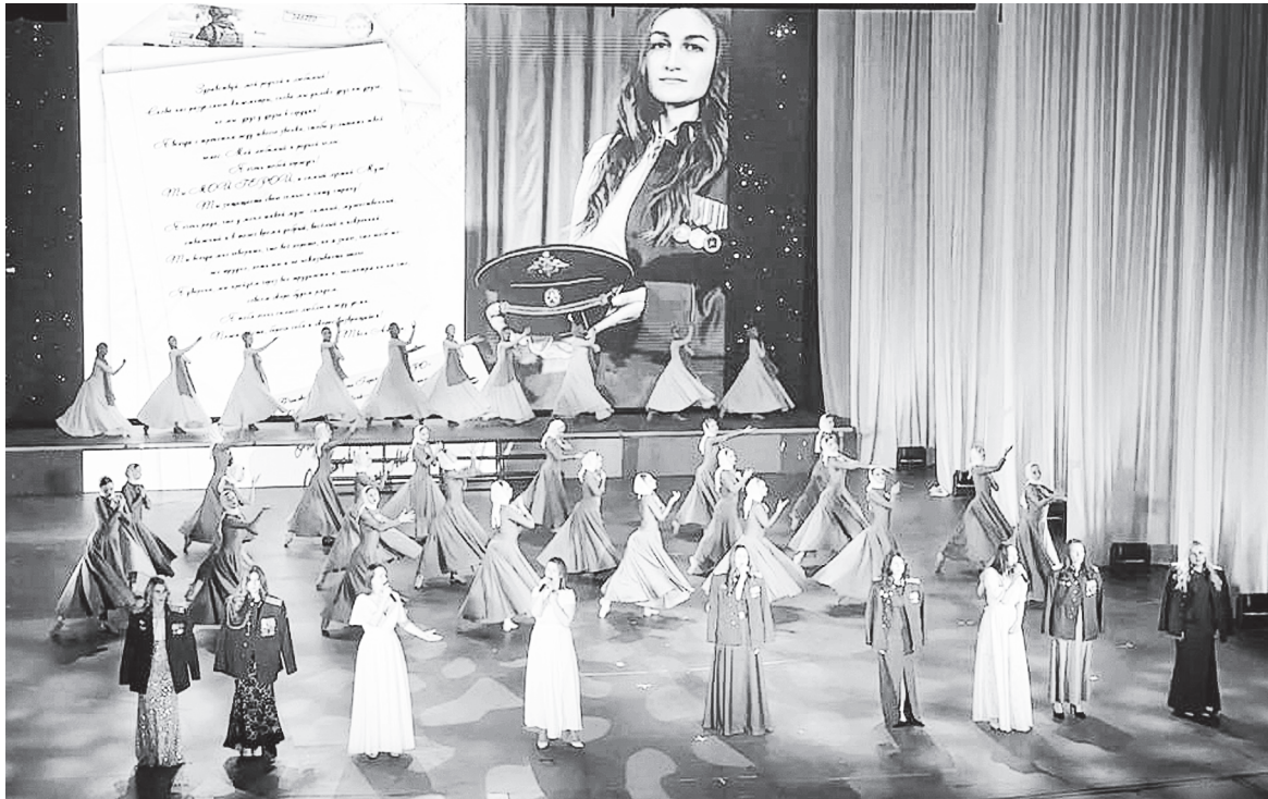
Выступление в рамках проведения Областных праздничных мероприятий, посвященных 79-й годовщине Победы в Великой Отечественной войне (Музыкальный театр, г. Ростов-на-Дону).

семьи. А у меня началась новая история моей общественной деятельности, в новом статусе жены военного.