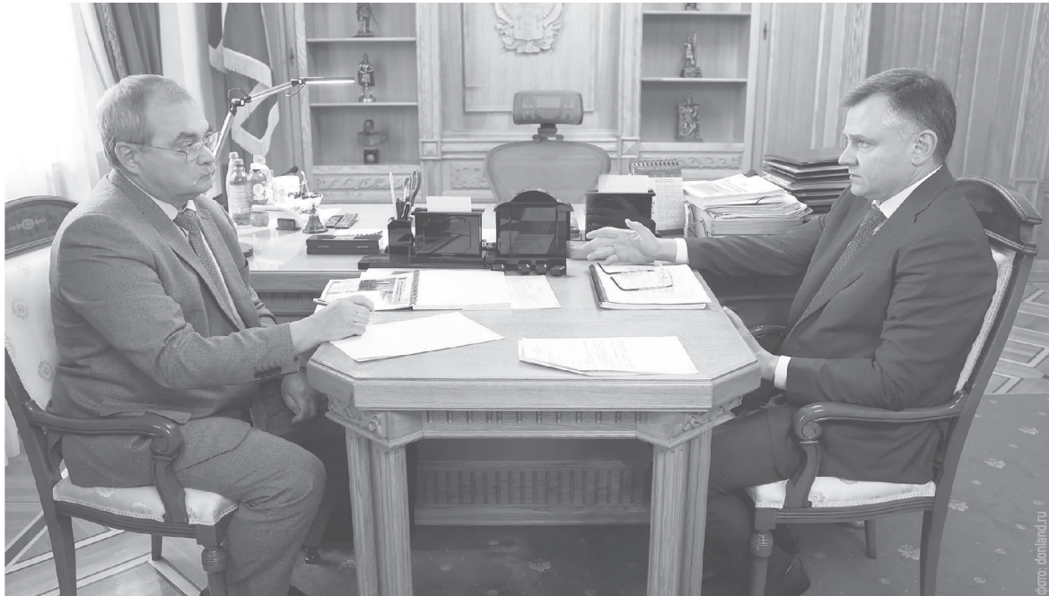
Юрий Слюсарь поручил закончить модернизацию системы водоснабжения в станице Вешенской до конца 2026 года

телей, чтобы по ним было безопасно и комфортно ездить людям, а не для того, чтобы большегрузы их «убивали», – подчеркнул Юрий Слюсарь.