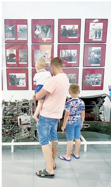
Музей космонавтики.

воображение посетителей. Увидеть дольмены вживую – особое переживание, непохожее ни на что другое. Они словно переносят нас в далекое прошлое, заставляя задуматься о тайнах древних цивилизаций.