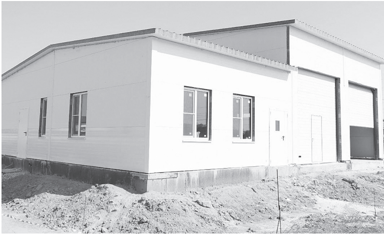
Модульное здание.

Средства на эти цели выделены из муниципального бюджета. Ход выполнения работ проверил глава Администрации Аксайского района К.С. Доморовский.