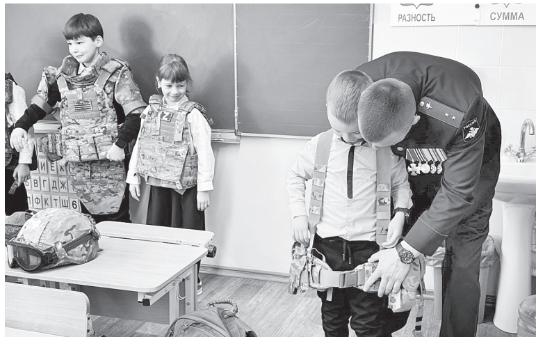
Проведение урока мужества в Гимназии № 3 г. Аксая.

По-прежнему требуется внимание семьям всех категорий