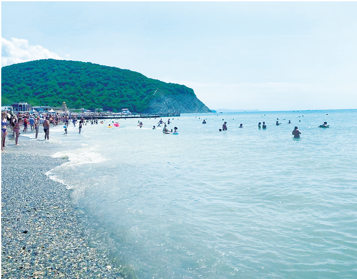
Гора «Ежик» – визитная карточка Архипо-Осиповки.

Главная артерия курортной жизни – приморская набережная Архипо-Осиповки. Этот небольшой, но удивительно уютный променада протянулся вдоль береговой линии