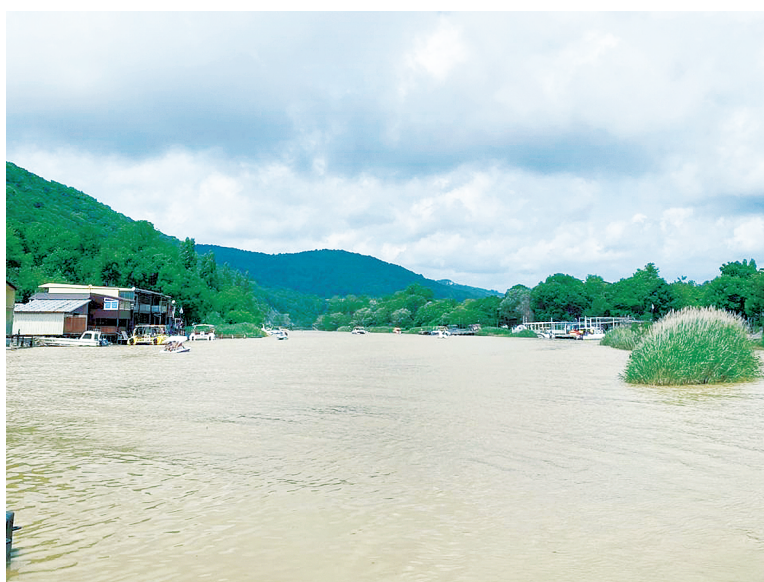
Река Вулан впадает в море прямо на пляже.

Любопытно, что местные жители нередко сравнивают свою набережную с геленджикской. И прав-