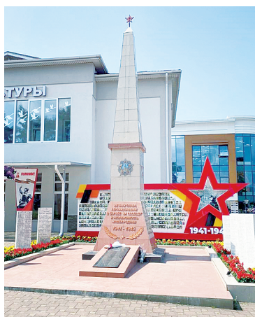
Памятник героям, павшим в ВОВ.

да, определенное стилистическое сходство между ними есть. Хотя по масштабам архиповская набережная, конечно, уступает знаменитой 12-километровой геленджикской, но среди других курортов Большого Геленджика – Кабардинки и Дивноморского – она, бесспорно, занимает лидирующие позиции.