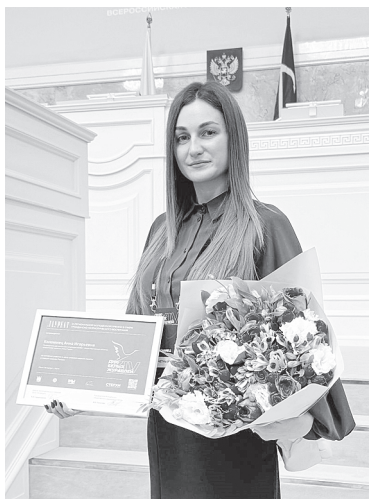
Награждение в рамках проведения научно-практической конференции XIV Всероссийской акции памяти павших воинов России «ДНИ БЕЛЫХ ЖУРАВЛЕЙ» (г. Санкт-Петербург).

Цель данного проекта, в первую очередь, чтобы люди знали о наших героях и их семьях, чттили их подвиги. Важно, во-вторых, чтобы они прочувствовали вместе с этими семьями всю боль, с которой столкнулись герои проекта, и их внутреннюю силу, благодаря которой они живут. В-третьих, что немаловажно, это возможность объединить наши семьи и дать им почувствовать самое главное, что они не одни. И я, и многие другие готовы их поддерживать.