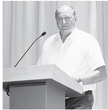
В.А. Еременко.

В поселке Российском заасфальтирован участок дороги по улице Молодежная.