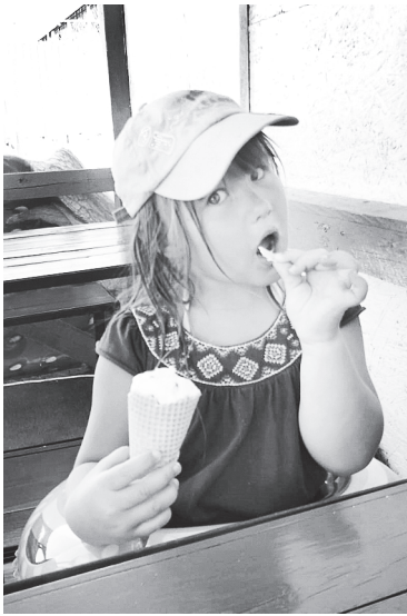
Вкусно!