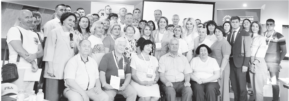
Участники Стратегической сессии.

В РОСТОВСКОЙ ОБЛАСТИ ПРОДОЛЖАЮТСЯ СТРАТЕГИЧЕСКИЕ СЕССИИ ПО ОБНОВЛЕНИЮ СТРАТЕГИИ РАЗВИТИЯ РОСТОВСКОЙ ОБЛАСТИ ДО 2030 ГОДА