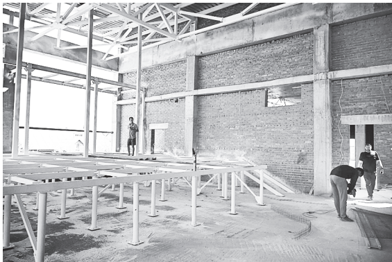
Выездное совещание на территории строящейся школы на улице Речников.

по-прежнему под моим личным контролем. Недостаточную интенсивность и производительность работ фиксируем документально с составлением соответствующих актов. Ежемесячно выставляем подрядчику штрафные санкции