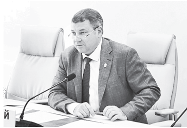
К.С. Доморовский.

1 августа глава Администрации Аксайского района К.С. Доморовский провел заседание районной комиссии по безопасности дорожного движения. На совещании провели анализ аварийности на дорогах за первое полугодие 2025 года, а также обсудили меры по снижению аварийности.