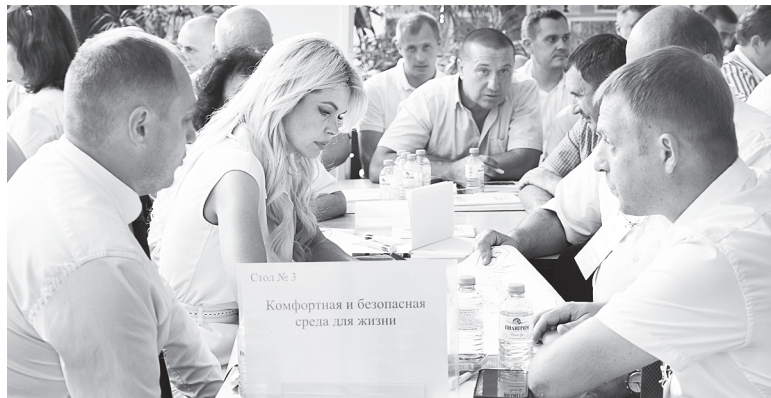
Командная работа.

Специалисты, размышляющие о технологическом лидерстве, выбрали, в том числе, продвижение науки,