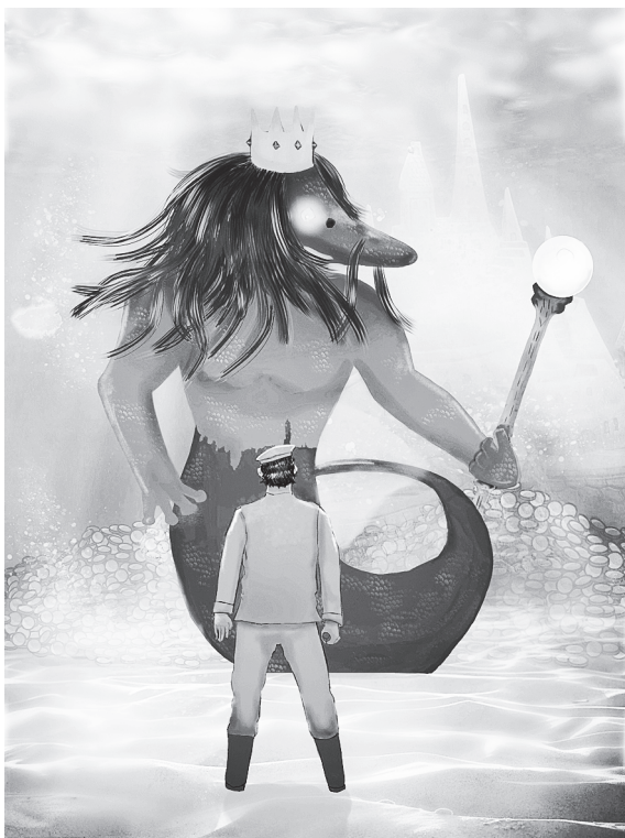
Царь Донец 4 и Степан. / Иллюстрации О.В. Геоня