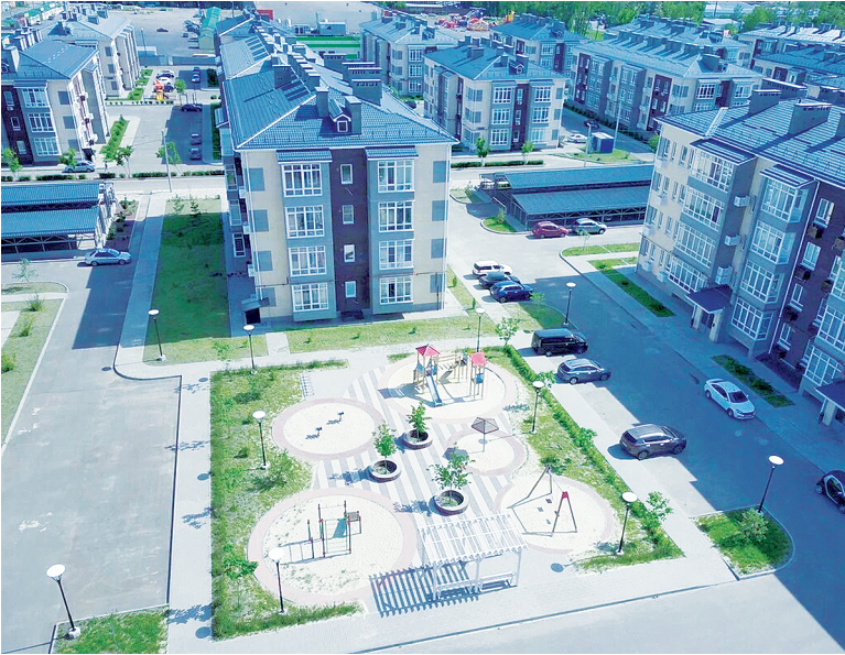
ЖК «Авиатор».

Комплексный капитальный ремонт стал возможен благодаря профессионализму подрядной организации ООО «КИТ-СТРОЙ». Строители провели полный цикл работ, направленных на создание современной образовательной среды.