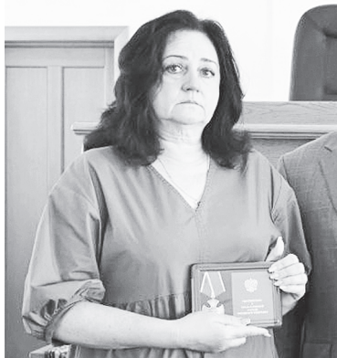
Вручение наград родственникам погибших в Администрации Аксайского района.