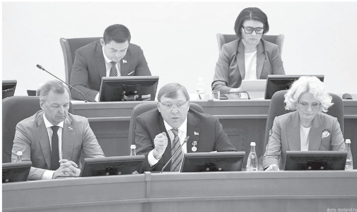
Бюджет Ростовской области всегда формируется и корректируется с учетом потребностей экономики и жителей Дона

годаря новым поправкам получила сфера ЖКХ – 5,8 млрд рублей. Средства направят на капремонт коллектора в г. Таганроге, очистных сооружений канализации в г. Зверево, строительство скважин в Морозовском, Целинском районах, строительство и капитальный ремонт водопроводов в Азовском, Мясниковском, Советском районах и городах Новошахтинске, Ростове-на-Дону.