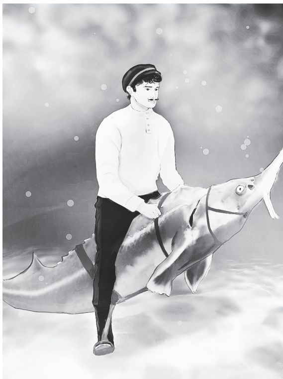
Казак Степан запряг осетра.

И осетры ездовые сгодились: забава такая у казаков появилась, каждый год на осетрах гонки устраивать.