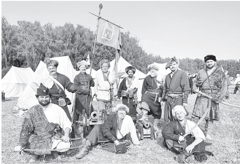
Участники из клуба «Станица Аксайская».

Кульминацией битвы стал дерзкий маневр Воротынского: оставив