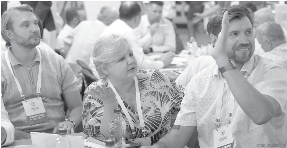
Общая цель участников стратегической сессии – найти решения, которые выведут регион в число технологических лидеров России

«Мы должны чётко понимать, в чём сильная сторона нашей области, в чём сила коллективов, которые здесь работают. Это и есть база для того, чтобы претендовать на лидерство. Все основания у нас есть, нужно просто точнее определить приоритеты и