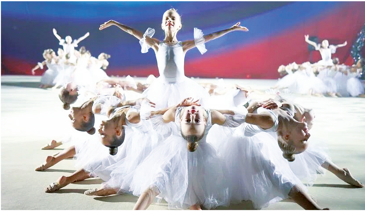
Выступление аксайских гимнасток на новогоднем гала-концерте.