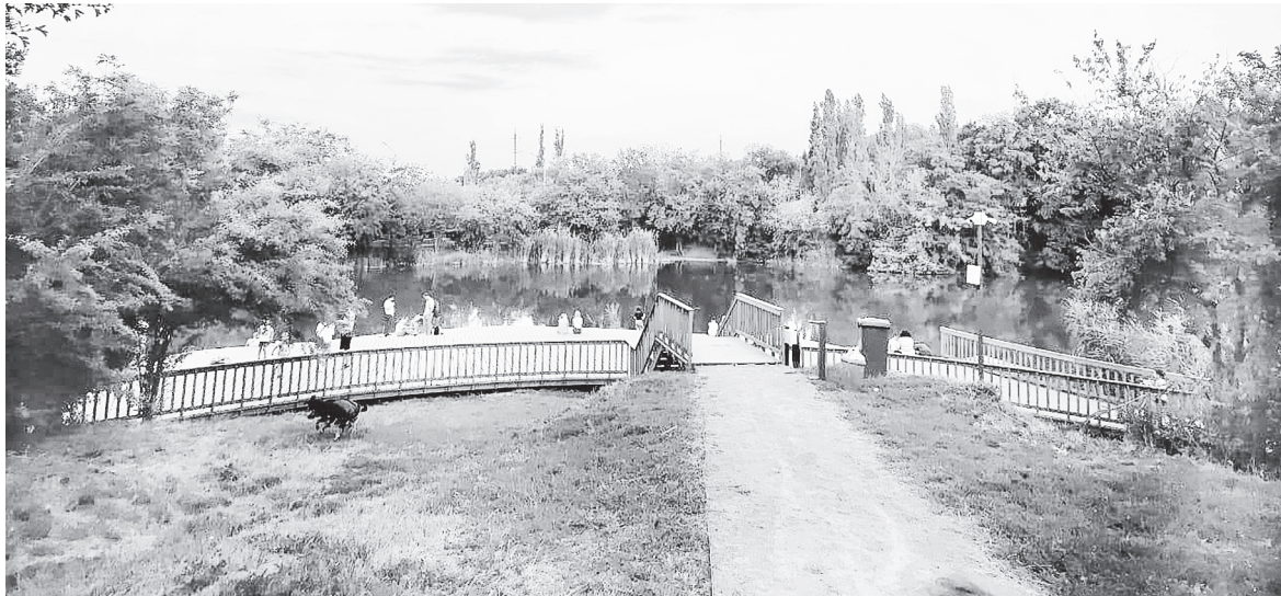
Мухина балка.

МУХИНА БАЛКА – ПРИРОДОООХРАННЫЙ ЗАПОВЕДНИК ОБЛАСТНОГО ЗНАЧЕНИЯ, РАСПОЛОЖЕННЫЙ В АКСАЕ