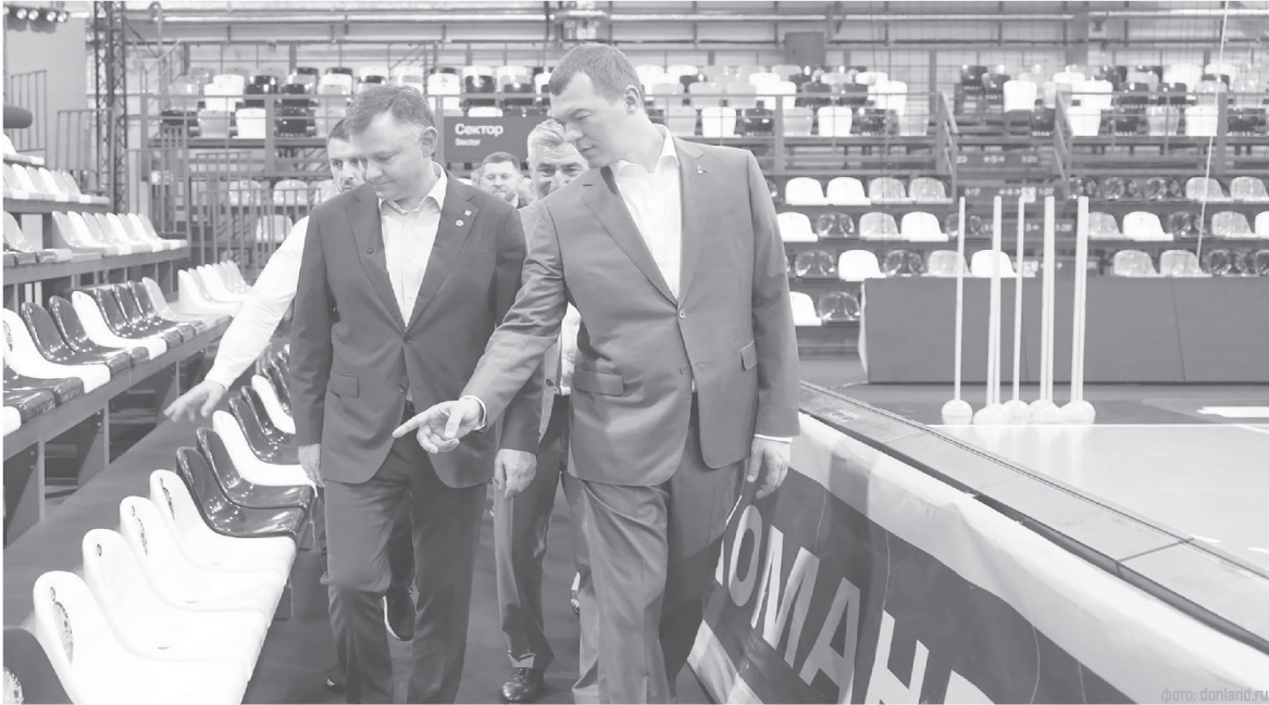
Глава Минспорта РФ Михаил Дегтярев и глава региона Юрий Слюсарь проверили ход работ на спортивных объектах Ростовской области

Министр и глава региона также посетили Ростовское областное училище олимпийского резерва и оценили завершающий этап работ по реконструкции ростовского Дворца спорта. Ремонт в нём проводят впервые с 1967 года, работы идут с опережением графика. Открытие запланировано на сентябрь. Рядом оборудуют