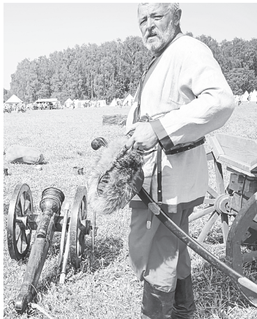
Реконструкция эпизодов битвы.