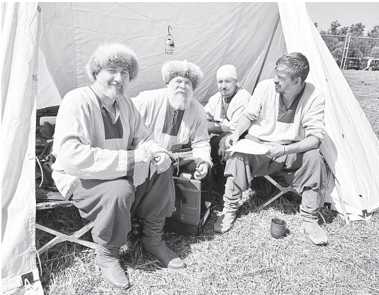
Любо, казаки!

1572 года сражению, от которого действительно зависела судьба всего Русского государства. Благодаря мужеству и стойкости наших предков Россия не прекратила свое существование еще в XVI веке. Фестиваль удался на славу! Отличная погода, грохот орудий и звон стали создавали атмосферу настоящего сражения. Мы были счастливы встретиться с друзьями со всей необъятной Родины. Подобно своим предкам шестнадцатого века, казаки вновь прибыли с берегов Дона и внесли весомый вклад в общую победу над грозным врагом. Нам было приятно принять участие в мероприятии. Выражаем огромную благодарность организаторам за гостеприимство и тепло приема, а также всем участникам фестиваля за великолепное представление исторической битвы! До новых встреч! – поделились участники фестиваля из Аксайского района.