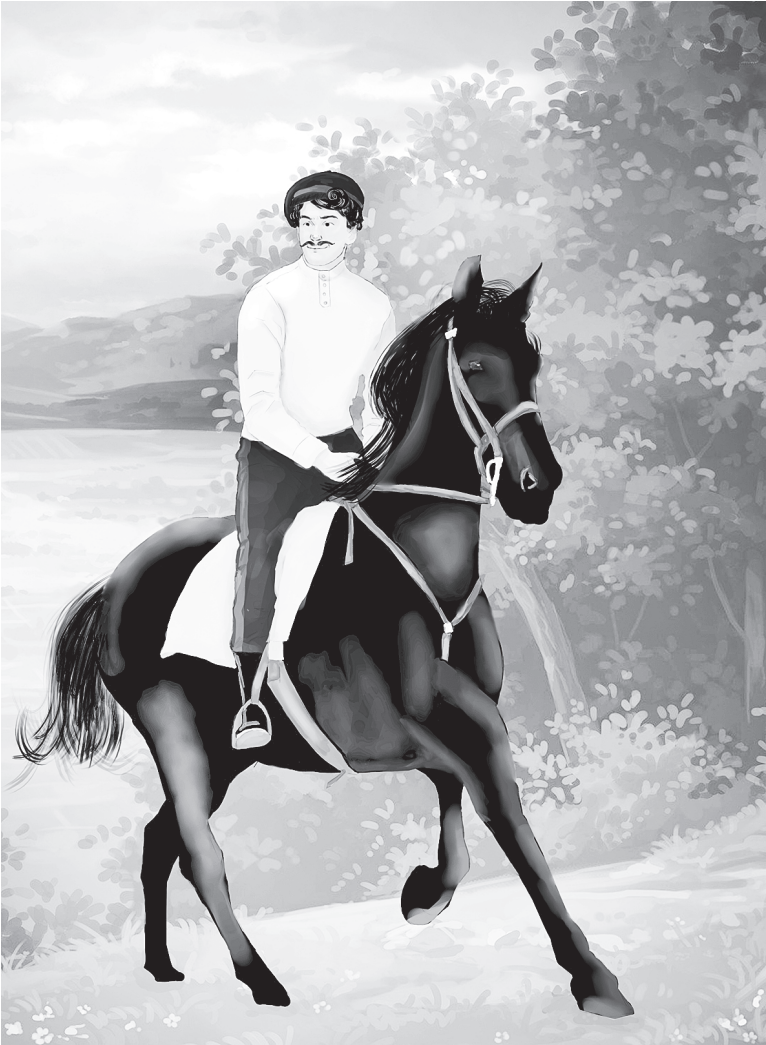
Степан на Орлике. / Иллюстрации О.В. Геоня

– Теперь ты мой пленный, будешь остаток дней в моих владениях коротать, – ехидно произнес Батюшка Донец.