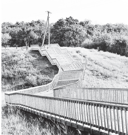
Пейзажи Мухиной балки.

В 1923 году была открыта Аксайская экскурсионная станция Государственного Донского Университета. Здесь была организована лаборатория, музей местной природы и общежитие для студентов, а также одна