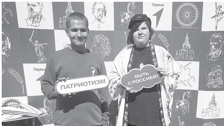
Участники фестиваля инклюзивного добровольчества «Я чувствую».