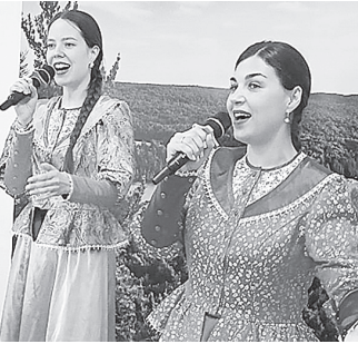
Выступающие и гости праздника.

Атмосферу радости создали участники мероприятия – слушатели «Университета третьего возраста», получатели социальных услуг города Аксая и члены инклюзивной мастерской «Волшебный клубок». Каждый пришедший стал частью большого доброго события.