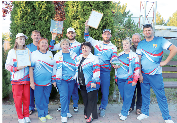
Мы – аксайчане.

Командой «Аксу» была подготовлена стенгазета «Путь длиною в 15 лет». В ней были отражены самые яркие и запоминающиеся моменты всех четырнадцати слетов.