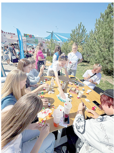
Творческая мастерская фестиваля.

Читайте новости первыми на сайте www.pobeda-aksay.ru и в наших группах соцсетей