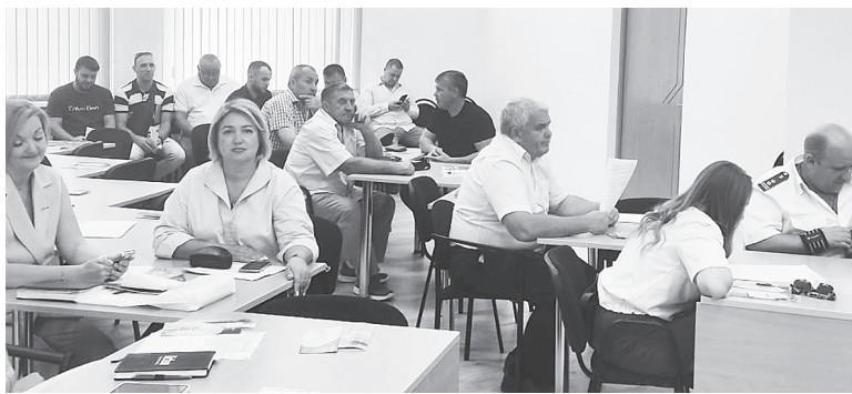
Участники совещания.

Техническую культуру льна масличного в этом году собрали с площади 1 800 гектаров, валовый сбор составил 1 200 тонн. Средняя урожайность 6,8 центнера с гектара, (в 2024 году – 8,3 центнера с гектара). Что касается проса зернового, то с 240 гектаров валовый сбор составил 183 тонны (2024 год – 432 тонны), средняя урожайность – 7,6 ц/га.