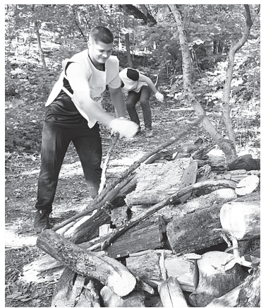
А. Артеменко. / ФОТО автора