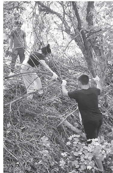
Прошлогодний осенний субботник в Мухиной балке.

Самое замечательное, что ребята сами генерируют идеи, а наша задача – поддержать их, помочь реализовать задуманное. И знаете, я верю, что совсем скоро, когда мы получим статус технику-