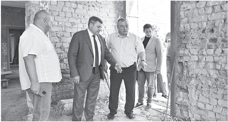
Выездное совещание.

– Считаю, что этого недостаточно на данном этапе, необходимо наращивать темп работ и число рабочих на объекте. Поставил задачу подрядчику закрыть контур здания до конца ноября, чтобы зимой проводить работы в помещении и не терять время. Капитальный ремонт ведется в рамках нацпроекта «Семья». К соблюдению сроков и качества работ – особое внимание на всех уровнях, в том числе со стороны надзорных органов, – подчеркнул в завершение выездного совещания К.С. Доморовский.