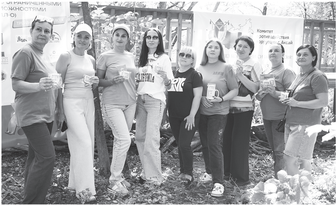
Участники субботника.

Стремление сделать что-то полезное для окружающей нас природы привело к идее провести субботник. Сначала один, потом другой, третий. Тот, что прошел на прошлой неделе, был четвертым. Он был приурочен к 3 сентября. В этот день отмечается День окончания второй мировой войны и завер-