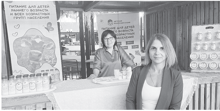
Аксайская молочная кухня на гастрономическом фестивале «Сделано на Дону»

– Современные исследования показывают, что некоторый контакт с