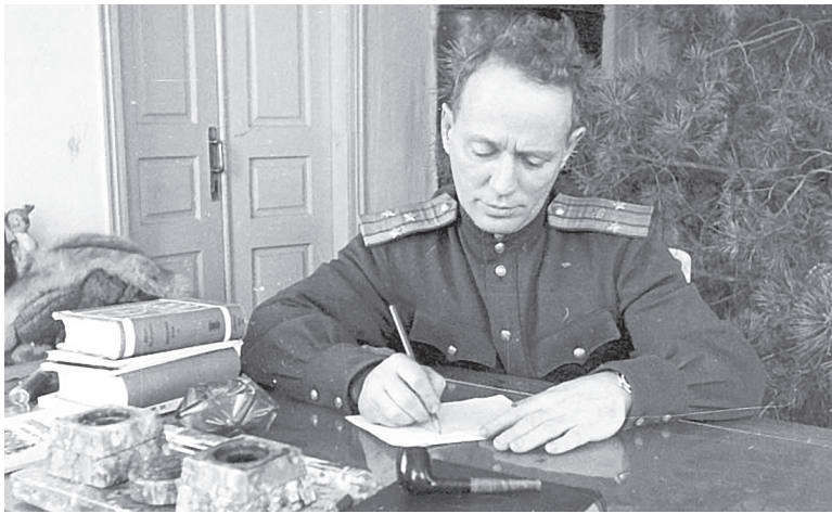
М.А. Шолохов.

● «Только-только прочитал книжку Михаила Шолохова «Они сражались за Родину». Знаете, она меня взволновала до глубины души... Меня особенно потрясло описание боя за высоту. С 30 августа по 2 сентября мне пришлось быть на такой же высоте, оборонять ее. Немцы бросались по шесть раз в атаку с танками, но наши бойцы и офицеры отбивали их. Они знали, что враг бросается в последней агонии перед смертью поганой своей. Немцы на высоту за 40 минут выпускали до 600 штук снарядов и мин, обстреливая вы-