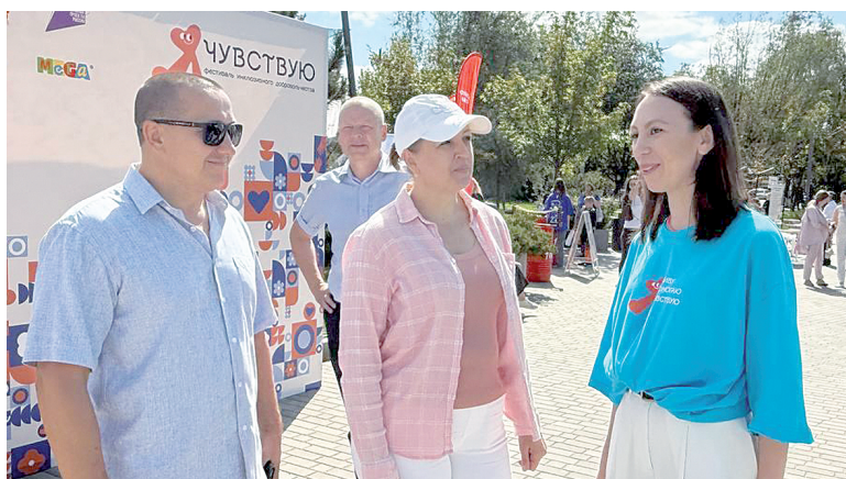
Е.А. Клёсов, О.Н. Пушкина, А.Р. Литвиненко.

На входе в парк мы заметили очень увлеченных девушек, которые занимались подготовкой своей локации к мастер-классам. Это были