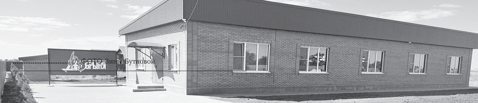
Спортивно-бойцовский клуб «Добрыня».