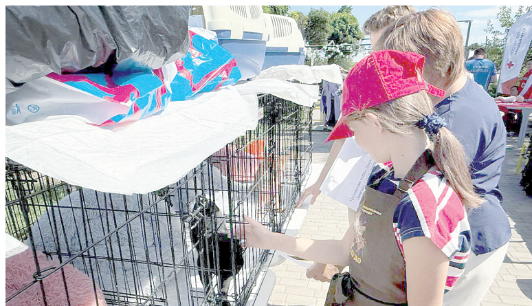
Проект «Животные СВО».

Волонтеры – это люди с добрыми, открытыми сердцами. В этом