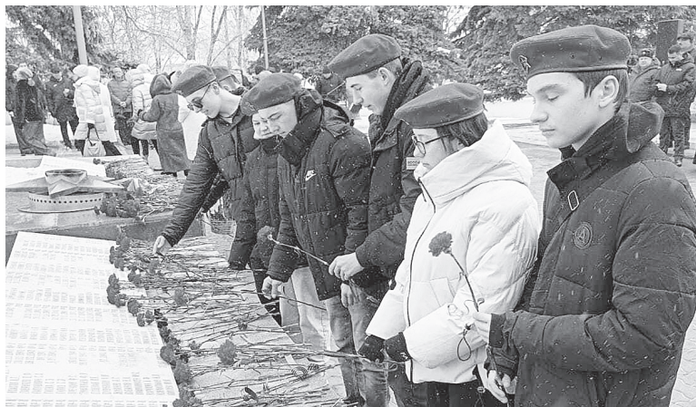
Памятный митинг «Склоним головы у обелиска».