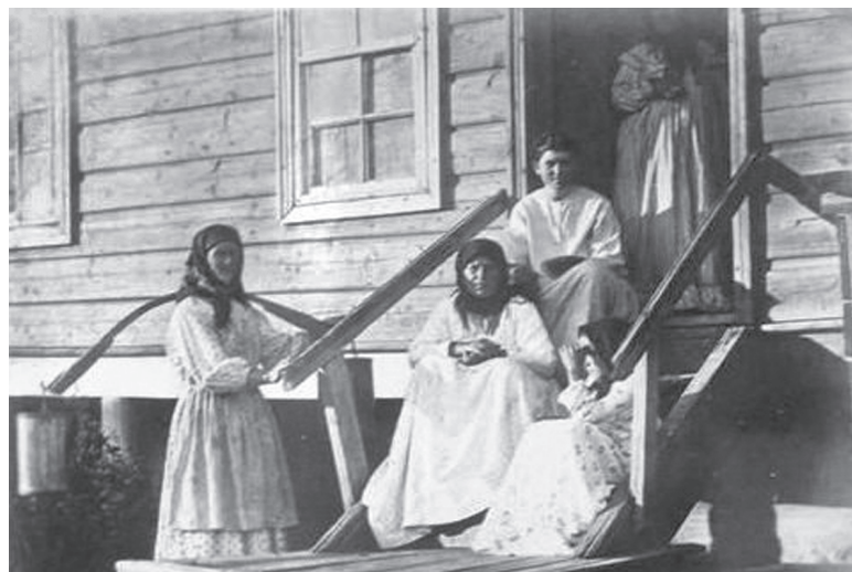
«Казачки в праздник. Цимлянская станица».