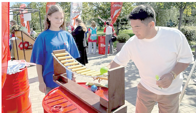
Игра от «Движения Первых».