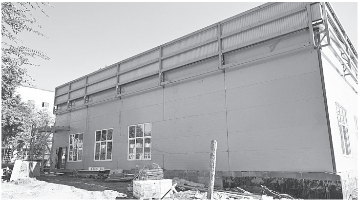
Здание строящегося центра.

Открыть Молодежный центр планируется в ноябре этого года.