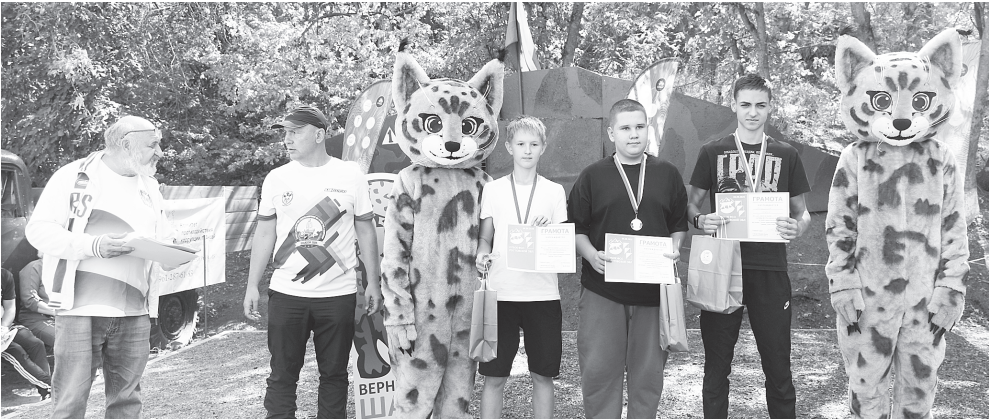
Награждение победителей и призеров.

НА СОРЕВНОВАНИЯ ПО ТРЕЙЛ-ОРИЕНТИРОВАНИЮ В АКСАЙ ПРИЕХАЛИ СПОРТСМЕНЫ ИЗ РАЗНЫХ УГОЛКОВ ОБЛАСТИ