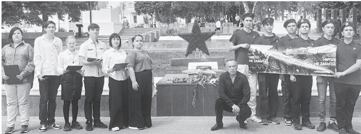
Митинг на площади Героев, посвященный 80-летию Победы в Великой Отечественной войне.

в акции «Лица Героев» – Президента Российской Федерации В.В. Путина в качестве лица, символизирующего наш вклад в патриотическое воспитание молодежи, подчеркивающего важность сохранения исторической памяти и воспитания молодежи в духе гордости за свою страну и ее защитников.