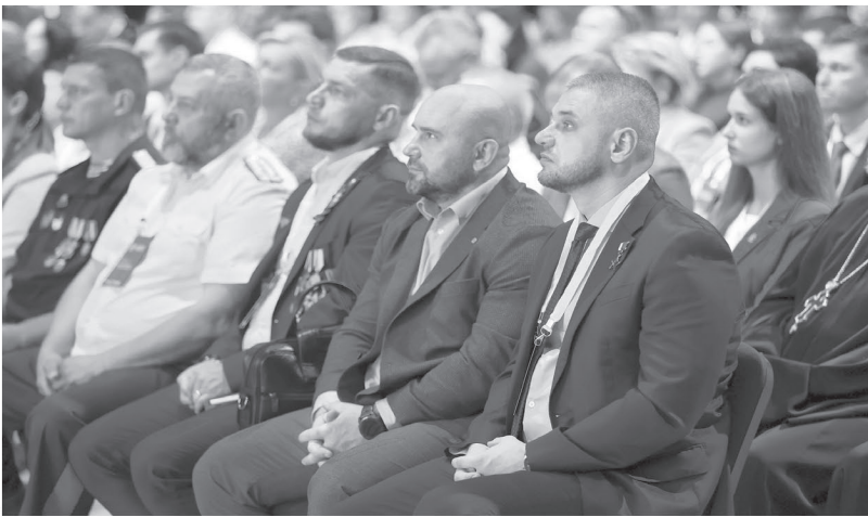
Больше 16 тысяч предложений от экспертов и жителей Дона собрано в стратегию развития Ростовской области до 2030 года

Вопрос он поднимал лично во время рабочей встречи с прези-