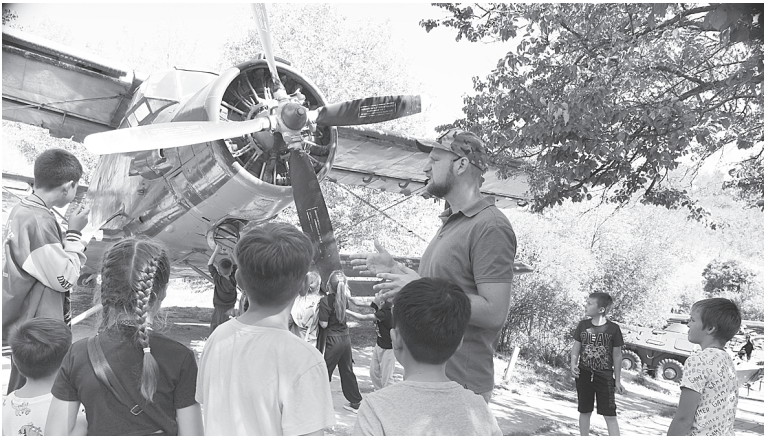
Интересная экскурсия.

ском военно-историческом музее они оказались впервые.