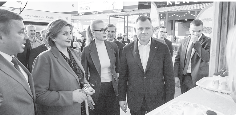
Глава региона знакомится с Детской молочной кухней города Аксая.

возможность участвовать в закупочных сессиях, фестивалях и ярмарках.