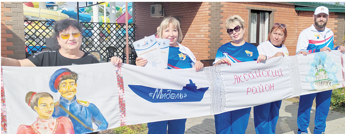
Рушник команды Аксайского района.