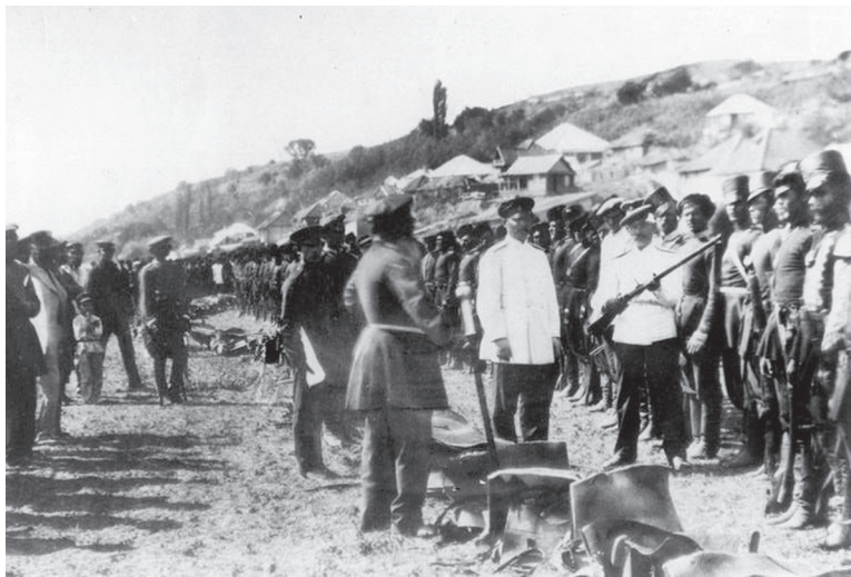
Фотокопия И.В. Болдырева «Смотр казаков атаманом отдела. Сентябрь 1876 года». / ФОТО из фондов Старочеркасского музея-заповедника

пленки знаменитой фирмой «Истмен-Кодак».