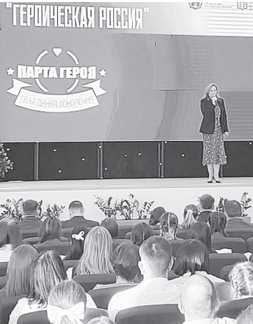
Л.Н. Тутова.

В сентябре на Дону стартуют форумы «Героическая Россия» по сохранению памяти о подвигах предков.