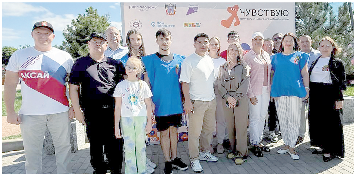
Делегация Аксайского района.

«Я ЧУВСТВУЮ»: В «МЕГА ПАРКЕ» СОСТОЯЛСЯ ЮБИЛЕЙНЫЙ ФЕСТИВАЛЬ ДОБРОТЫ