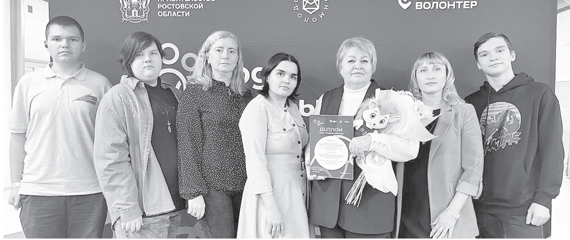
Аксайское профессиональное училище № 56 – лидер эстафеты добрых дел в номинации «Самая добрая организация среднего профессионального образования (по добрым делам)».

– У нас в училище очень насыщенная жизнь! Мы развиваем несколько важных направлений: экологическое воспитание, волонтерское движение, открыто первичное отделение «Движения Первых», настоящим прорывом стало открытие в 2024 году юнармейского отряда «Созвездие». В 2025 году мы запустили работу медиацентра. Хотелось бы выделить, что особое внимание в это непростое для страны время, мы уделяем помощи бойцам, находящимся в зоне проведения специальной военной операции.