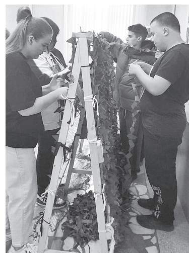
Плетение маскировочных сетей в ДК «Молодежный».

ма, наша работа станет еще более масштабной. Мы сможем больше помогать, больше делать для наших детей, развивать центр добрых дел.