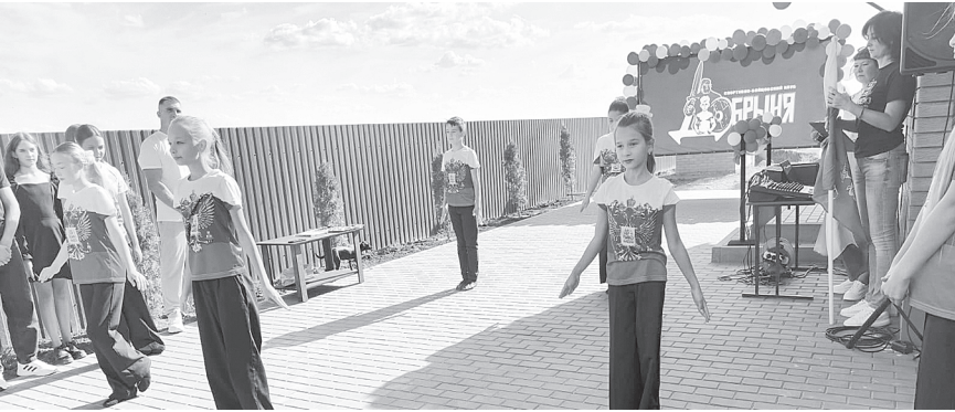
Хореографический коллектив «Фантазия».