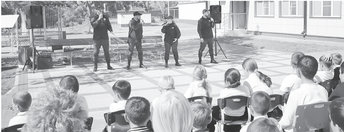
Идет концертная программа.

Во вторник, 16 сентября, тематическая программа «Памятью жива Россия» прошла в средней образовательной школе ст. Ольгинской Аксайского района. Народный ансамбль «Донцы» исполнил патриотические песенные композиции в поддержку специальной военной операции. На концерт собрались учащиеся и педагоги школы, с воодушевлением слушая лучшие песенные композиции современности. Члены Общественного