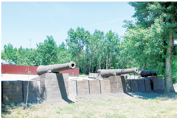
Даниловский бастион.

Последние десять лет стали для станицы временем масштабных преобразований. Здесь появился современный подводный водопровод, проведена реконструкция разводящего водопровода, введена в эксплуатацию новая водонасосная станция. Благоустроенные улицы теперь освещаются обновленной системой освещения. Особого внимания заслуживает обновленная парковая зона, ставшая настоящим центром притяжения для жителей и гостей станицы. Здесь расположился уютный конный манеж, современные площадки для проведения культурных мероприятий, уютные зоны отдыха для всей семьи. Венчает этот ансамбль великолепный концертный форум, способный принять 600 зрителей. Значительным достижением стало присвоение станице почетного звания «Населенный пункт воинской доблести». Высокую оценку получила и работа по сохранению исторического облика – Старочеркасская успешно прошла сертификацию Ассоциации «Самые красивые деревни и малые городки России». Сегодня, накануне своего 455-летия, древняя столица донского казачества уверенно шагает в будущее, сохраняя при этом свою уникальную историческую самобытность.