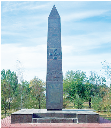
Старочеркасск – населенный пункт воинской доблести.

Уникальное расположение станицы, всего в 35 километрах от Ростова-на-Дону вверх по