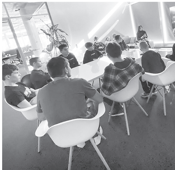
Воспитанники Центра в IT-компании ОДЖЕТТО.