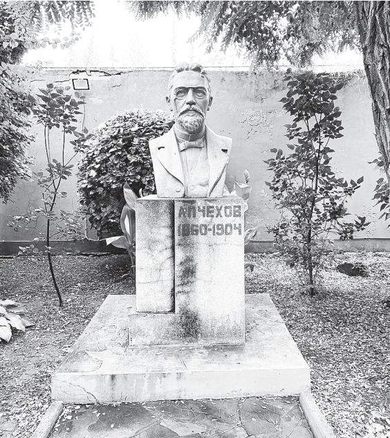
Бюст А.П. Чехова и дом семьи Чеховых.

«НЕУЖЕЛИ ЗДЕСЬ ХОДИЛ САМ АНТОН ПАВЛОВИЧ?»