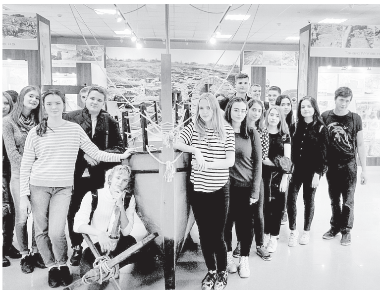
Ученики Рассветовской школы в «Танаисе».

Буквально на этой неделе, во вторник, учитель и ее ученики поехали в Военно-исторический музейный комплекс «Самбекские высоты». С этим местом у педагога связаны особенные воспоминания. С одним из своих классов она готовила литературно-музыкальную композицию «Самбек». Это было в то время, когда музейный комплекс только собирались строить. Ученики поехали туда, чтобы посмотреть то место, где шли кровопролитные бои, и возложить цветы к Вечному огню, вспомнить о том, какой ценой досталась нам Победа, о подвигах воевавших здесь фронтовиков. Для своей постановки ребята сделали памятник из картона. В первом ряду