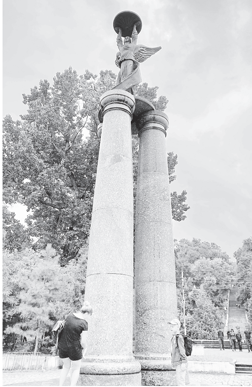
К 300-летию Таганрога.