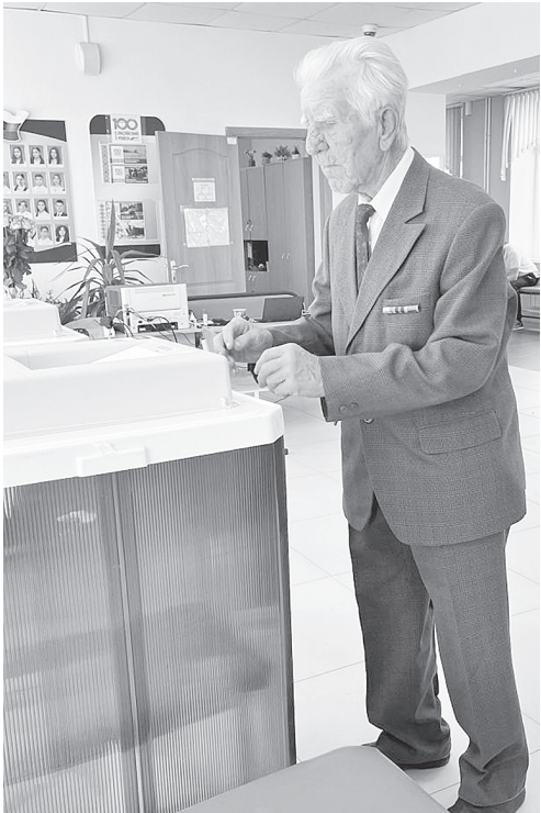
● На выборы – всей семьей. ● Своим принципам не изменяем