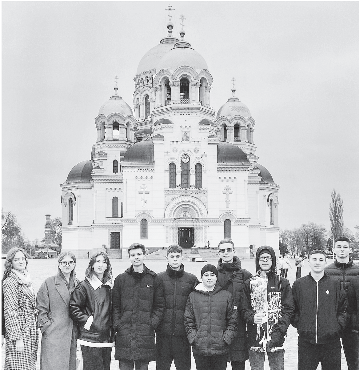
В Новочеркасске.

Лариса Викторовна организует поездки с детьми с 1994 года. За три десятка лет сложилась определенная система. В пятом классе ребята начинают знакомиться с Аксайским районом, посещают Почтовую станцию, Таможенную заставу, военно-исторический