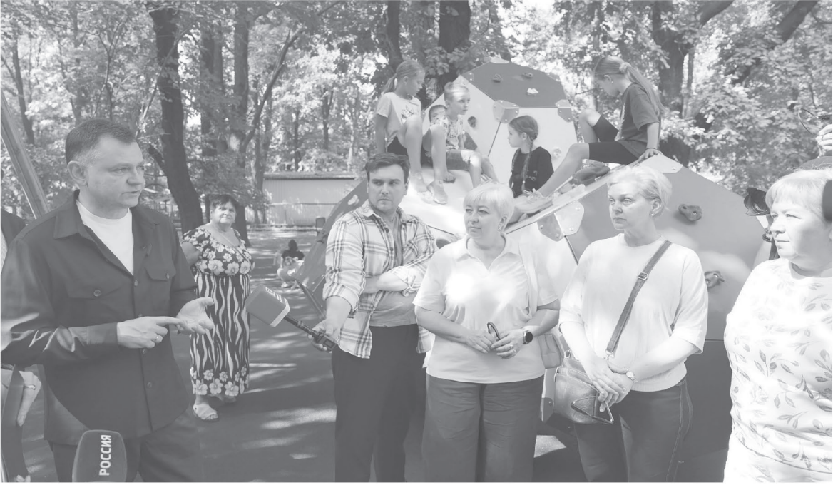
Глава региона общается с жителями: что удалось сделать и что ещё предстоит

В городе ремонтируют аварийный коллектор на улице Мало-Почтовая. Почти 300 метров старых труб в плачевном состоянии, из-за этого вода в дома поступает с перебоями. На обновление коллектора из областного бюджета выделили 146 миллионов рублей. Решение об этом Юрий Слюсарь принял в апреле, когда приезжал с проверкой на другой участок коллектора по улице 1-я Котельная. Работы идут с весны, подрядчик обещает успеть в срок и закончить к концу ноября. – Коммунальные сети в Таганроге сильно изношены. Работы идут на разных участках с декабря прошлого года. Тема в целом очень острая для всех наших муниципалитетов. Поэтому одним из главных приоритетов как минимум на ближайшую трехлетку будет решение проблем в ЖКХ региона. Эту задачу мы закрепим