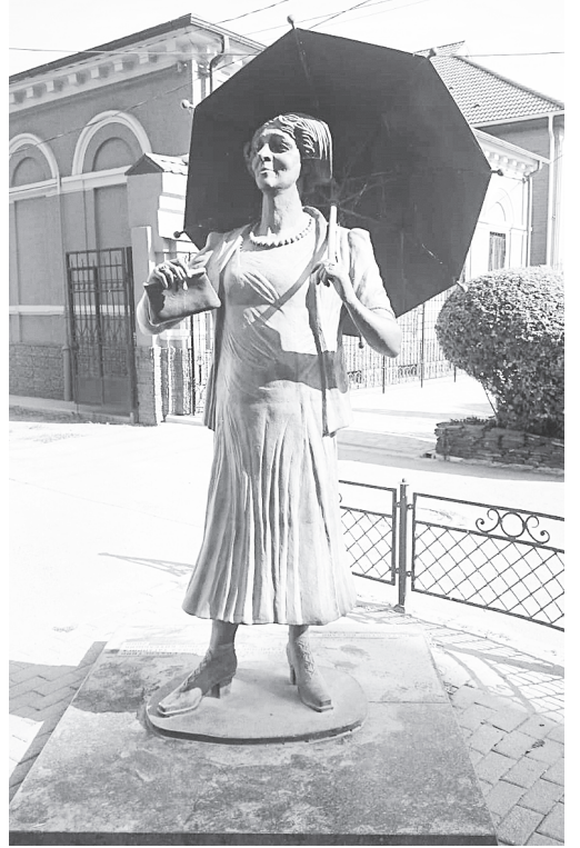
Фаина Раневская.