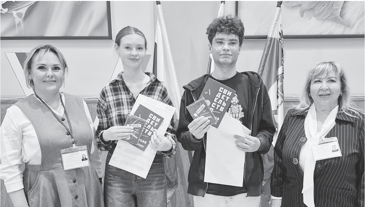
Встречаем впервые голосующих.

Особое внимание на избирательных участках уделяли впервые голосующим молодым жителям района. В честь этого события им вручали обложки на паспорт и свидетельство избирателя. Те, кто по состоянию здоровья или по иным причинам не смог