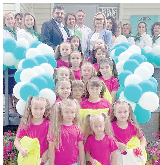
С воспитанниками Ольгинского СДК.