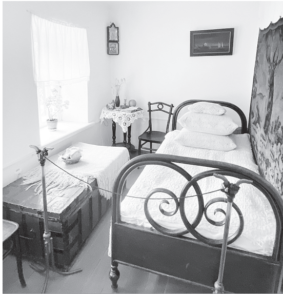
В «Домике Чехова» воссоздана обстановка, которая окружала писателя в детстве.