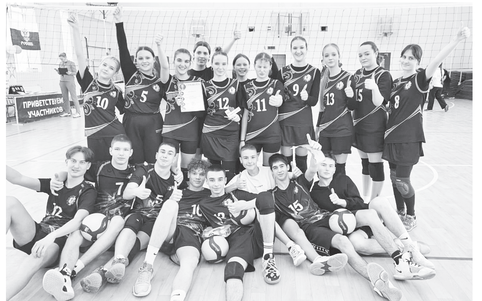
Победители районного турнира по волейболу.