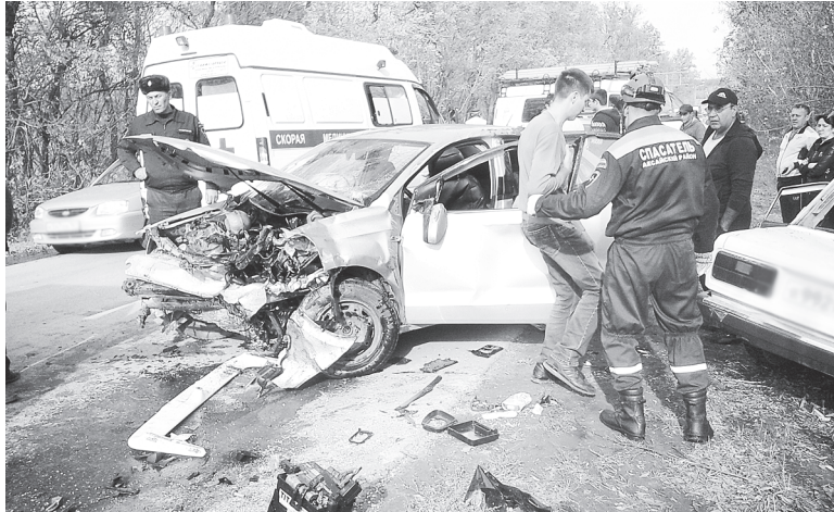
Аксайские спасатели на выездах.

ГОТОВНОСТЬ К ЧРЕЗВЫЧАЙНЫМ СИТУАЦИЯМ ВАЖНА НЕ ТОЛЬКО ДЛЯ ПРОФЕССИОНАЛЬНЫХ СЛУЖБ, НО И ОБЫЧНЫХ ЛЮДЕЙ