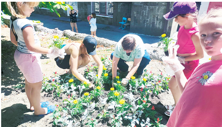
Педагог сажает с ребятами клумбу памяти к юбилею Победы.