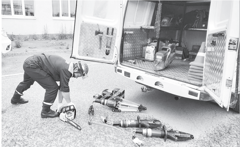
Тушение ландшафтного пожара.

В целях предотвращения и снижения риска возникновения чрезвычайных ситуаций, а также минимизации социального и экономического ущерба, наносимого населению, экономике и природной среде, от чрезвычайных ситуаций природного и техногенного характера, пожаров и происшествий на водных объектах МБУ АР «УПЧС» реализует целую систему мероприятий. Это, прежде всего, создание условий для повышения уровня пожарной безопасности, снижению рисков возникновения и масштабов чрезвычайных ситуаций природного и техногенного характера, выполнение мероприятий по на-