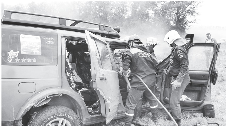
Тушение ландшафтного пожара.

На сегодняшний день МБУ АР «УПЧС» достигнуты следующие результаты. Во-первых, снижены риски возникновения пожаров, чрезвычайных ситуаций, несчастных случаев на воде и минимизированы их возможные последствия. Во-вторых, повышается уровень безопасности населения от чрезвычайных ситуаций природного и техногенного характера, пожаров и происшествий на водных объектах. В третьих, организуются сходы (встречи) с населением, на