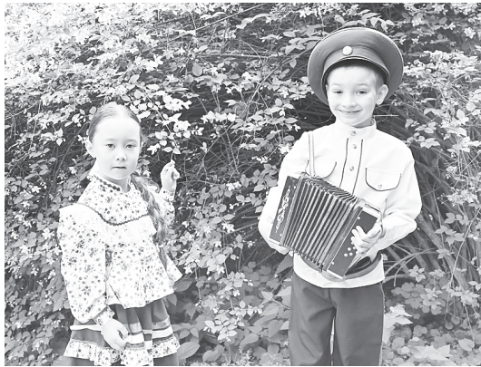
Играй, гармоны!

Историческое путешествие произошло на знаковых площадках Аксая. Участники побывали в Аксайском воен-