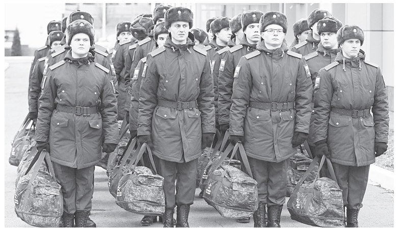
Осенью 2025 года призыву подлежат граждане в возрасте от 18 до 30 лет.

Мероприятия весеннего призыва не связаны с проведением специальной военной операции,