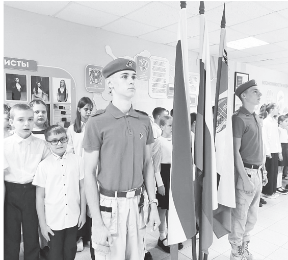
Церемония выноса Государственного флага и исполнение Гимна Российской Федерации.

РАССВЕТОВСКАЯ ШКОЛА ПРОДОЛЖАЕТ РАЗВИВАТЬСЯ, СОЗДАВАЯ ВСЕ УСЛОВИЯ ДЛЯ РАСКРЫТИЯ ПОТЕНЦИАЛА КАЖДОГО УЧЕНИКА