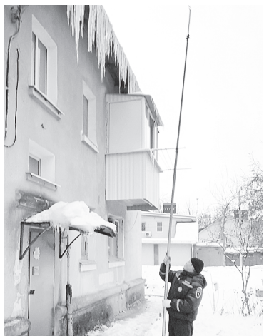
Борьба с обледенениями.

ЕДДС-112 Аксайского района является органом повседневного управления территориальной подсистемы единой государственной системы предупреждения и ликвидации чрезвычайных ситуаций на муниципальном уровне. ЕДДС-112 Аксайского района осуществляет обеспечение деятельности ОМСУ в области защиты населения и территорий от чрезвычайных ситуаций, управления силами и средствами РСЧС, предназначенными и привлекаемыми для предупреждения и ликвидации ЧС, а также в условиях ведения ГО, организации информационного взаимодействия ФОИВ, ИО РО, ОМСУ и организаций при осуществлении мер информационной поддержки принятия решений и при решении задач