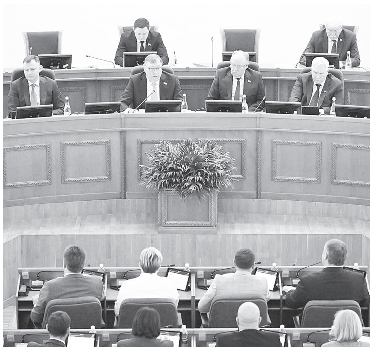
Идет заседание.

Глава донского парламента пояснил, что в настоящее время компенсация на оплату жилищно-коммунальных услуг