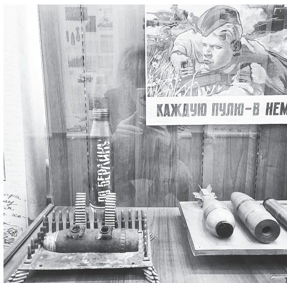
Экспонаты выставки.

В.Ф. Войно-Ясенецкий был главным хирургом тамбовских эвакогоспиталей, профессором, ученым с мировым именем, оставившим неизгладимый след в науке и в духовной жизни нашей Родины, будущего архиепископа