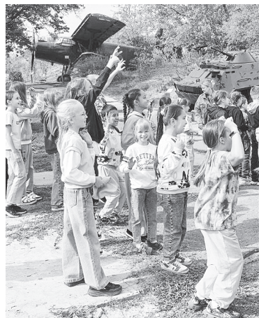
Ребята на территории военно-исторического музея.

Подобные экскурсии становятся важным звеном в цепи патриотического воспитания молодого поколения, помогая детям лучше понять и полюбить свою малую родину.