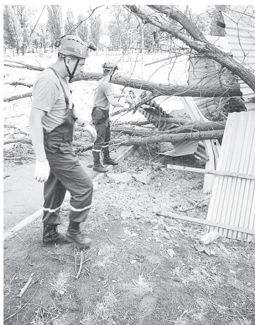
Спасатели убирают упавшее дерево.

В полномочия учреждения входят планирование, организация и осуществление мероприятий на территории Аксайского района по гражданской обороне, разработка и реализация плана гражданской обороны, плана защиты населения и территории от чрезвычайных ситуаций природного и техногенного характера, обеспечение пожарной безопасности и безопасности людей на водных объектах, создание, эксплуатация и развитие системы «112», построение, внедрение, функционирование и развитие аппаратно-программного комплекса «Безопасный город», интеграция аппаратно-программного комплекса «Безопасный город» Аксайского района с аппаратно-программным комплексом «Безопасный город» Ростовской области, подготовка и содержание в готовности необходимых сил и