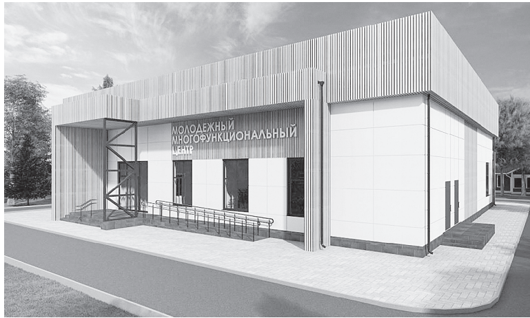
Макет будущего модульного молодежного центра в Аксае. / Макет здания aksayland.ru

На базе молодежных центров и добровольческих площадок ведется работа по поддержке инициатив молодежи и организации досуга. В регионе действует 52 молодежных центра, 42 муниципальных центра добровольчества, 27 «добро.центров», десять кабинетов добровольца, 55 муниципальных штабов «МыВместе», а также 45 зональных центров по подготовке молодежи к военной службе и военно-патри-