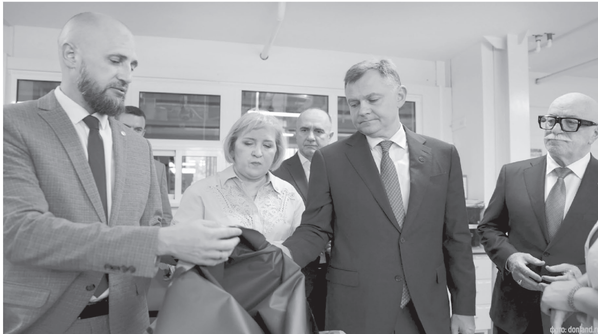
Современные ткани, произведенные на предприятии, позволяют заместить импорт и обеспечить швейные мощности

Уже сейчас текстильное производство заметно снизило зависимость швейных мощностей предприятия от импортных поставок.