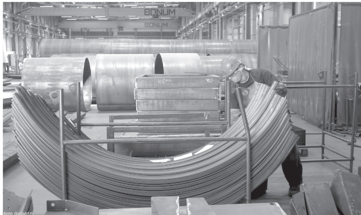
Предприятия Ростовской области с каждым годом расширяют ассортимент экспортных предложений

При этом на Дону идет внедрение Регионального экспортного стандарта 2.0, главная цель которого – закрепить в регионе комплекс мер, позволяющих