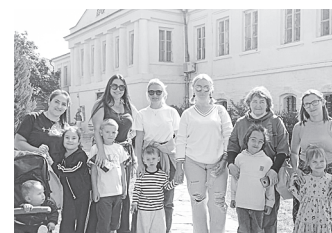
Семейная поездка в Старочеркасск.

Воспитанники детского сада «Лилия» посетили Старочеркасск – столицу донского казачества.