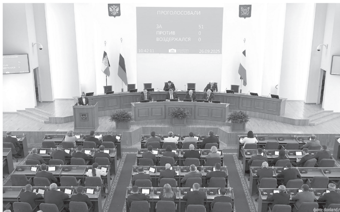
Принятые депутатами поправки – шаги к достижению целей донской «Стратегии-2030»