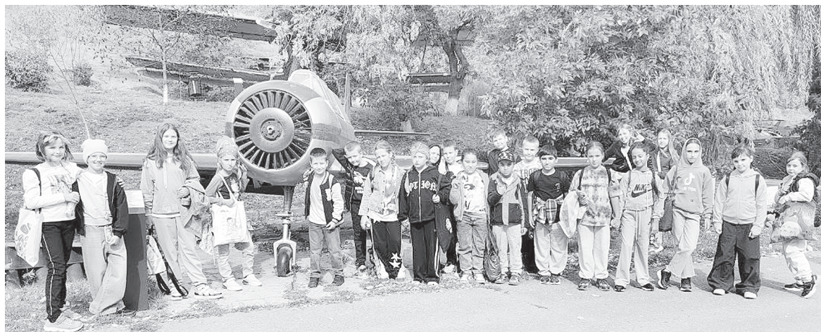
Батайские школьники на экскурсии.

Образовательная экспедиция стала настоящим открытием для