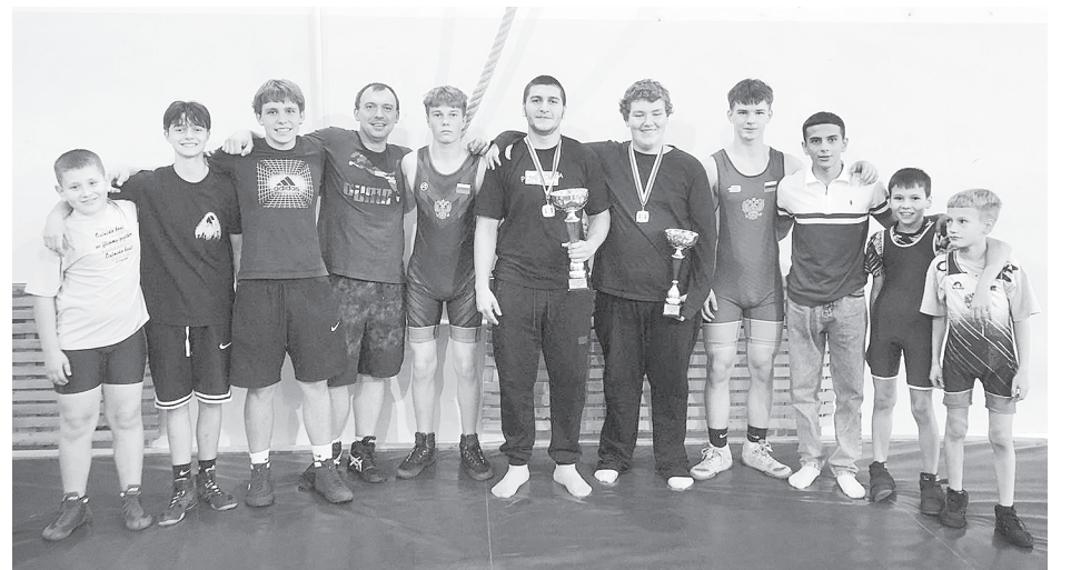
Победители в центре.