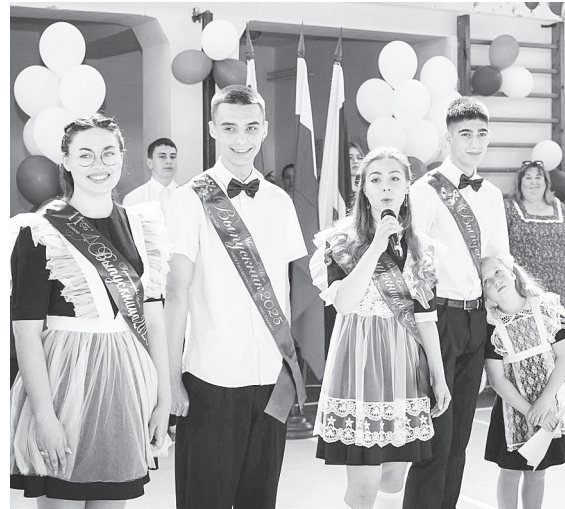
Последний звонок.

С 2019 года работает Центр образования цифрового и гуманитарного профилей «Точка роста», реализуются сетевые формы обучения в рамках реализации регионального проекта «Современная школа». Заключены договоры о сотрудничестве с Ростовским государственным экономическим университетом (РИНХ), Донским государственным техническим университетом. Такое партнерство открывает нам новые перспективы в системе образования. В 2025 – 2026 учебном году открылся первый казачий класс.