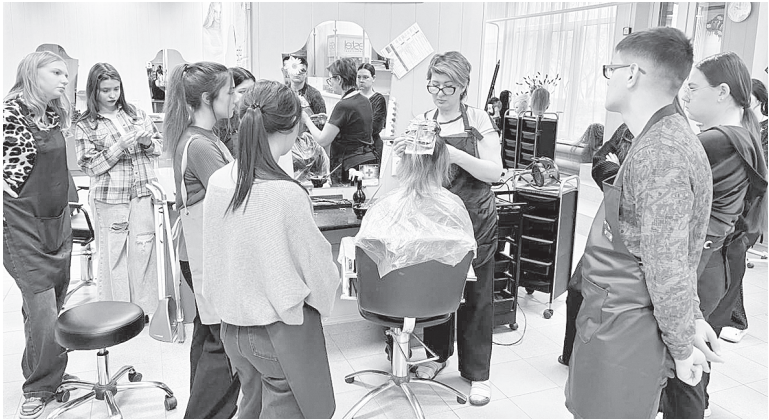
● Урок на тему окрашивания волос с мастером производственного обучения Е.В. Логвиновой. ● Учебная практика у будущих кондитеров.