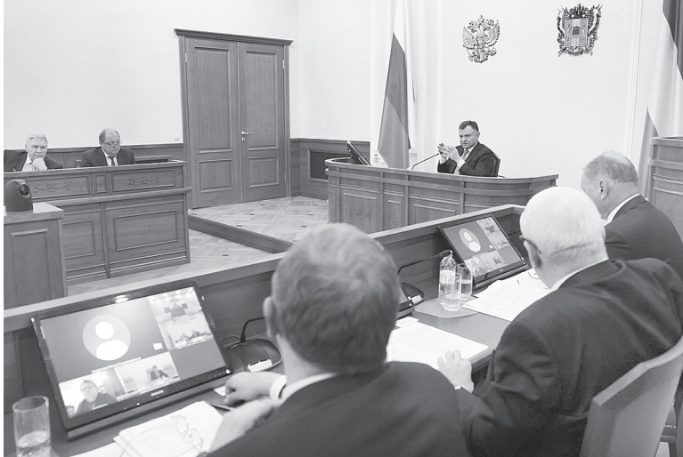
Заседание Правительства Ростовской области.

В Мясниковском районе инвестор хочет построить на 159,8 га коттеджный поселок с несколькими малоэтажными многоквартирными домами, всего новостройки рассчитаны на 7 000 жителей. Помимо жилья, инвестор готов строить социальную инфраструктуру – детские сады, школы, поликлинику, пожарное депо, а также рекреационные зоны и коммерческие объекты.