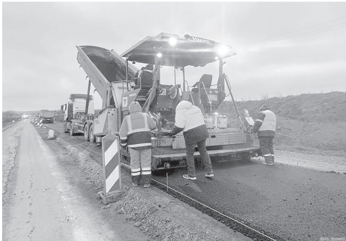
Дорожные работы в Ростовской области выполняются по графику

В новом году правительство Ростовской области планирует провести работу над тарифами на межмуниципальные маршруты и развитием сети дачных направлений.