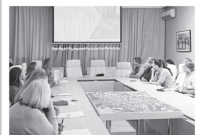
Заседание штаба.

В ходе подготовки к штабу сотрудниками администрации были выявлены факты ненадлежащей уборки земельных участков, находящихся в собственности предприятий и организаций, и прилегающих к ним территорий.