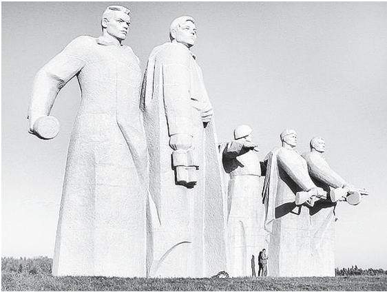
«Мемориал героям-панфиловцам» у развязда Дубосеково.

Сегодня архитектурный ансамбль Могилы Неизвестного Солдата – один из самых узнаваемых памятников Москвы и России. Даже спустя 50 лет этот мемориал не потерял своей актуальности и значимости для истории страны. В 2009 году по распоряжению Президента РФ Владимира Путина он был включен в список особо ценных объектов культурного наследия народов России. Памятник представляет собой надгробную плиту, покрытую бронзовым знаменем. На нем лежат солдатская каска и лавровая ветвь, также выполненные из бронзы. В центре мемориального комплекса – пятиконечная звезда, в ней горит Вечный огонь славы. Рядом виднеется знаменитая надпись «Имя твоё неизвестно, подвиг твой бессмертен». Справа от мемориала находится гранитная аллея, ее украшают темно-красные порфировые тумбы. В них замурованы капсулы, в которых хранится земля из городов-героев Ленинград, Севастополь, Минск, Киев, Сталинград, Одесса, Керчь, Тула, Новороссийск и крепости-героя Брест.