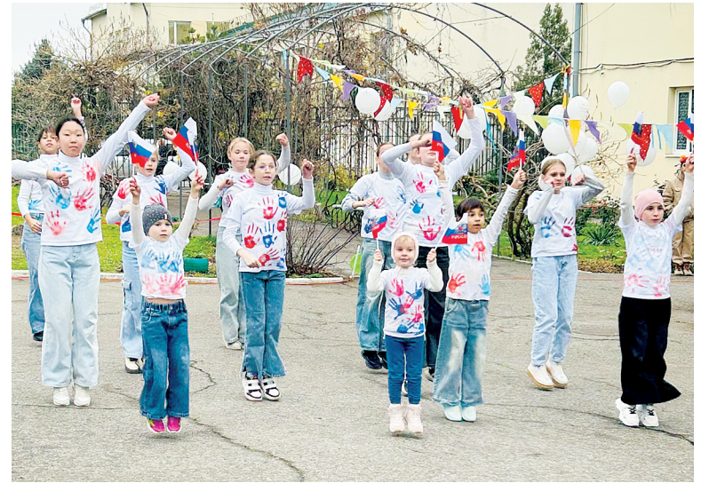
Коллектив «Азарт» с танцем «Сила поколения».

– Действительно, букмекерские компании играют значительную роль в финансировании спорта. Только за 2024 год они перечислили в государственный бюджет более 35 миллиардов рублей. Важно отметить, что эти