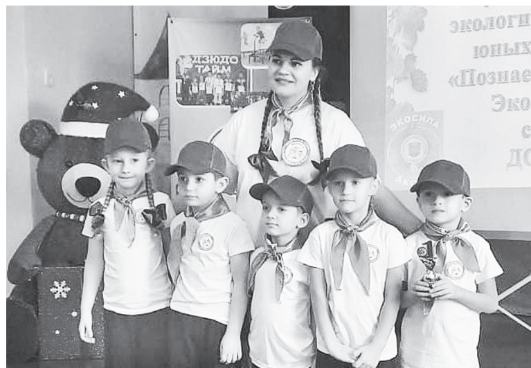
Первое место занял отряд «Экологический патруль» детского сада «Сказка».

Мероприятие состоялось 19 ноября и стало настоящим праздником экологии и вдохновения. Оно объединило юные сердца, заинтересованные жизнью нашей планеты, красотой ее лесов и полей, заботой о будущем поколении. Педагоги Центра