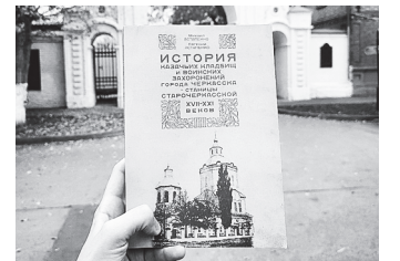
Уникальная книга.