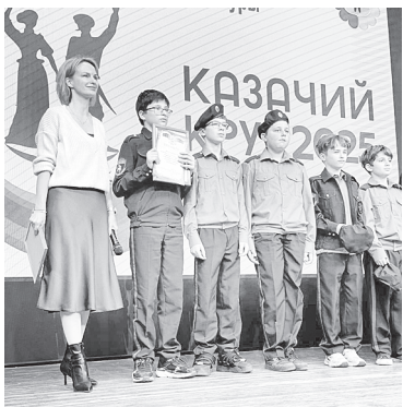
Победителей определили по возрастным категориям, вручив награды лучшим командам.

Теплым ноябрьским днем, словно оживляя страницы учебника истории, пять аксайских школ открыли первую страницу своего общего дела – районного фестиваля «Казачий круг 2025». Яркое событие дало мощный импульс