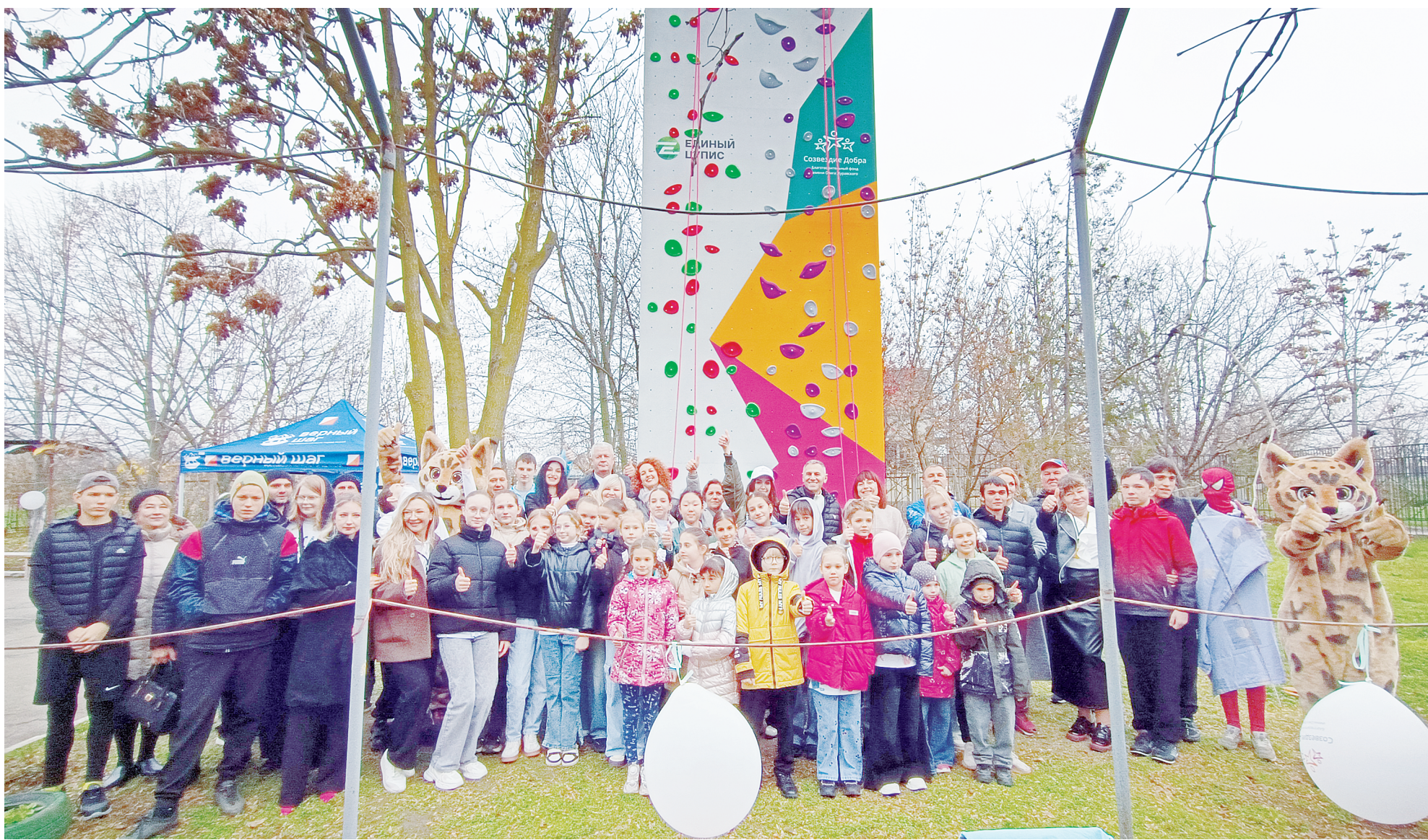
Участники праздника открытия скалодрома на территории Большелогского Центра помощи детям.

мекерская компания «Лига Ставок» и благотворительный фонд «Созвездие добра» имени Олега Журавского. Программа возникла в 2020 году и стала закономерным продолжением всей деятельности обеих организаций. По этой программе мы строим объекты спортивной инфраструктуры для детей в трудной жизненной ситуации, для детей-сирот, которые проживают в детских домах и социально-реабилитационных центрах. Мы также заботимся о спортсменах разных поколений, а еще поддерживаем юных талантливых спортсменов, которые получают стипендиальную поддержку для занятий спортом. Вот такие три основных направления у этой программы: спортивная инфраструктура, забота о спортсменах старшего поколения и поддержка юных