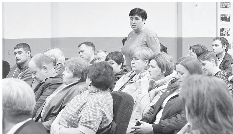
Жительница Верхнеподпольненского поселения задает вопрос.

А жители Ленинского поселения пожаловались главе на систематические нарушения графика движения автобуса № 510 «Дивный – Батайск», а также на неудовлетворительное санитарное состояние автобусов. Маршрут является межмуниципальным и находится в ведении Министерства транспорта Ростовской области.