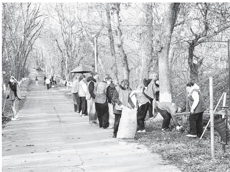
Субботник в разгаре.