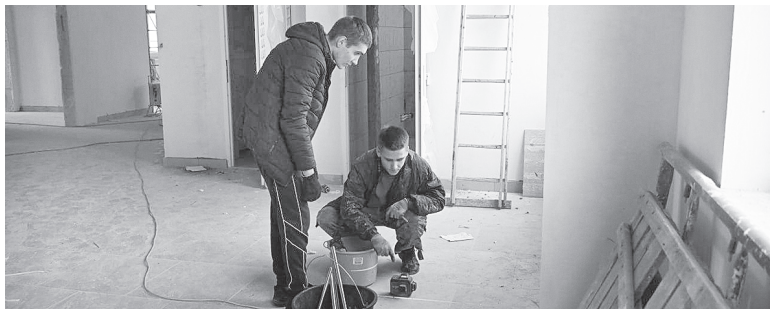
На объекте строящейся школы.

лиц подрядной организации, действия рабочих по разным направлениям плохо скоординированы. Буду продолжать еженедельно лично контролировать ход работ на объекте, – прокомментировал выездное совещание К.С. Доморовский.