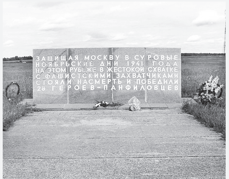
Мемориал в Дубосеково.