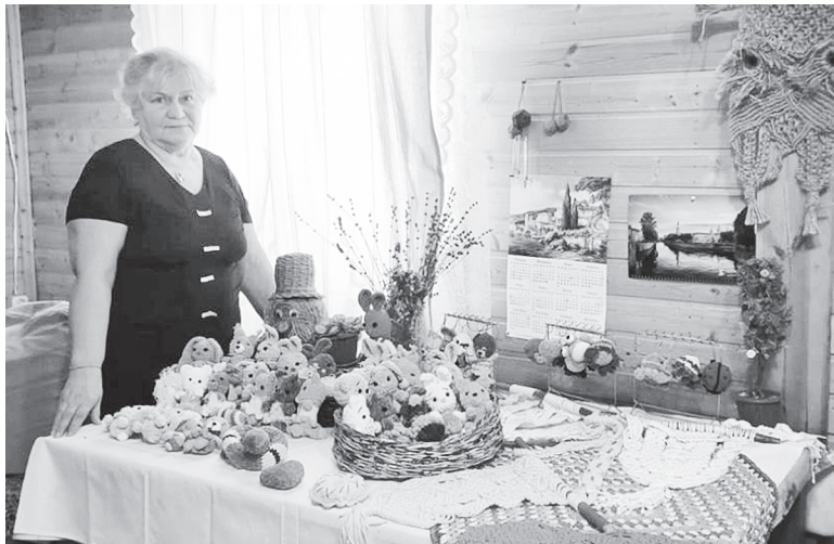
Творчество – это огромный стимул для развития и возможность заявить окружающим о себе и своем внутреннем мире.

«обычных» – все мы просто творцы, каждый со своим стилем».