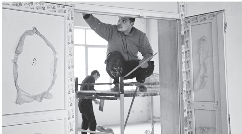
Продолжаются отделочные работы.

Продолжаются отделочные работы: покраска стен, монтаж потолков, дверей, светильников. Поставил задачу в срок до 29 ноября завершить работу по монтажу слаботочных систем на четвертом этаже основного здания. Основные