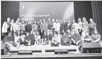
Делегация Аксайского района.

22 ноября в донской столице на базе школы № 155 им. Ю.А. Жданова состоялся ежегодный региональный форум «Мы в Движении», собравший самых инициативных школьников Ростовской области. Региональный форум собрал сотни активистов.