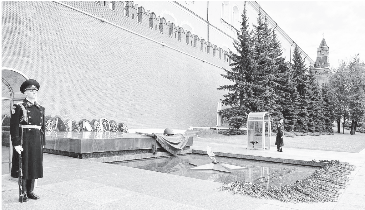
Мои́ла Неи́звестного́ Солдата.

ДЕНЬ НЕИЗВЕСТНОГО СОЛДАТА ОТМЕЧАЮТ КАЖДЫЙ ГОД 3 ДЕКАБРЯ