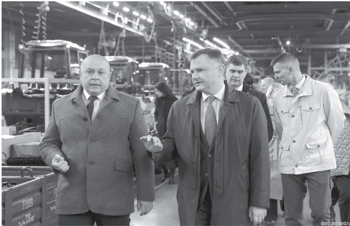
Донской губернатор уверен, что кооперация донских и белорусских предприятий пойдет на пользу экономике

паний подписали соглашения о сотрудничестве: «Каменскимволокно» и белорусские предприятия «Светлогорскимволокно» и «Витебские ковры», «Волгодонский завод металлургического и энергетического оборудования» и «Белорусская металлургическая компания». Обновили дорожную карту взаимодействия предприятия «Сальксельмаш» и «Минский тракторный завод». О совместной работе они договорились ранее, в сентябре, на международной промышленной выставке «Иннопром. Беларусь».