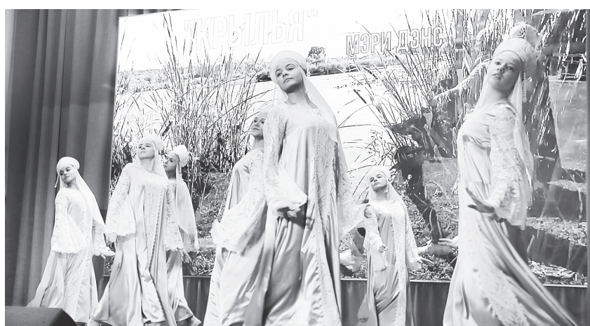
«Мэри Дэнс» – «Крылья».