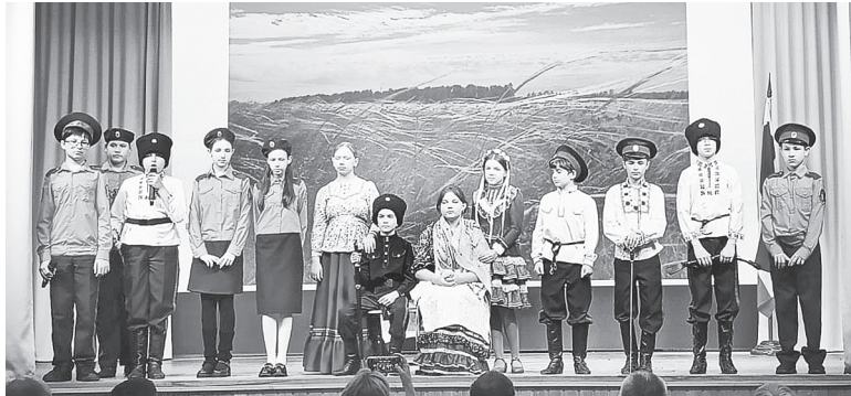
Выступления команд классов со статусом «казачий», полные таланта и вдохновения, покорили зрителей.

развитию культурного наследия родного края среди школьников.