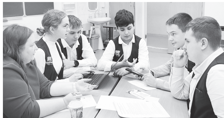
В мероприятии участвовали свыше 600 школьников.

В игре «Город бизнеса» первое место заняла команда школы