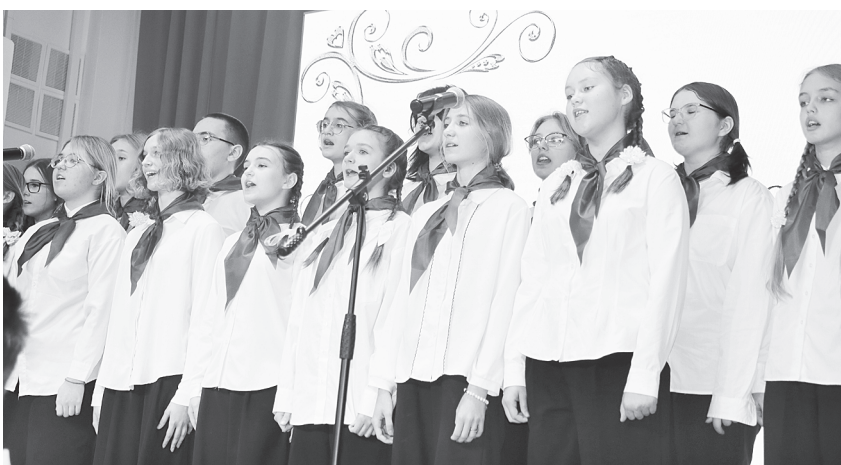
Сводный хор Аксайской школы № 2.

потому что на выделенные школе деньги за последние годы были выполнены самые разные виды работ, С.В. Рожкову, потому что дело его рук – обновленные беговые дорожки на стадионе и обновленное асфальтовое покрытие перед входом в начальную школу. Огромное спасибо всем нашим детям! Сегодня все вы увидели, какие они замечательные и талантливые. С юбилеем, дорогая школа номер два!».