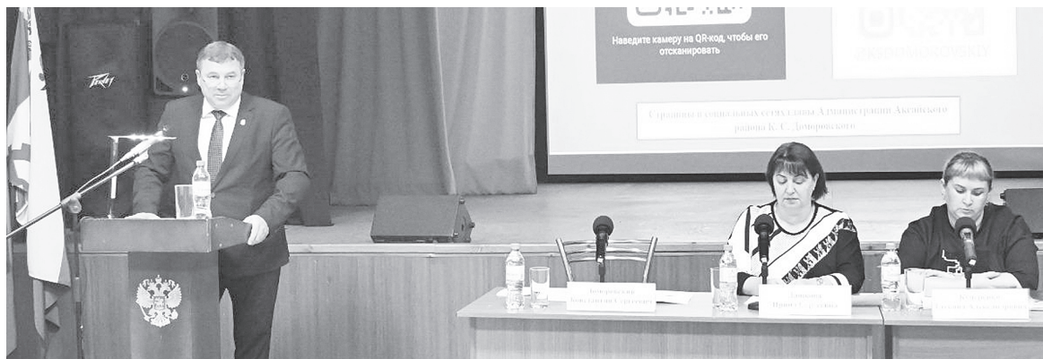
Доклад главы Администрации Аксайского района в Верхнеподпольненском сельском поселении.

Еще один из проблемных вопросов для сельских жителей – в связи с отсутствием сотрудника не работает почтовое отделение, из-за чего сложно получать квитанции на оплату жилищно-комму-