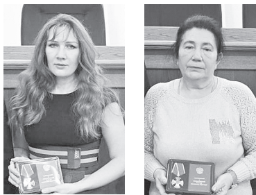
Вручение медалей семьям погибших.