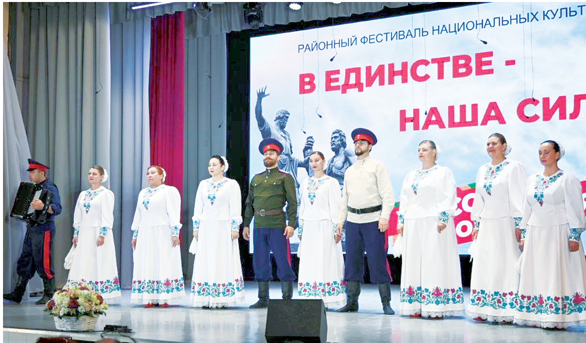
Концерт «Песни и танцы народов России» открывает творческий коллектив «Станичники».

Россия – страна дивных просторов и безграничного вели-