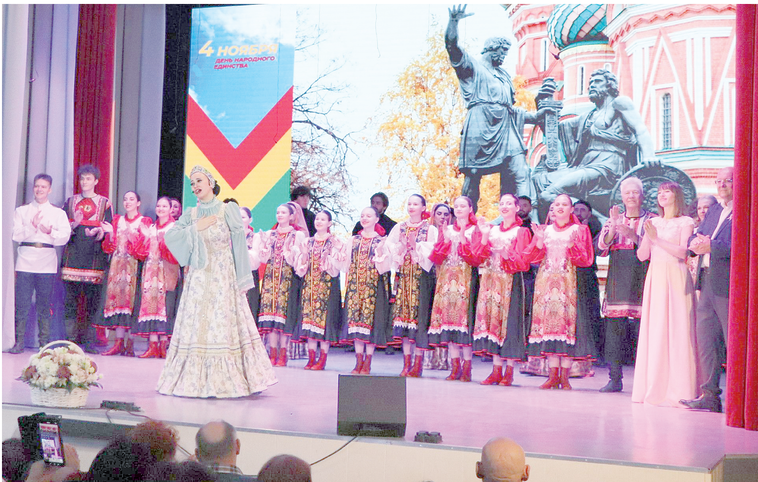
Праздничный концерт

В ПРЕДДВЕРИИ ДНЯ НАРОДНОГО ЕДИНСТВА В РДК «ФАКЕЛ» СОСТОЯЛСЯ ТРАДИЦИОННЫЙ ФЕСТИВАЛЬ НАРОДНЫХ КУЛЬТУР