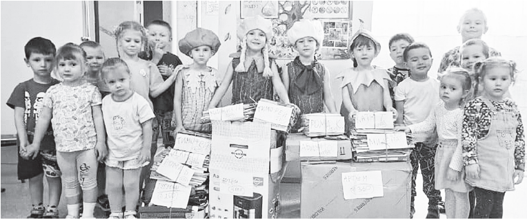
Детский сад «Теремок», 6 экоотряд «Птички-невелички».

Распределение мест и призовые категории стали частью образовательного процесса, позволяя детям и педагогам осознанно оценивать свои результаты, анализировать пути улучшения и учиться честной соревновательности в рамках доброжелательного экологического движения. Финальные