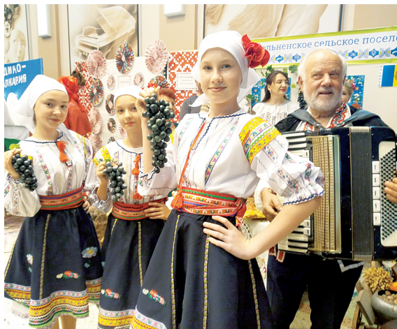
Национальные уголки фестиваля.

Я хочу пожелать всем здоровья, мира, добра. Всем нашим ребятам, которые воюют и бьют врага в ходе специальной военной операции, вернуться поскорее с победой к своим семьям. А тем, кто присутствует в этом зале, получить теплые впечатления от замечательных выступлений артистов, которые будут выходить на сцену.»