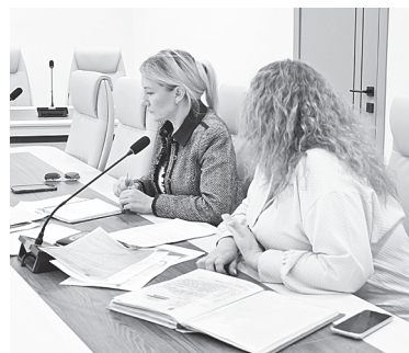
Все вопросы на контроле у главы.

Ранее жители уже обращались в администрацию с жалобой на незаконно установленный шлагбаум, который ограничивает проезд к их домовладениям.