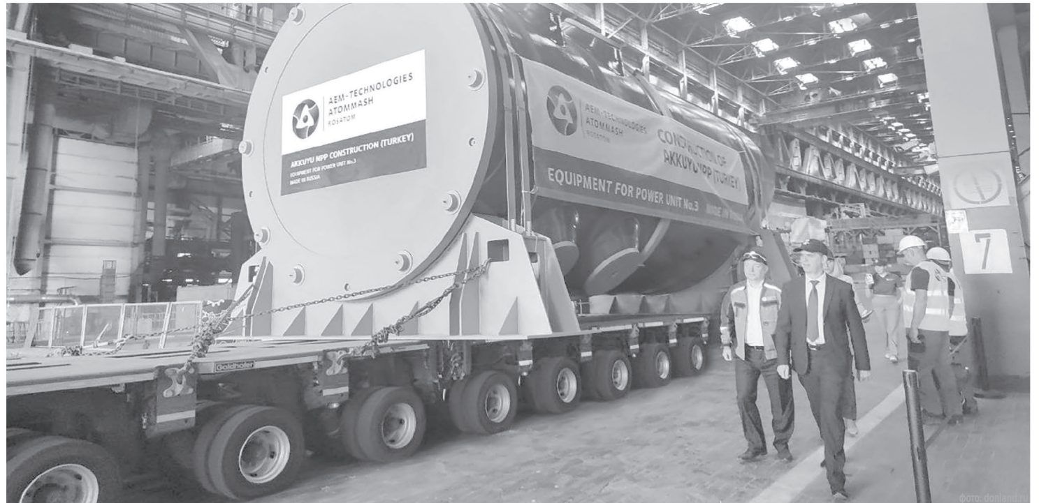
Промышленные предприятия Ростовской области выпускают уникальную продукцию, востребованную как в России, так и далеко за рубежом нашей родины

На завершающем этапе – инвестиционный импортозамещающий проект по расширению производства легкосплавных дисков «Азов-ТЭК», запуск запланирован на 4 квартал 2025 года. «Ростовский трубный завод» на своей дополнительной площадке в Аксайском районе начал выпуск полиэтиленовых труб в тестовом режиме, здесь уже завершены строительно-монтажные работы складского блока, монтаж четырех производственных линий, аккредитована лаборатория. «НЭВЗ» запланировал масштабную модернизацию производства, что позволит увеличить объемы выпуска электровозов, также в планах – разработка новых видов техники.