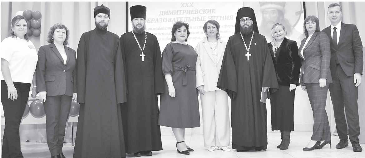
Участники конференции.

В АКСАЙСКОМ РАЙОНЕ ПРОШЛИ XXX ДИМИТРИЕВСКИЕ ОБРАЗОВАТЕЛЬНЫЕ ЧТЕНИЯ