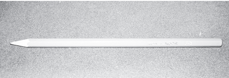
Карандаш простой «КОН – I – NOOR».

КАРАНДАШ ИЗВЕСТЕН КАЖДОМУ С САМОГО РАННЕГО ДЕТСТВА