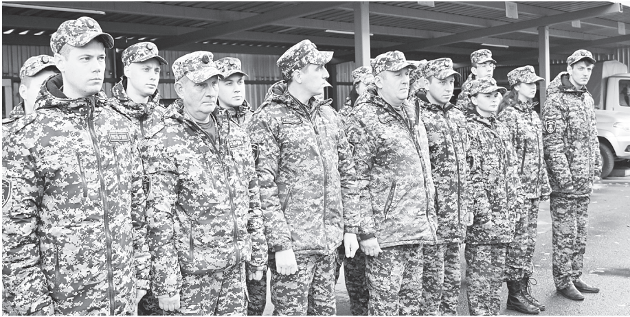
Сотрудники Отдела вневедомственной охраны по Аксайскому району.