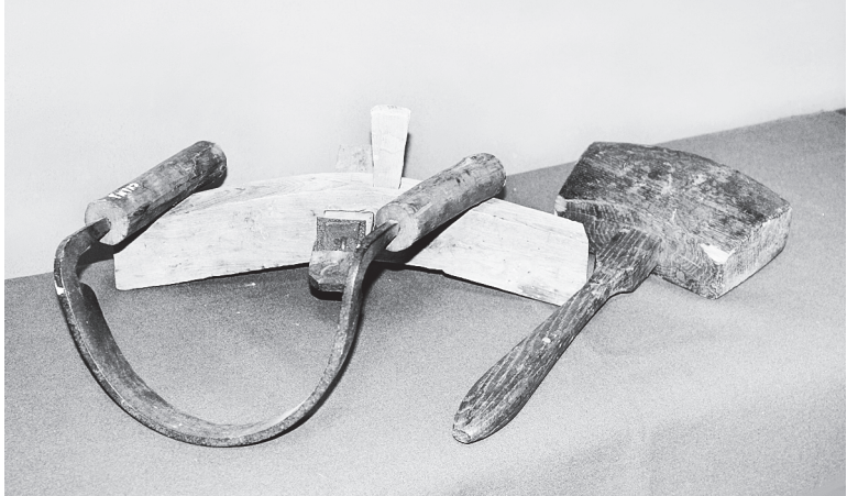
Инструмент бондаря: шкловка, уторник, киянка, начало XX века.