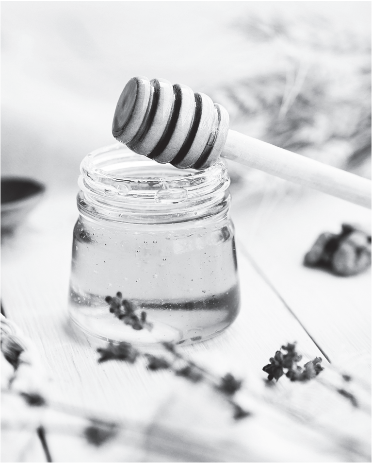
Состав, вкус и цвет различного меда зависят от вида растительного источника, географического района, климата и разных видов пчел, участвующих в производстве меда, а также обусловлены методами обработки и хранения.

Гречишный мед имеет уникальный состав с полезными свойствами. Здесь много минералов – кальция, фосфора, железа, калия. Эти микроэлементы