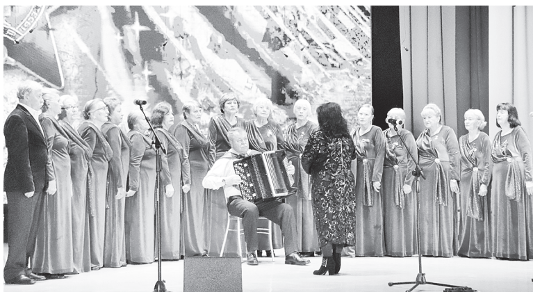
На сцене – «Криницы».