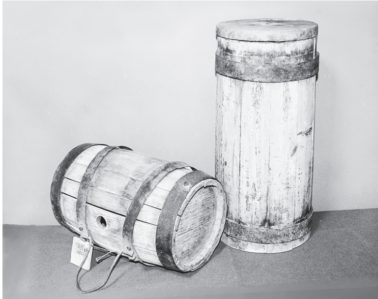
Бочонок под воду и маслобойка, начало XX века.

В изделиях хранили и перевозили все – от напитков до сыпучих продуктов. Эта профессия была очень распространенной и в довоенные, послевоенные годы. Деревянные бочки были необходимы для заготовки солений, засолки рыбы, при производстве вина, коньяка и т.д. В быту, в домашнем обиходе использовалась столовая посуда из дерева – жбаны, кружки, медовницы, стаканы, блюда, миски и корыта. Подобную посуду хозяйки предпочитали глиняной. Ценились не только ее прочность и долговечность, но и особые качества бондарных изделий. Испокон веков лучшим материалом для бондарных изделий считался дуб. В дубовой квашне быстрее подходило тесто. Яблоки, замоченные в дубовых кадках, до весны оставались крепкими и вкусными. Огурцы, засоленные в дубовой бочке, получались хрустящими. Но для малосольных огурцов больше подходили кленовые бочонки – клен «оттягивает» соль. Молочные продукты