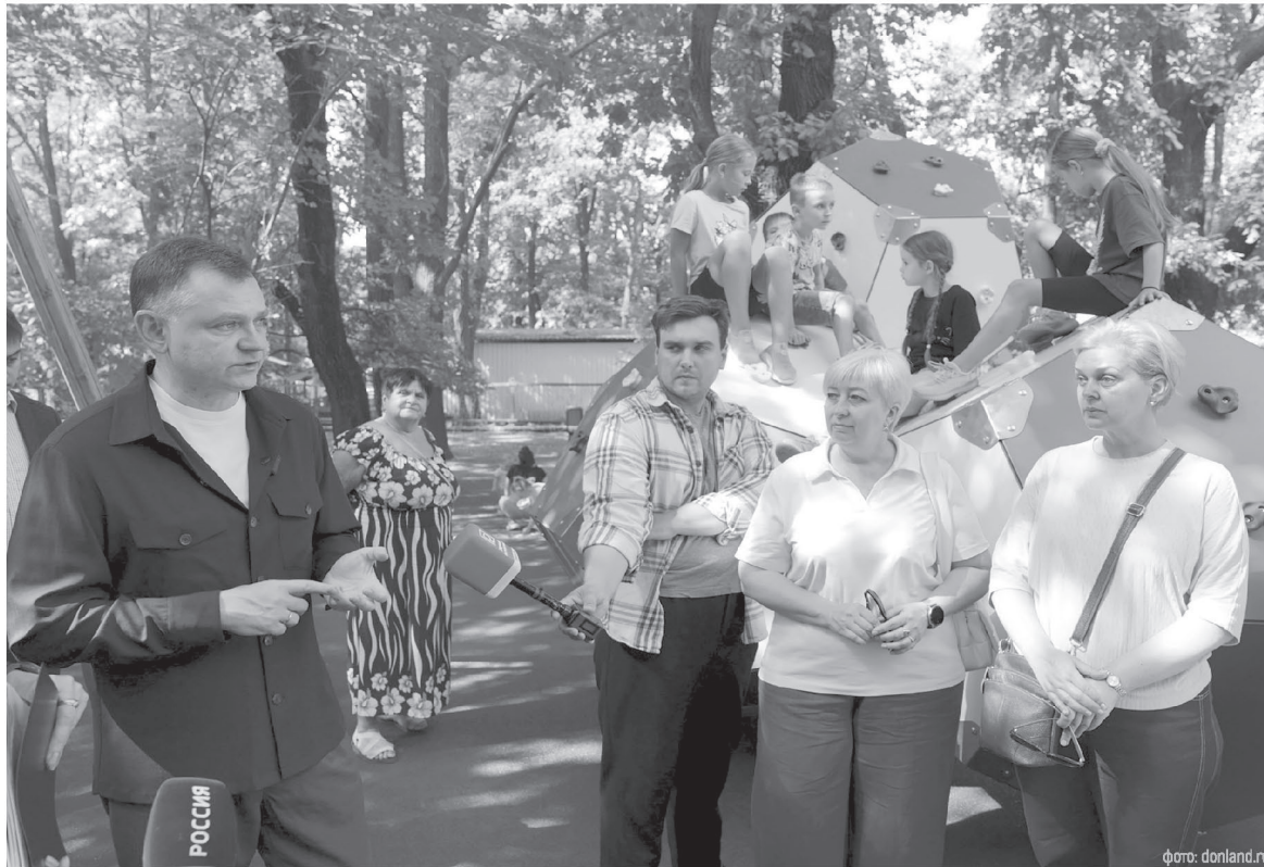
Губернатору удалось выстроить диалог с жителями региона: в личном общении, через соцсети и интерактивные приемы. Это помогает более эффективно работать и своевременно реагировать на проблемы