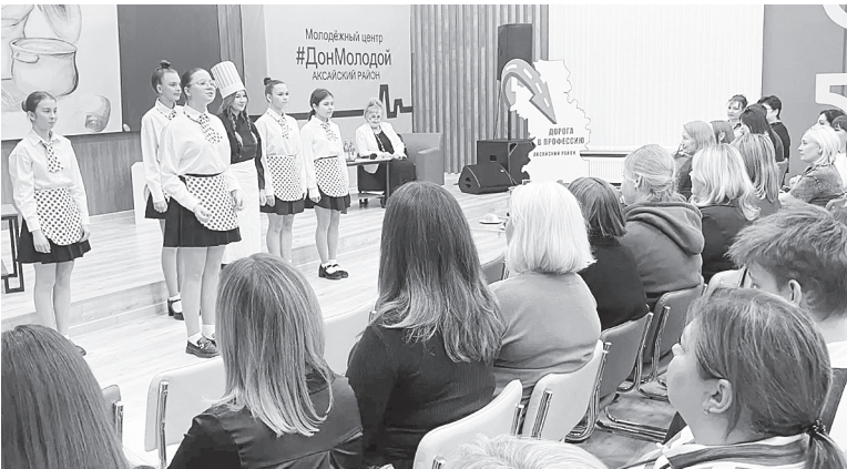
Команда Октябрьской СОШ.

Начальник Управления социальной защиты населения Администрации Аксайского района Ю.Н. Семикова рассказала родителям и