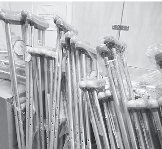
Передача средств реабилитации.

Технические средства реабилитации по обращению Администрации Аксайского района и Аксайского городского поселения приобрели на средства инвестора – АО «Судостроительный-судоремонтный завод «Мидель».