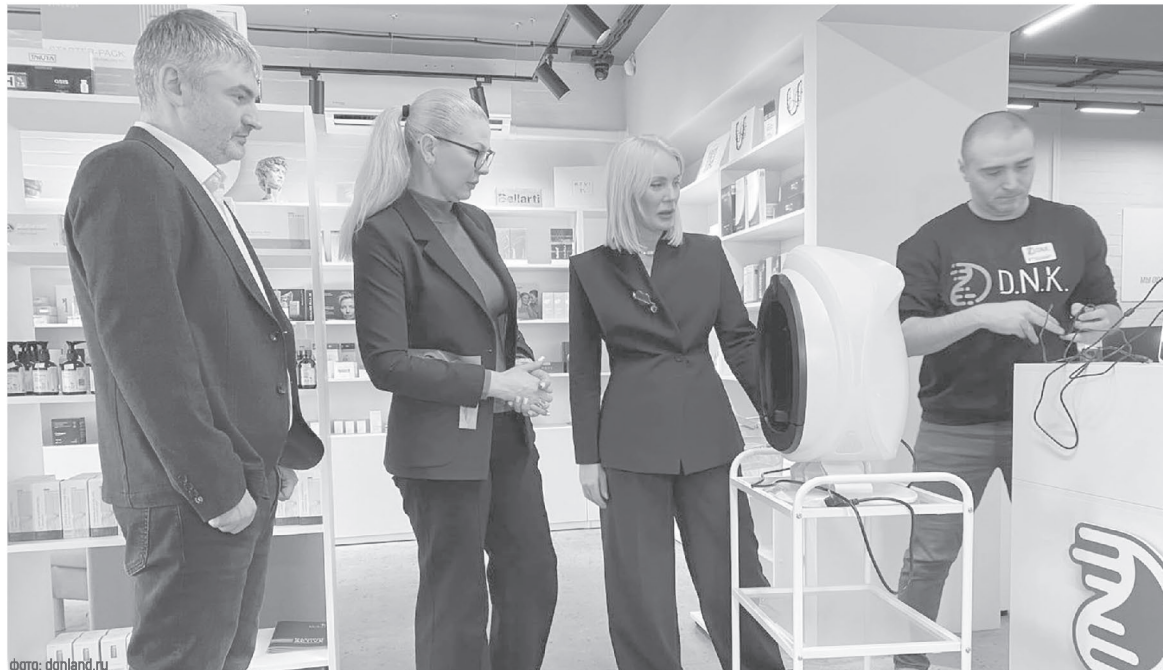
В Ростовской области проводятся проверки товаров различной категории. Лучшие производители не только подтверждают качество товаров, но и становятся обладателями знака «Сделано на Дону»

По итогам работы десяти таких приемных в 2025 году было проконсультировано более 3 тысяч человек, подготовлено около 340 претензий. Во внесудебном порядке урегулировано споров на сумму около 3,6 млн рублей, сумма начисленных штрафных санкций по исковым заявлениям