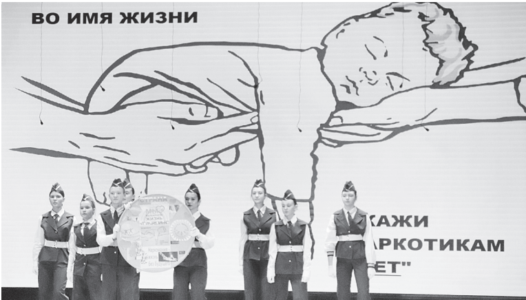
Творческие коллективы учреждений культуры Аксайского района продемонстрировали тематические агитационно-культурные программы.