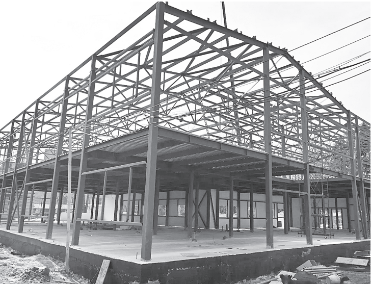
Строящийся корпус.