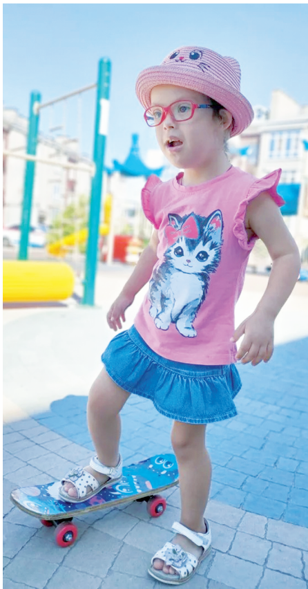
На детской площадке.