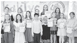
Пианистки заняли призовые места.

Учащиеся Детской музыкальной школы станицы Ольгинской успешно выступили на Международном многожанровом фестивале искусств «Кактус».