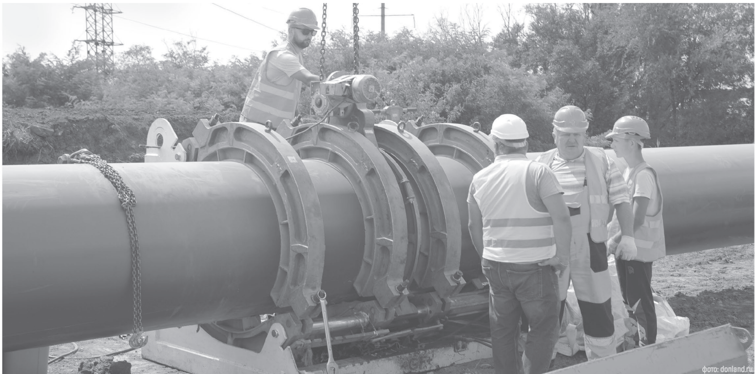
Основная задача сферы ЖКХ в 2026 году – повышение комфорта жителей региона, а новой стратегией должен стать отказ от практики «латания дыр»

По мнению губернатора, несмотря на сложности, в прошлом году удалось достичь конкретных и заметных результатов в сфе-