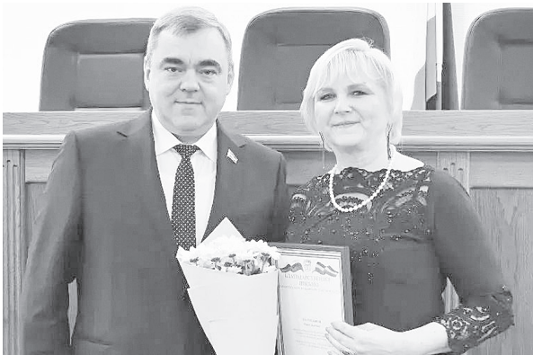
И.П. Пустошкина.