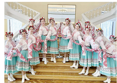
Ансамбль «Времена года».

Ансамбль народного танца покорил жюри международного конкурса.