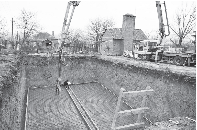
Контроль за выполнением работ осуществляется еженедельно.