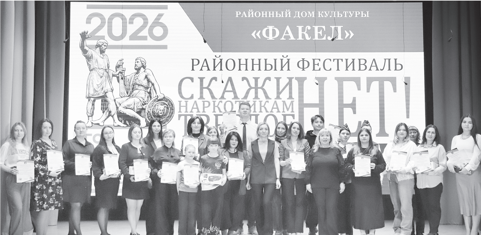
Участники районного фестиваля.