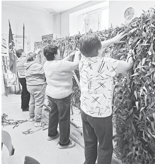
За все время работы волонтеры сплели порядка 180 сетей.

АКСАЙ – МЕСТО ОБЪЕДИНЕНИЯ ДЛЯ ПОМОЩИ ФРОНТУ