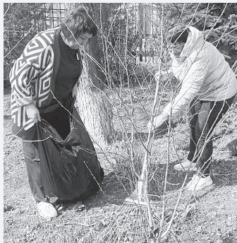
Уборка сухой травы.

Приведение в порядок парка, как и всей больничной территории ЦРБ Аксайского района, особенно актуальное после проводов зимы, традиционно прошло в субботу 21 марта в рамках весеннего ме-