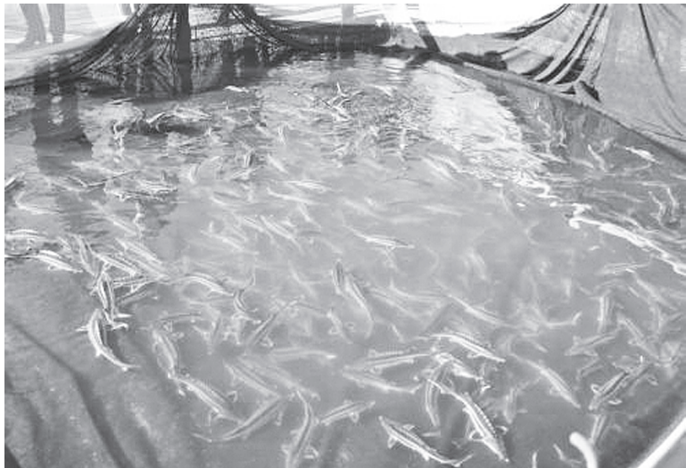
Выпуск молоди в естественные водоемы региона.

На улучшение состояния рыбного хозяйства Ростовской области направлена и дорожная карта по оздоровлению и развитию водохозяйственного комплекса реки Дон. В частности, предусмотрена реконструкция Донского