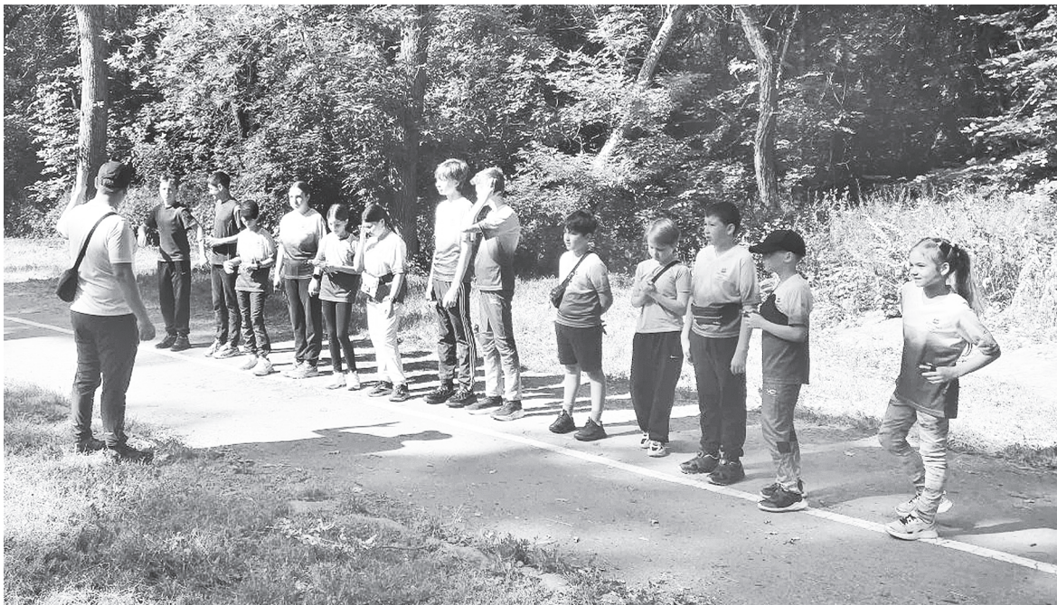
Для тренировки выбрали лесной массив парка Авиаторов в Ростове.