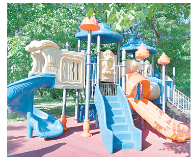
В.В. Абрамченко на выездном совещании в городе Аксае.