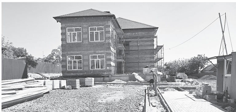
Выездное совещание.