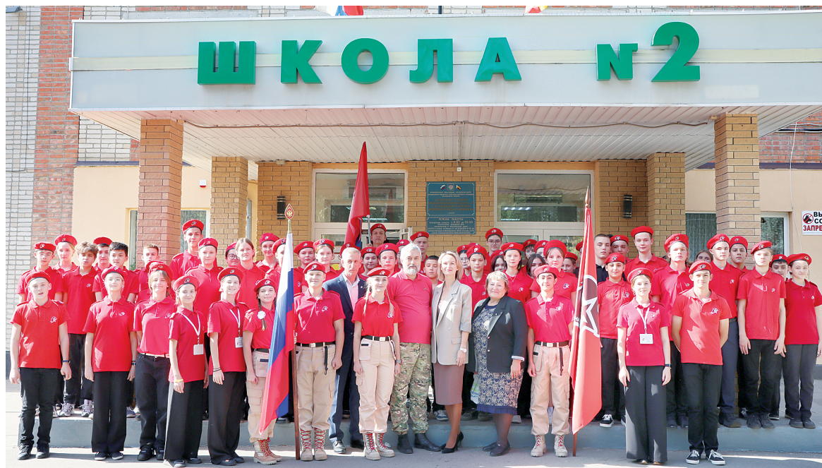
Праздничная линейка, посвященная присвоению школе статуса «Дом Юнармии».