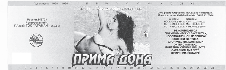
Этикетки минеральной воды, ставшие экспонатами АВИМ.