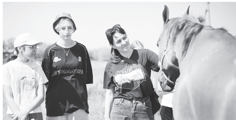
Организаторами была подготовлена насыщенная программа.