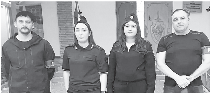
Добровольная народная дружина города Аксая.

После сделанных замечаний нарушители устраняют их. Но есть и те, кого доставляют в отдел полиции для составления протоколов.