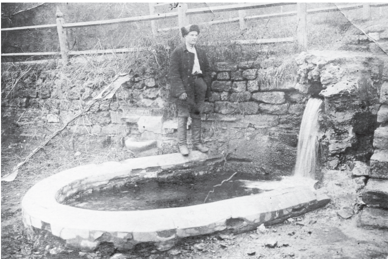
Бювет источника. Аксайский нарзан. 1930 год.