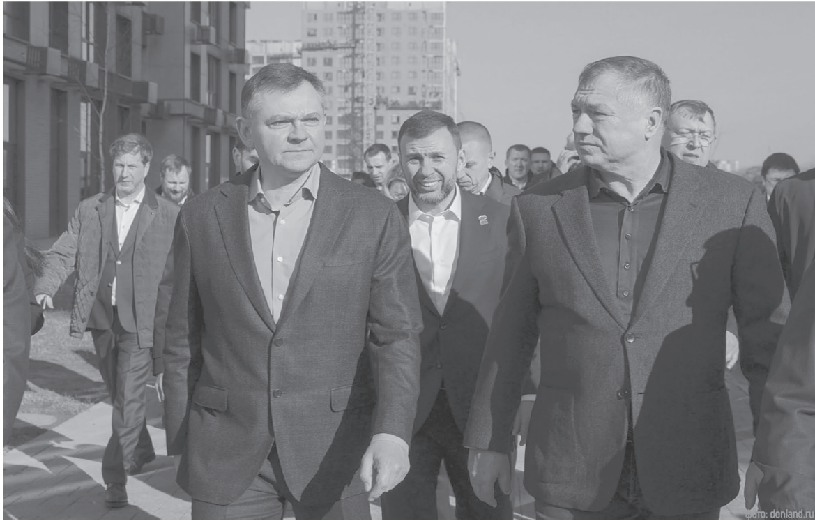
Ростовская область активно сотрудничает с федеральным центром в сфере реализации крупных инфраструктурных и строительных проектов

Достижениями и перспективами может похвастать строи-