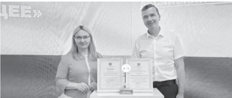
Награду вручают А.К. Кучеренко.

Проект помогает школьникам осознанно выбирать профессию с учетом потребностей региона.