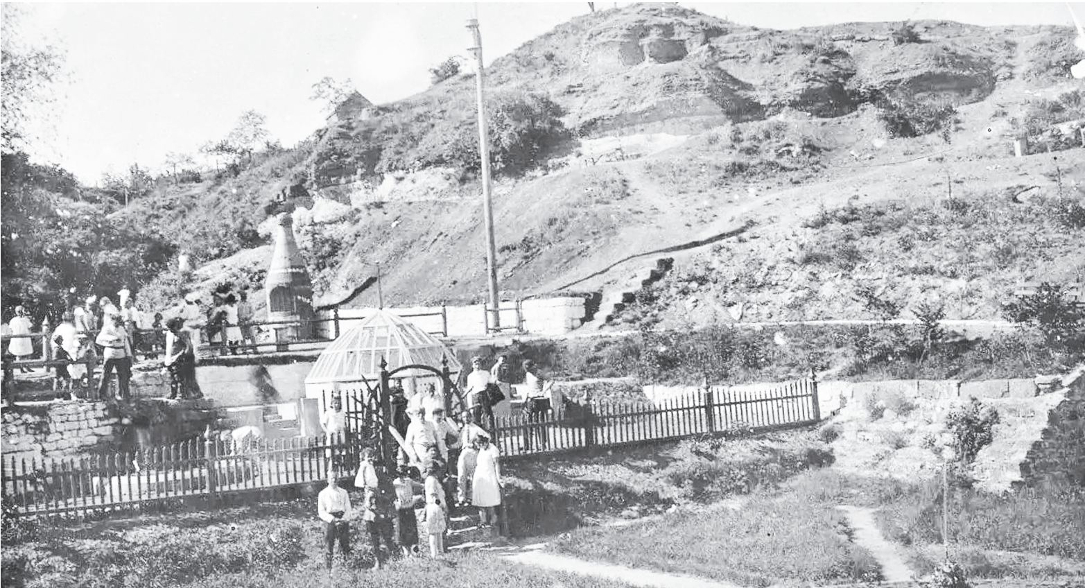
Семья Поповых на фоне источника минеральной воды в ст. Аксайской. 1928 год, РОМК КП 234 484.

Первыми на целебные свойства воды источника в Аксае жители обратили вни-