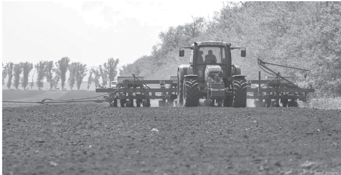
Сельхозпроизводство для Ростовской области остается одной из главных отраслей

Ростовская область – один из ведущих экспортеров России с долей около 12% и географией поставок более чем в 100 стран. Юрий Слюсарь подчеркнул, что в 2025 году наметился рост экспорта продукции переработки: мяса птицы, сыров, творога, муки. Чтобы поддержать эту тенден-