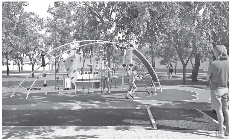
Слайды презентации с визуализацией проекта – так будет выглядеть территория после благоустройства.

нии действительно удобных и безопасных пространств, где люди хотят проводить время – гулять с детьми, встречаться с друзьями, заниматься спортом или просто отдыхать.