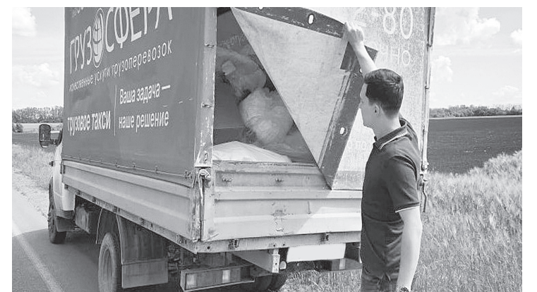
С начала года проведен 21 рейд, составлено 79 протоколов в отношении нарушителей.