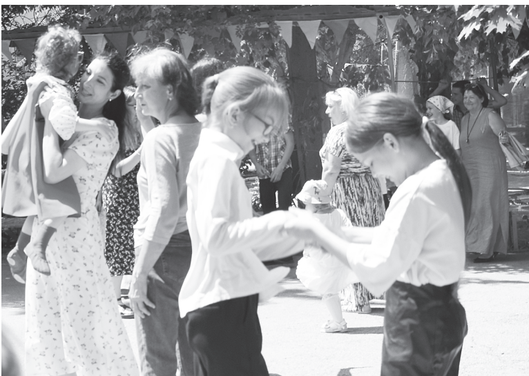
Организаторами была подготовлена насыщенная программа.