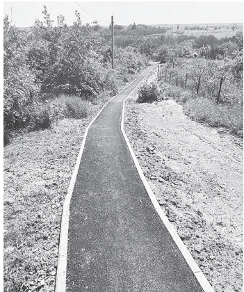
Ремонт тротуара.

Обновленный тротуар обеспечит безопасный проход к центральной улице станицы, где