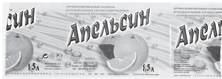
Этикетки минеральной воды, ставшие экспонатами АВИМ.