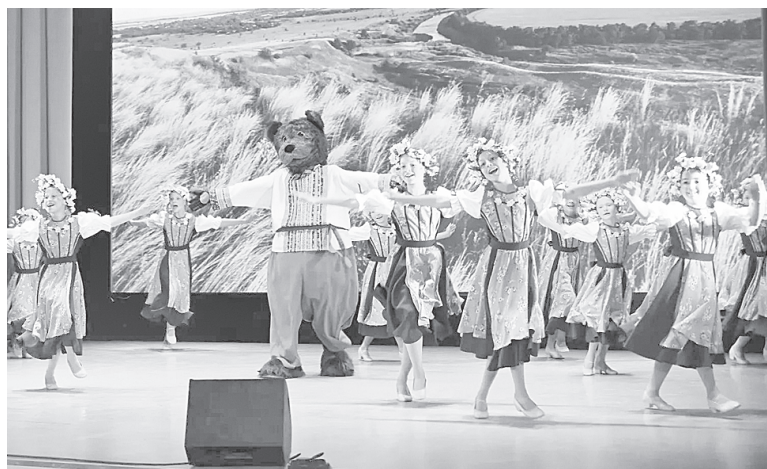
Концертные номера на сцене районного Дома культуры «Факел».