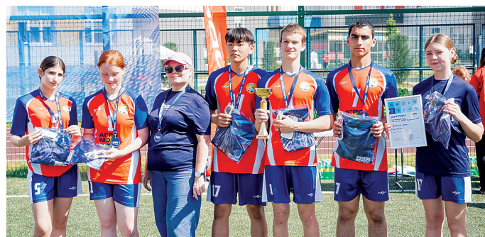
Аксайский район стал рекордсменом по количеству первых мест в муниципальном образовании.

Уже этой осенью команды, занявшие первые места в своих категориях, отправятся представлять Ростовскую область на всероссийском финале «Вызова Первых»