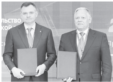
Ю.Б. Слюсарь и В.П. Петушенко.

4 июня на Петербургском международном экономическом форуме-2026 подписано соглашение о сотрудничестве между Ростовской областью и госкомпанией «Автодор». Подписи под документом поставили Губернатор Ю.Б. Слюсарь и председатель правления госкомпании В.П. Петушенко.