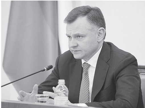
Ю.Б. Слюсарь.

ГРАДОСТРОИТЕЛЬНЫЙ СОВЕТ ПОДДЕРЖАЛ ПРОЕКТЫ ДАЛЬНЕЙШЕГО БЛАГОУСТРОЙСТВА И ОЗЕЛЕНЕНИЯ ОБЩЕСТВЕННЫХ ПРОСТРАНСТВ РОСТОВА