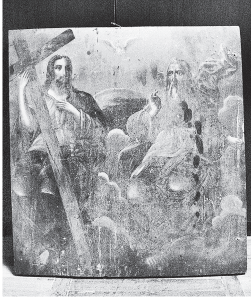
Икона «Троица» (Новозаветная). Россия, кон. XIX в.

В День Святой Троицы торжественная служба проходит по особому праздничному чину. После литургии следует вечерня, во время которой славят сошествие Святого духа и читают три специальных молитвы. И праздник этот считают днем рождения церкви. Во всех православных храмах священнослужители на Троицу надевают одеяния зеленого цвета. В день Пятидесятницы в храмах совершается одна из самых краси-