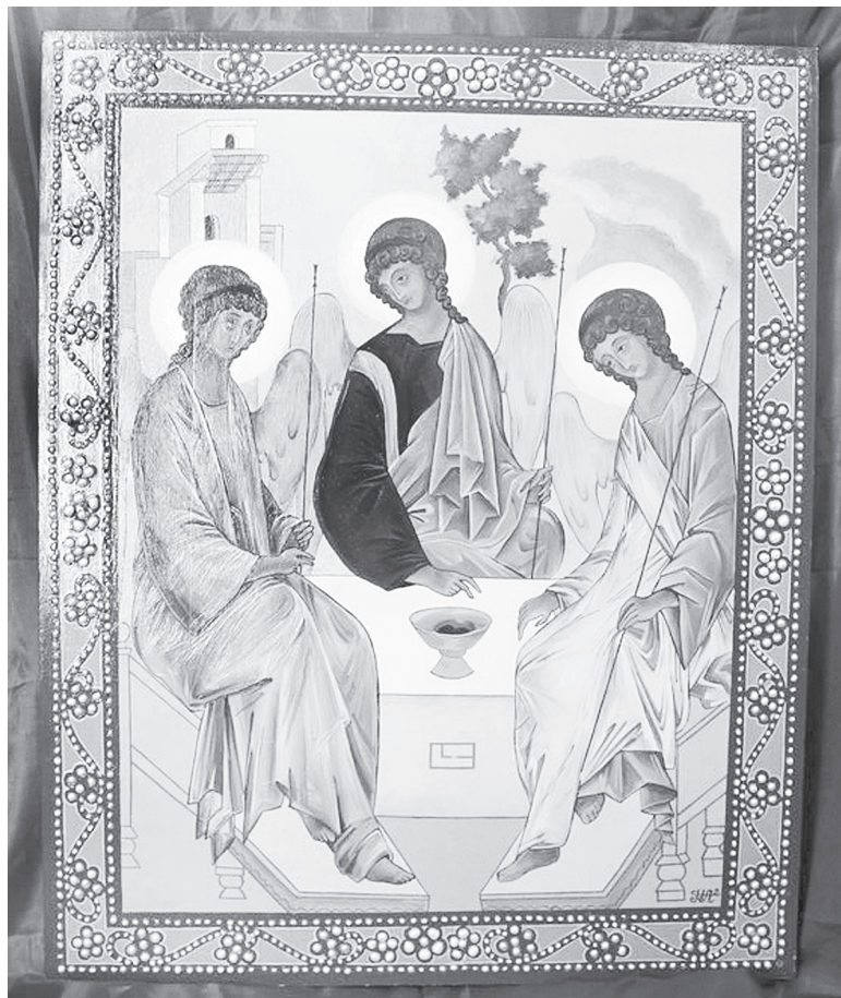
Икона «Троица» (Ветхозаветная). Россия, кон. XX в.

Троица считалась девичьим праздником. Такие обряды, как заплетание венков, гадание на венки, обряд «кумления», проводились без присутствия мужчин. Девушки наряжались в самые лучшие наряды и шли в левяду или сад. С собой брали угощения. Проводили совместную трапезу.