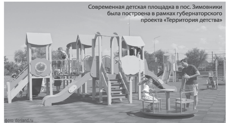
Современная детская площадка в пос. Зимовники была построена в рамках губернаторского проекта «Территория детства»

Глава региона также отметил, что все объекты, на которых он побывал, имеют большое значение для сельских территорий – позволяют детям учиться, заниматься спортом, обеспечивают досуг и комфортную жизнь семьям. Решение кадровых вопросов в медицине, сфере ЖКХ и благоустройства способно заметно улучшить качество жизни на селе.