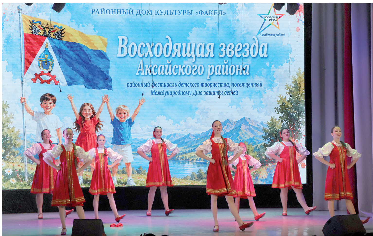
Юные артисты представили зрителям богатое разнообразие жанров и стилей.

В РАЙОННОМ ДОМЕ КУЛЬТУРЫ «ФАКЕЛ» ПРОШЕЛ ФЕСТИВАЛЬ «ВОСХОДЯЩАЯ ЗВЕЗДА АКСАЙСКОГО РАЙОНА»