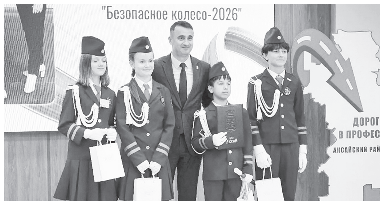
Команда юных инспекторов дорожного движения «ЗУМ» средней школы № 4 города Аксая – призер регионального этапа Всероссийского смотр-конкурса «Безопасное колесо – 2026».