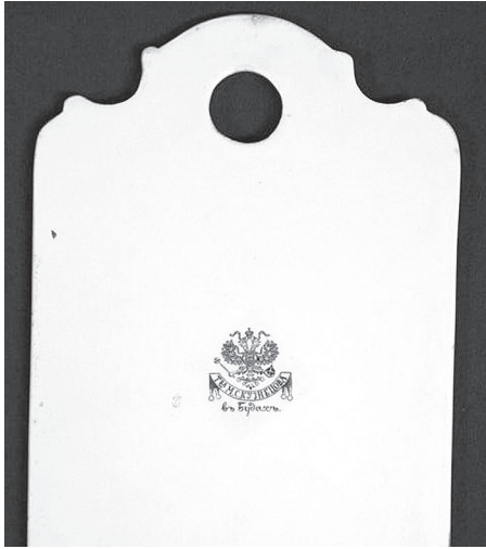
Сырные доски, конец XIX-начало XX в. Из фондов Старочеркасского музея-заповедника.

представители высшего сословия, стремившиеся перенять европейские обычаи.