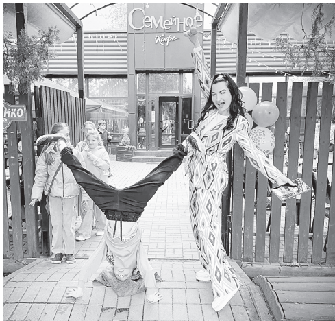
Праздник удался!

Сладкое настроение обеспечили более 300 порций мороженого, а дружная компания с удовольствием угостилась 21 порцией горячей пиццы. Заряд витаминов дали 12 кг спелой клубники и 10 кг других сочных фруктов – настоящее летнее изобилие для растущих организмов. Но самым ценным, конечно, стали миллионы искренних детских улыбок – именно они стали главным итогом праздника. Особую благодарность организаторы выражают спонсорам, которые разделили радость этого дня и помогли сделать его по-настоящему запоминающимся: магазину мясной и молочной продукции (ул. Платова, 83, Ж) и пекарне Морозовых. Родители отмечали, что такие мероприятия невероятно важны: они дарят детям ощущение волшебства, позволяют забыть о заботах и