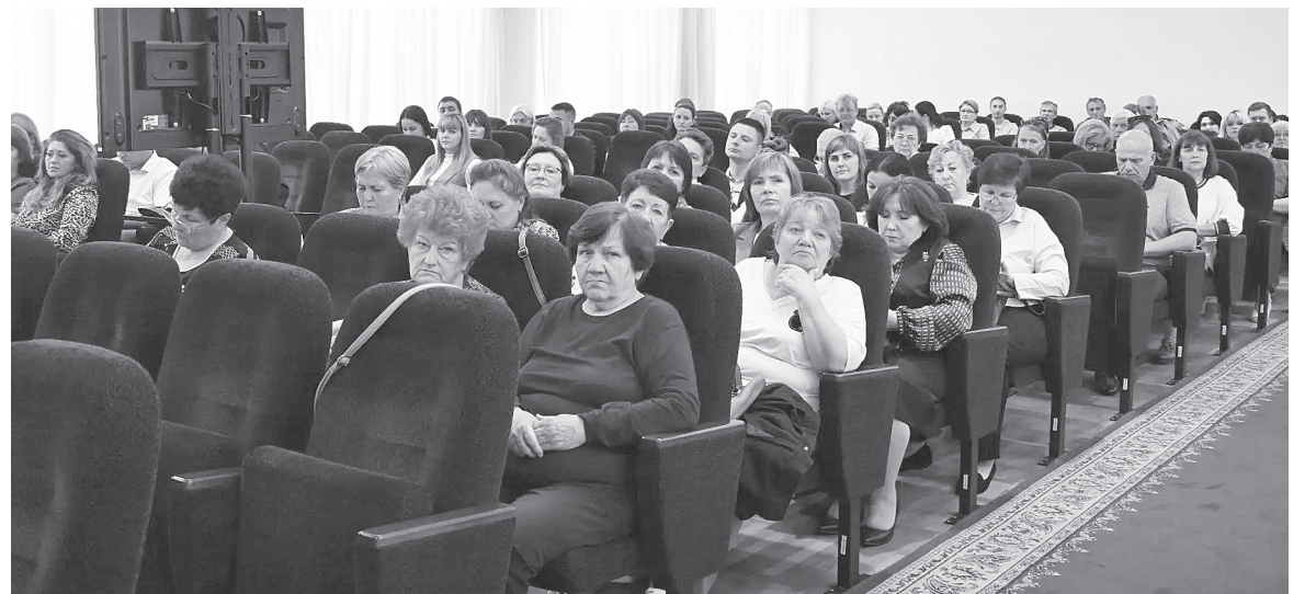
Идет заседание районной комиссии.

Руководитель предприятия попросил глав поселений провести разъяснительную работу с жителями и предупредить их о недопустимости высадки высоких деревьев в охранной зоне линий электропередачи.