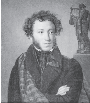
А.С. Пушкин.