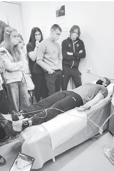
Профориентационная экскурсия в Аксайскую ЦРБ.

Филиал ФБУЗ «Центр гигиены и эпидемиологии в Ростовской области» в г. Ростове-на-Дону