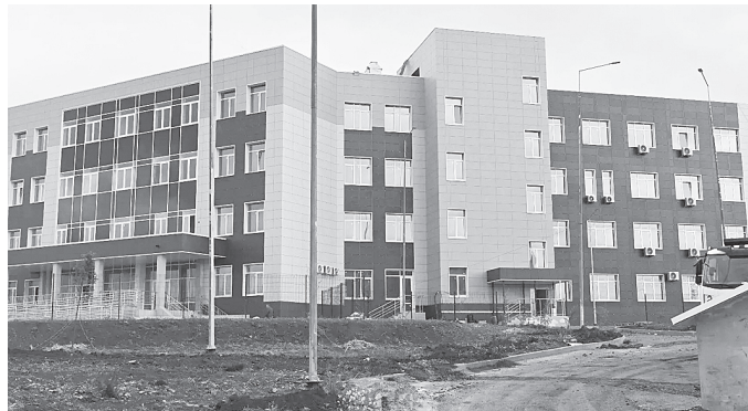
Строящиеся объекты в городе Аксае.

По состоянию на 28 мая на объекте строящейся школы завершается выполнение следующих видов работ: установка светильников, выключателей, розеток и датчиков пожарной сигнализации, разводка сетей тепло-