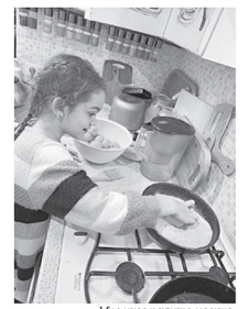
Мы уже к ним можно

В моей семье готовят разные блюда русской и армянской кухни. Я очень люблю помогать маме с готовкой: мы с ней печем