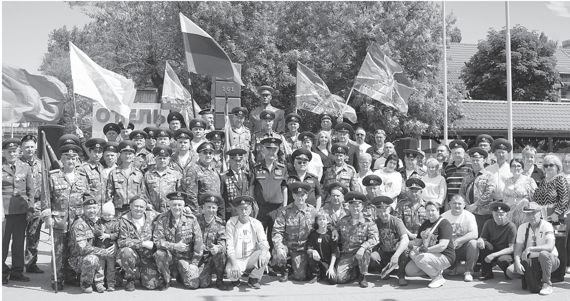
Участники митинга.

Завершился митинг минутой молчания в память о пограничниках, отдавших жизнь при выполнении воинского долга. Собравшиеся склонили головы, отдавая дань уважения героям, а затем возложили цветы к мемориалу. Этот жест стал символом живой связи времен: память о подвигах предков вдохновляет нынешних стражей границы и напоминает всем нам, как важно беречь мир и безопасность родной земли.