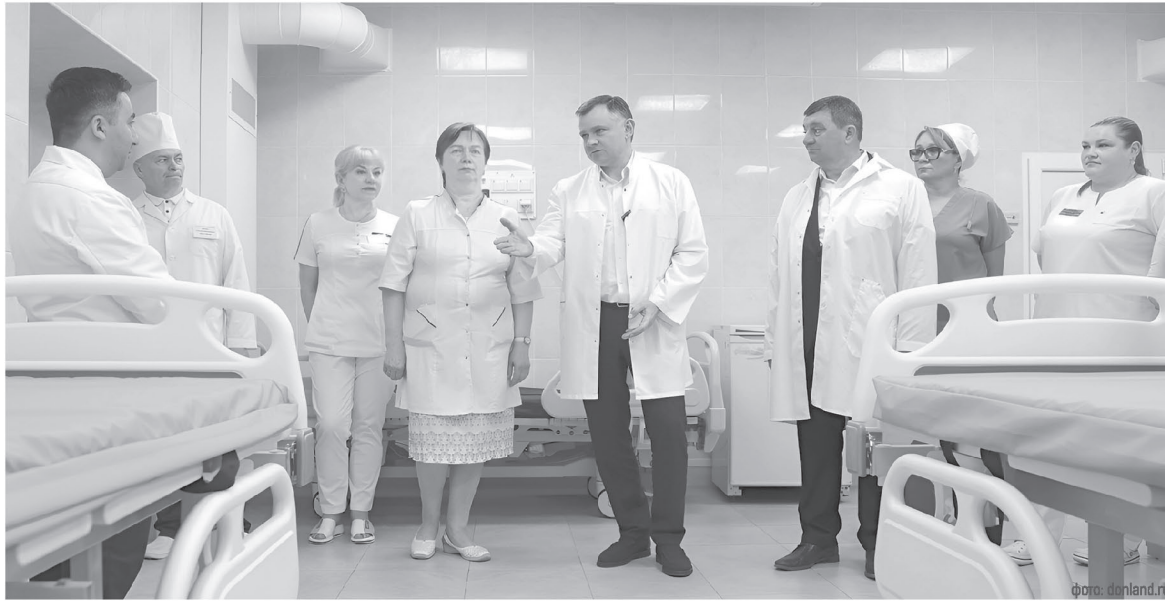
Юрий Слюсарь поручил решить проблему нехватки кадров в ЦРБ Зимовниковского района