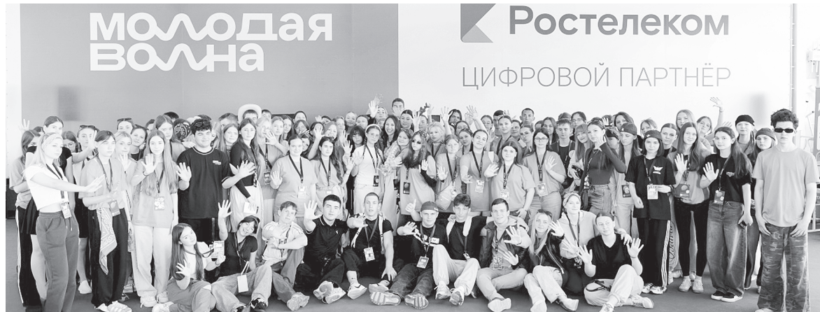
Участие в форуме «Молодая волна» стало для ребят не только возможностью получить новые знания и компетенции, но и площадкой для личностного роста, обретения новых друзей и единомышленников.

Возвращаясь домой, участники делегации поделились своими впечатлениями: форум подарил им заряд энергии, вдохновения и уверенности в том, что молодежь Аксайского района готова развивать свой родной край и вносить вклад в будущее всей страны.