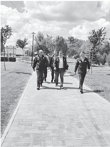
Глава администрации города на выездном совещании.

В первую очередь руководители посетили Мухину Балку. Евгений Николаевич дал поручения привести в порядок мангалы и тщательней следить за тем, чтобы не переполнялись урны.