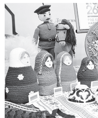
Выставка в фойе.

Еще один районный фольклорный фестиваль «Играет песня над Доном» в этом же концерте собрал на сцене ансамбли песни и танца русской и казачьей культуры.